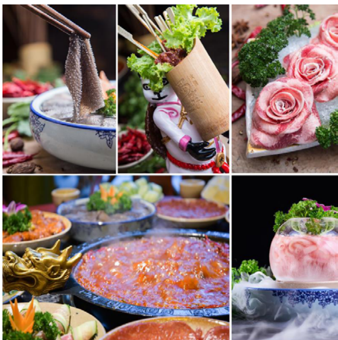
米大王 蜀大侠的菜品非常新鲜

第一次走进蜀大侠，一定会被震惊！这哪里是火锅店，明明就是一片江湖地。进门是一扇“侠客行”，墙上彩绘“天龙八部”，菜品摆出“八卦图”，锅底器具上雕刻“双龙会”，浓郁的武侠风，用老板的话说：“火锅，两个字，一横一竖。聚天下好友，也煮世间万物。”