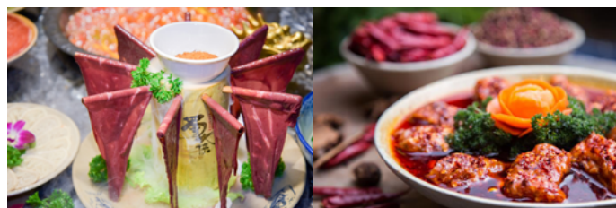
米大王 大刀肝片和花千骨

还有“舌尖上的蜀大侠”、“太极双滑”、“贵妃牛肉”、“大刀肝片”……每一道菜式，都是菜品与武侠典故的结合，非常有特色！