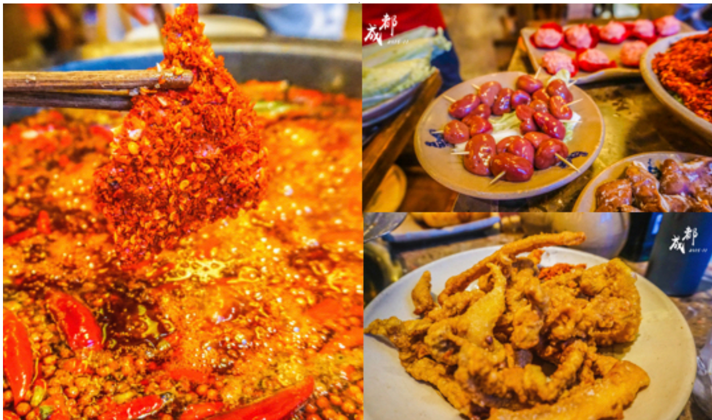
叁叁 四川的火锅是越吃越辣呀，因为放了很多香料，越煮越有味儿