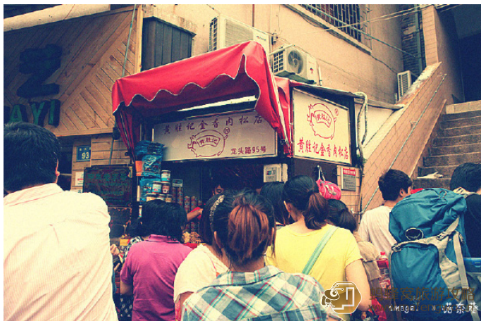
诺奈葵 生意火爆的黄胜记金香肉松点

非常火爆的肉脯店，日日夜夜都被里外三层的人群包围。号称有百年历史的老店，肉脯、肉柳和肉松做的绝对有水准，每一种都可以先尝味道，而且店老板也如传说中非常热情，会给你热的刚出炉的肉脯、肉松，试吃品都非常大块。