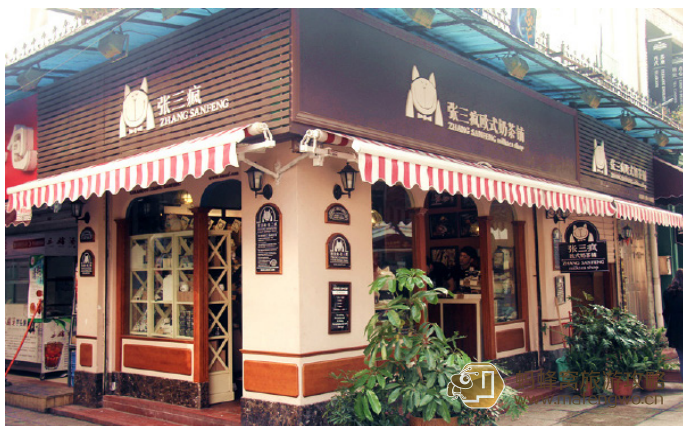
随风 张三疯奶茶店

淡若梦影 奶茶店除了出售各种口味的奶茶、小零食，另外就是泥塑的张三疯。店主把自己的爱物，变成一种固态记忆，让四方游客连同对鼓浪屿的回忆一起带回家，可谓一种不错的创意。