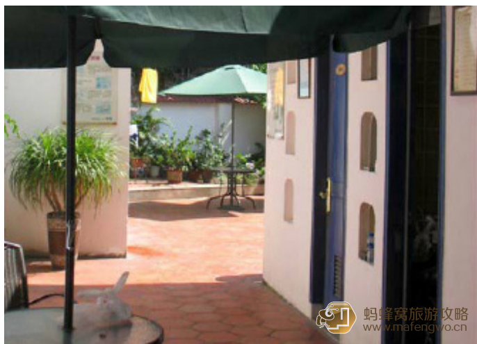
赵强 ty 鹭飞国际青年旅舍

鹭飞所在的房子，本是一栋老建筑，后来经设计师装修成地中海风格的青年旅舍。经常有来往的游人，把鹭飞的外观和庭院当背景，拍照留念。在岛上，鹭飞的价格居中，多人间一个床位平时70元，温馨榻榻米220元，浪漫爱琴海320元，阳光地带、丽景海岸、极地雅轩350元，另外，持有国际青年旅舍会员卡的朋友，可享受九折优惠。