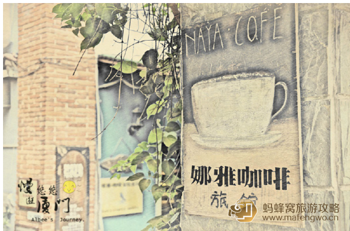
湓生 娜雅自助家庭旅馆