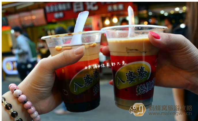
末禧 八婆婆烧仙草

夏霖不锈 在厦门每天都要来杯烧仙草，很是解渴。不推荐蜂蜜的，个人觉得太甜了。配料很丰富，超级喜欢 QQ 的芋圆，很有嚼劲。