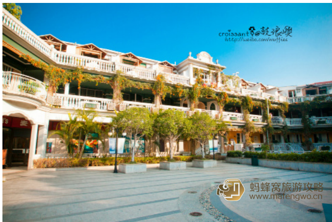
小小雀斑 娜娜鼓浪屿海岸旅馆

娜娜鼓浪屿海岸旅馆即娜娜连锁度假旅馆的分店，为一栋白黄色建筑，这里是鼓浪屿上最著名的旅馆，环境很好，地理位置便利，上了岛就到了。一个个风格各异的欧式小房间，感觉自己身在童话城堡中，而且一半以上的房间都能望到大海，订房还送咖啡券和环岛路的观光车券哦。不过这家旅馆极为抢手，如在旅行旺季，最好提前预订。