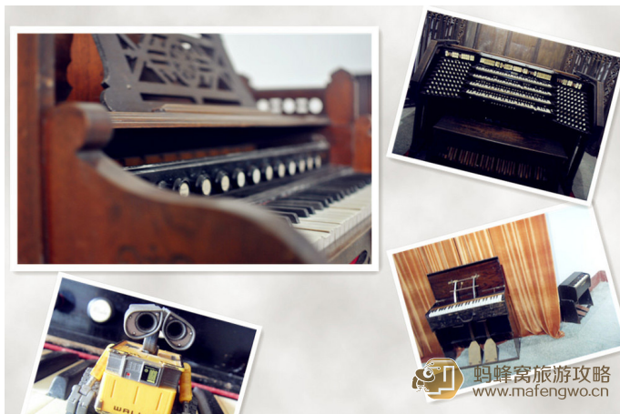
苏颜朵 风琴博物馆

风琴博物馆也是由爱国华侨胡友义先生提议筹建的，全部馆藏均来自胡友义无偿捐赠。这里有教堂用的管风琴、有法国最著名的簧片风琴、有专供有钱人使用的“爱奥里安”风琴、有卖艺用的小风琴、有带镜子的风琴、有带烛台的风琴、最大的数层楼高，最小的有如手提行李箱。