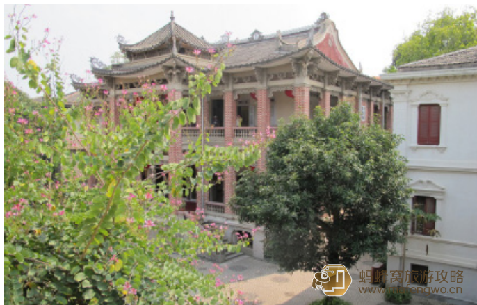
大大大炜炜 海天堂构

具体木偶戏与南音表演时间表，见鼓浪屿官方旅游网站： http://go.gly.cn/