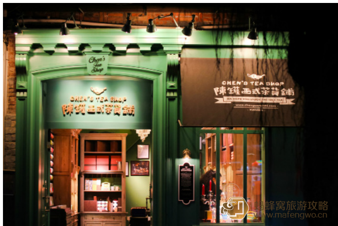
小小小雀斑 陈罐西式茶货铺