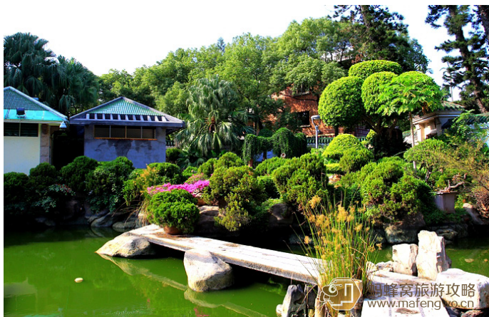
年波也则 菽庄花园

御磨的驴 菽庄花园和钢琴博物馆在一起，应是鼓浪屿的典型代表景点，应是反映鼓浪屿所谓高雅情调的地方。菽庄花园这样沿海边建的园林确实不多见，巧用岸边的石头，借海景将一弯石桥架在海边的礁石上，视野开阔而不失园林小巧精致的韵味，有点特色。