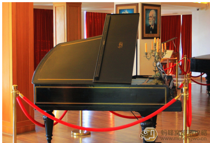
年波也则 钢琴博物馆

无敌临工 1号馆和2号馆共藏有各色钢琴上百台，参观完后应该可以大致了解钢琴的发展史了，就算您不会弹钢琴，在旁边欣赏一下这种结构复杂的大家伙也绝对会让您受益匪浅！最令我印象深刻的就是那几台自动钢琴，居然只用脚踏就可以自动演奏曲目，在没有留声机的时代这简直是神器！