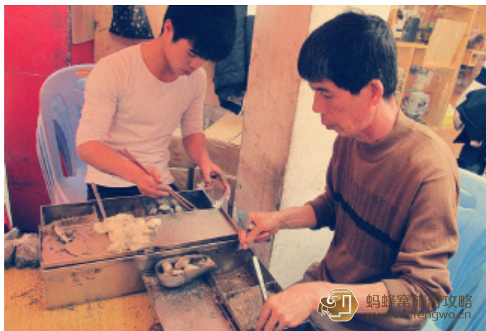
大大大炜炜 叶氏麻糍

鼓浪屿龙头路的三岔口有一种不可错过的小吃“叶氏麻糍”，至今已有百年历史。在大多数人看来，百年的发展仍停留在一个小摊车似乎不可思议，但小本生意就一直这么经营了下来。摊主拉出摊车下面的抽屉，取出糯米糍粑，裹入花生碎、黑白芝麻碎和糖粉混合成的馅料再揉成团，滚上一层黑芝麻粉，一份“麻糍”就做好了。味道甜而不腻，糯而不粘，好吃得很。一元钱，就让海岛上往来的游客有了一个香甜的回忆。