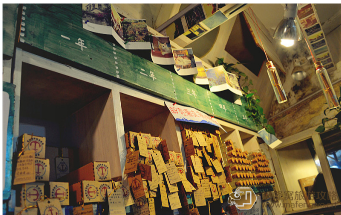
贴心 漂流慢递寄给未来的人

Macuda 找了家明信片店——漂流慢递，坐在里面写了好多。明信片 3 元一张，代寄 2 元一张。这些写着日期的木盒子，你可以把明信片放入其中，那么直到未来的那一天才会把明信片寄出，那么收到的就会是一个大大的惊喜。