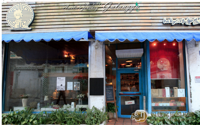
游侠 Babycat 私家御饼屋

青青河边草 岛上有很多家卖馅饼的店，这家是不容错过的，每天 14:00 新鲜的馅饼运送到店，一点半店里已经挤满了人，最夸张的有人买了八十盒，排了半小时才买到，的确很美味，绿茶和椰蓉的最好吃。