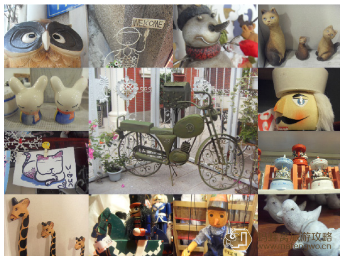
苏颜朵 个性又可愛的鼓浪嶼手信

鼓浪屿还是有名的“琴岛”，素以钢琴著称，所以在钢琴博物馆里卖的黑桃木制做的笔架、匙扣、印盒等饰品上，都雕刻有馆内珍藏的各式各样的钢琴，这类纪念品也是非常有价值的。