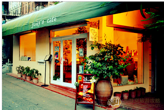
贴心 优雅安静的 Judy's Café