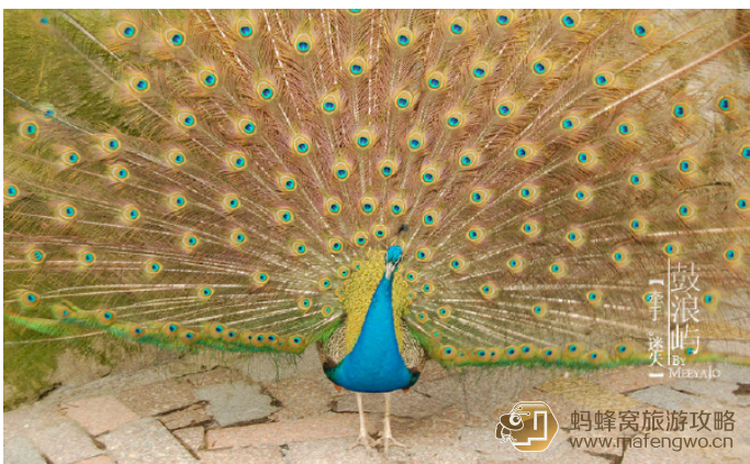
meeyajo 百鸟园里的孔雀开屏

琴园漫与东面的日光岩相望，有旋律广场、琴思广场、流音园、余悠门等，可谓处处与钢琴有着千丝万缕的联系，园中还有人鸟同乐，佳趣天成的百鸟园，游人可在园内尽情欣赏、聆听五彩斑斓的珍奇鸟类表演与鸟鸣，实在是会使人乐不思归。