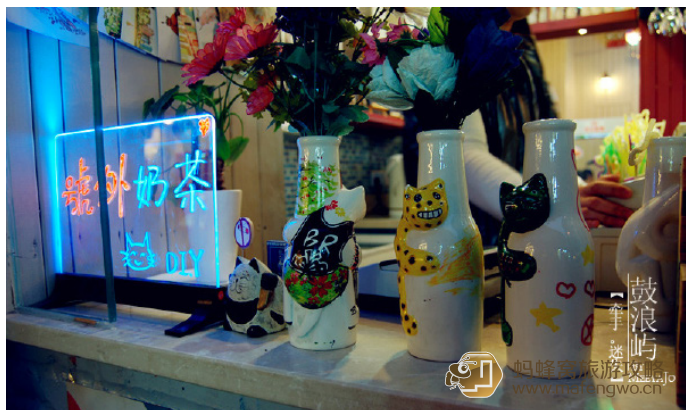
meeyajo 有趣的猫咪奶茶瓶

太多人走进“号外奶茶”是被窗口那些手绘瓶子吸引，太多人买“号外奶茶”是因为要那个手绘的瓶子，太多人记住“号外奶茶”是因为看到那只属于鼓浪屿，却名叫“号外”的瓶子，那只胖胖的笨猫，紧紧抱着一个阔口瓶子，可爱的令人过目不忘。