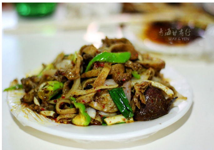
FINAL HOME 爆炒羊肉 & 猪蹄闷疙瘩