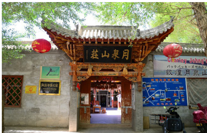
异域 月泉山庄正门