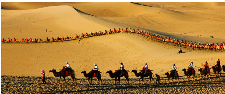
唐人立逃学去旅行 鸣沙山

JOJO 带你游世界 如果说穿梭奔腾于高山峡谷的万里长江是一首雄浑的交响乐曲，那么静卧在河西古道的敦煌无疑是一部气势恢弘的历史长卷；如果说蜿蜒盘旋于崇山峻岭之间的万里长城是一条腾飞的巨龙，那么沉睡在丝绸之路上的敦煌无疑是一条跃动的艺术长廊。