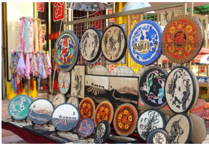
iLuvT 旅图 骆驼形象的工艺品 & 沙州市场上的各类工艺品 & 沙州市场上的各类工艺品

敦煌市内有名的购物场所所有沙州市场、飞天商场、天马商场等，大多集中在市中心反弹琵琶雕像的四周。敦煌的工艺品以反弹琵琶像、飞天雕像、夜光杯为主，还有各式各样骆驼造型的纪念品。