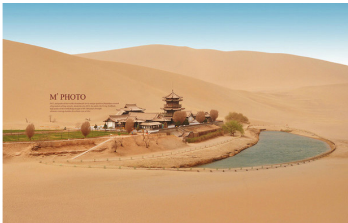
叫我小缪 在鸣沙山怀抱之中的月牙泉

驼队缓缓行进在落日下的大漠，驼铃声鸣响在耳畔，清澈的月牙泉（见第4页）静卧在起伏的鸣沙山中，与散发着缕缕金光的天地融为一体。沙山之上，碧水相依，相映成趣，是为奇景。