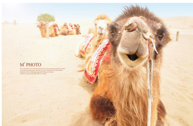
叫我小缪 萌萌的骆驼

鸣沙山位于敦煌市南6km的沙鸣山北麓，在狂风怒吼时，沙山会发出巨大的响声，轻风吹拂时，声音又似管弦丝竹，故名“鸣沙山”。历来水火不能相容，沙漠清泉难以共存，但在鸣沙山中，却能看到沙漠与清泉相伴为邻的奇景：月牙泉被鸣沙山环抱，长约150m，宽约50m，因水面酷似一弯新月而得名，这是鸣沙山景区最著名的地方，充满了色彩和生机，宛如大漠羌笛声中的一段江南牧笛声，婉转清扬，欢快灵动。