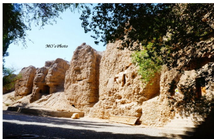
默默的莫小菲 西千佛洞

地址：敦煌市区西南 32km 费用：30 元 / 人，学生半价 到达交通：属敦煌西线游，包车西线一天约 350-450 元 用时参考：1-2 小时