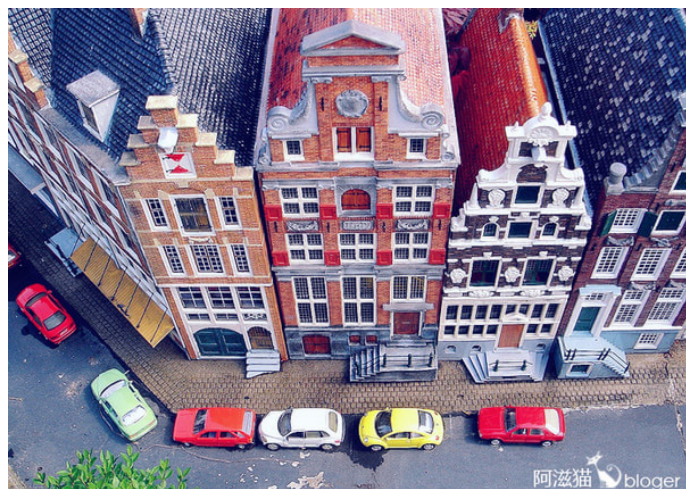
阿滋楠 马德罗丹微缩城

苏达水 如果说，到了艾菲尔铁塔，就可以领略到整个巴黎，那么，到了“马德罗丹小人国”，就等于一次将荷兰尽收眼底。这个景点真心推荐，你可以感受下阿姆斯特丹的老火车站，买上一张票，吹着空调，欣赏着荷兰乡村的景色，来到位于海牙市境内的马德罗丹小人国。阿克马的奶酪市集、海牙和平宫、乌特勒支的圆顶大教堂、阿姆斯特丹水坝广场旁的皇宫、国立博物馆、运河沿岸的古老建筑，你不会错过任何景色。