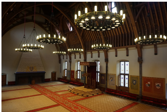
大龙爱北京 国会大厦内部礼堂