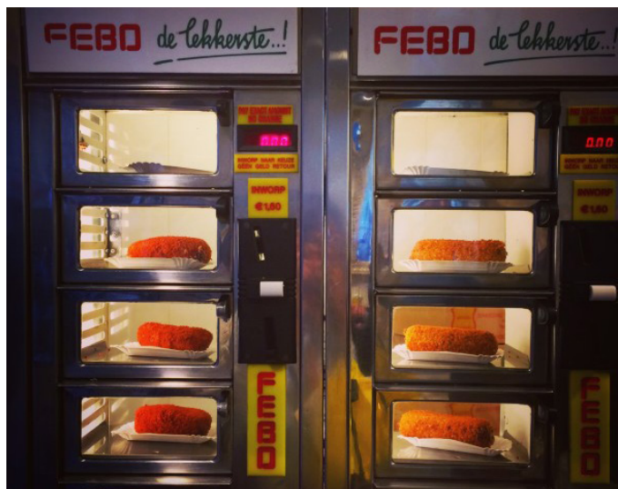
PlumpPillow FEBO 快餐店