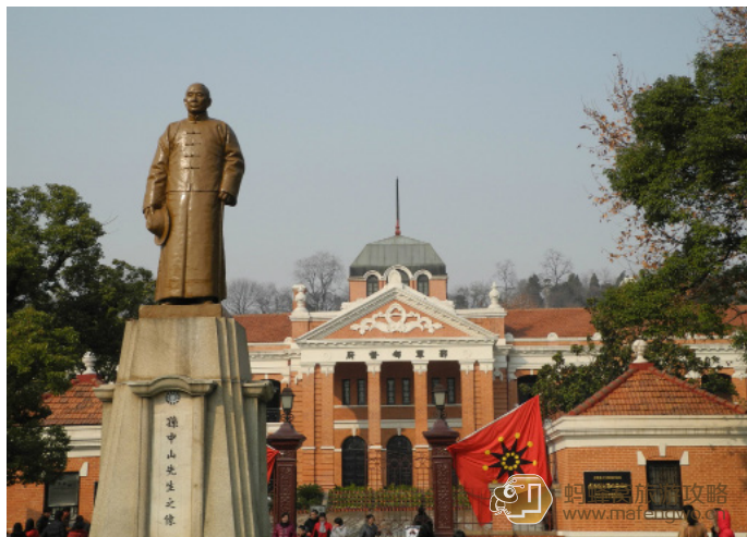
天边一只雁 武昌起义军政府旧址，为鄂军都督府