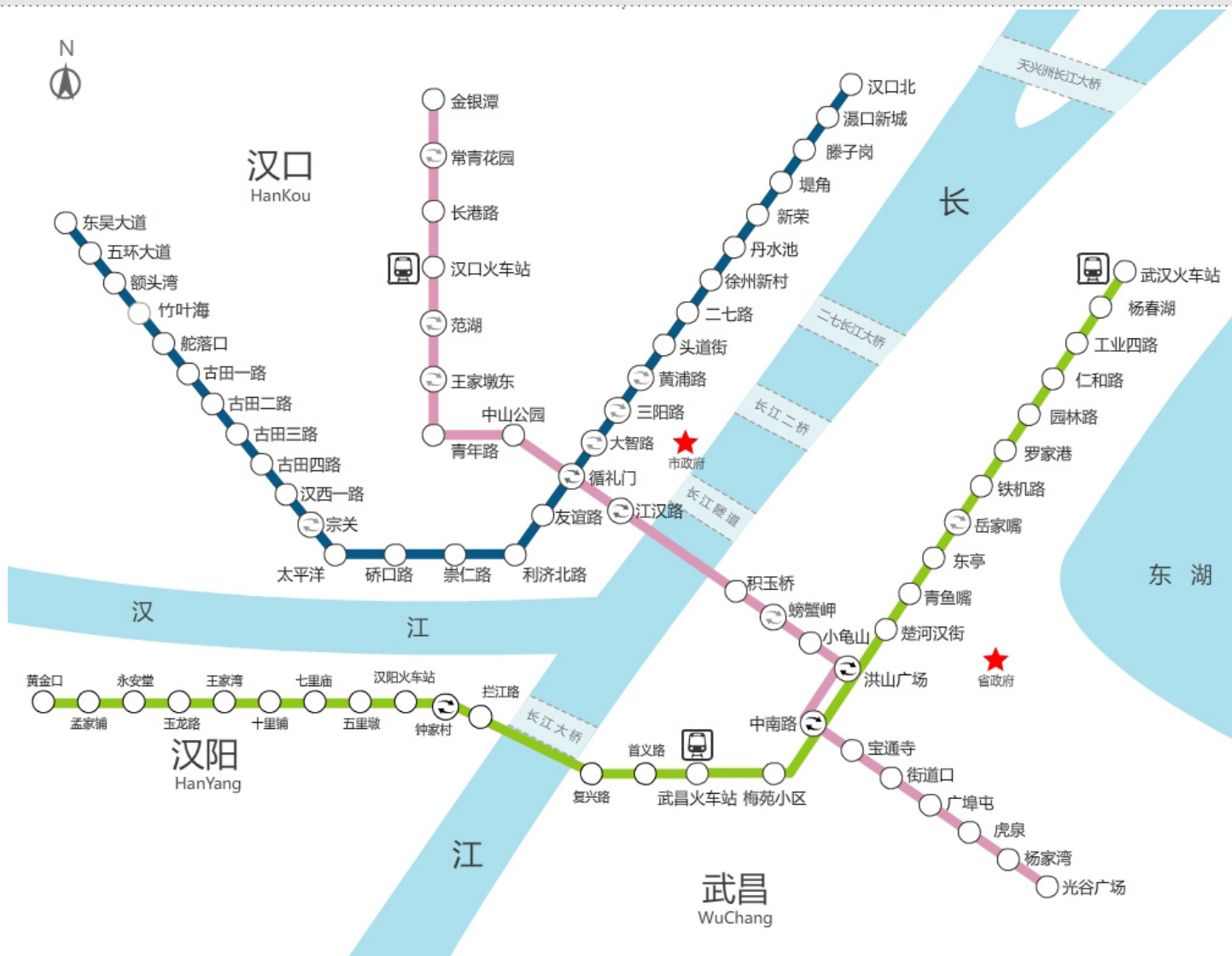
1 号线蓝线；2 号线粉线；4 号线绿色