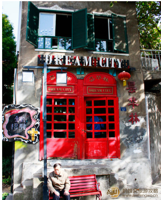
Fangqiao 老人坐在椅子上睡着了，这里很多人拍照，他似乎已经习惯当模特了

昙华林范围比较大，全部走完要大半天时间，应该根据自己的时间安排合理选择游玩区域。