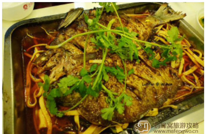
Lucifer 同学 这类类似于红烧的武昌鱼，可以吃出烧烤的味道，而且肉质细腻，加上了香菜淡淡香气，丝毫不油腻，连鱼皮吃着都很香

拥有独创秘方，主料全部采用新鲜活鱼制成，口味鲜活嫩香，外焦内嫩，胆固醇低，营养丰富。品种有烤草鱼、烤鲢鱼、烤财鱼、烤鲫鱼、烤土鲢鱼、烤桂鱼等。