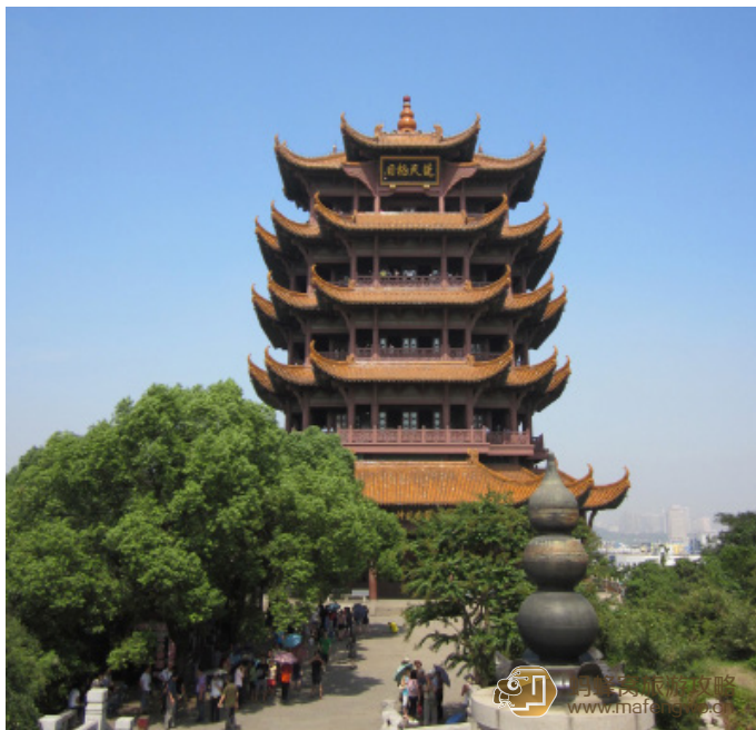
浅浅 Vera 黄鹤楼全景