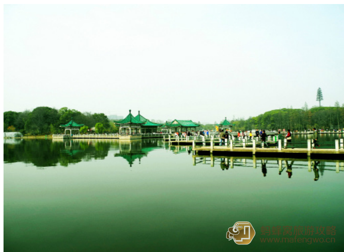
天边一只雁 听涛风景区九曲桥

东湖是我国最大的城中湖，虽然没有西湖有名，但风景却不一定比西湖差。东湖的花木品种繁多，一年四季不断开放，其中尤以春兰、夏荷、秋桂和冬梅最为著名。东湖周边有听涛、磨山、落雁、吹笛四大景区，景区各具特色，移步换景。