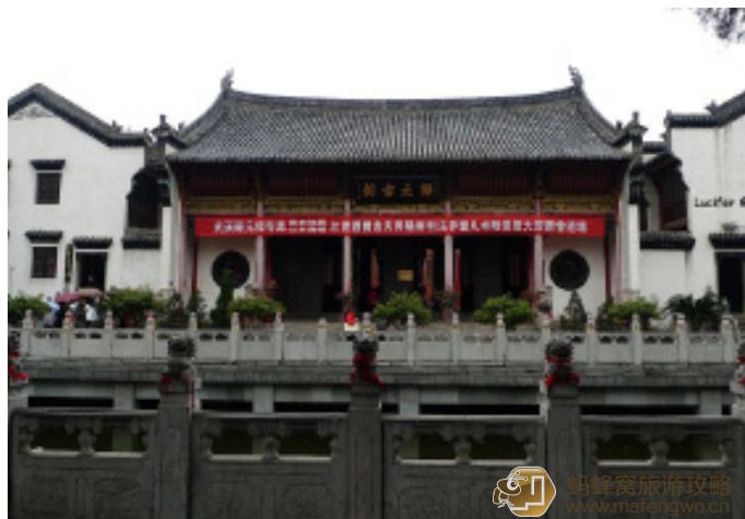
Lucifer 同学 左手边有万佛殿、罗汉殿等