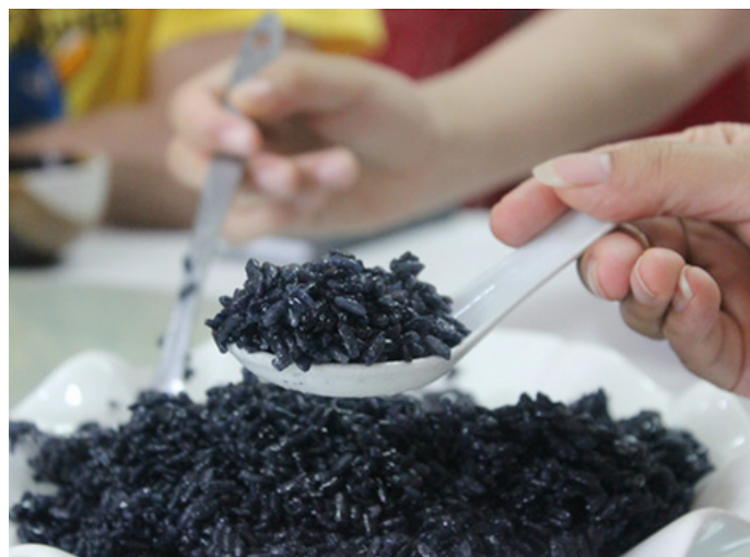
陌上纤虹 特色乌米饭

湖汊人将采集来的野生植物乌饭树的叶子煮汤，然后用所煮的汤将糯米浸泡半天，再捞出糯米放入木甑里蒸熟，就做成了乌米饭。乌米饭看起来油亮诱人，入口香甜可口，带着淡淡的清香。