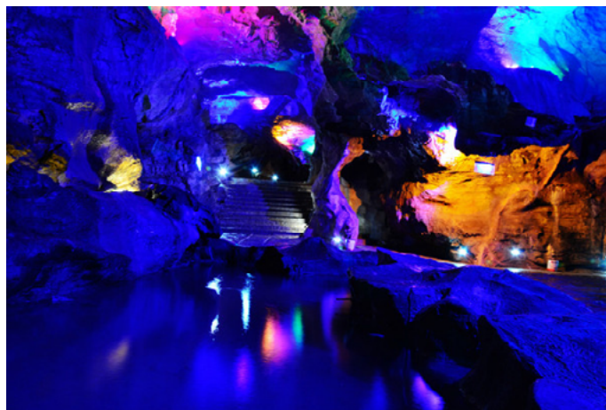
志远天下行 灵谷洞内

志远天下行 洞内钟乳千姿百态，石笋石柱如林。灵谷洞内林林总总的钟乳石造型，龟蛇虎豹、马牛羊鸡、山村黎明、流水飞瀑、男女老少、僧尼道士等，处处有景，景景皆奇，构成了一个生气蓬勃的世界，不得不佩服大自然的鬼斧神工。美妙绝伦的钟乳石景观，带给人们强烈的视觉冲击和心灵震撼！