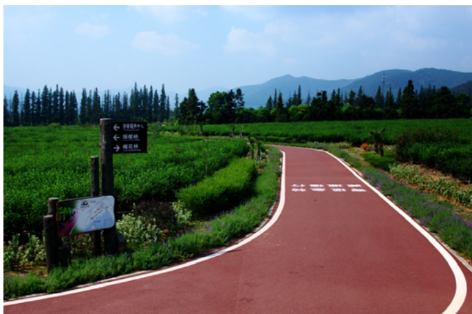
淡无盐 深氧健身公园

湖汊是个天然的氧吧。清朝的皇帝，避暑就去承德山庄，是约定俗成的惯性。近年来湖汊提出了回归健康 (Health)、回归心灵 (Heart)、回归家园 (Home) 的“3H”理念。想体验清新的空气之旅，就必来湖汊。这里空气清新，氧气充足。在这可以漫步、骑行等，深入感受湖汊的自然风光。