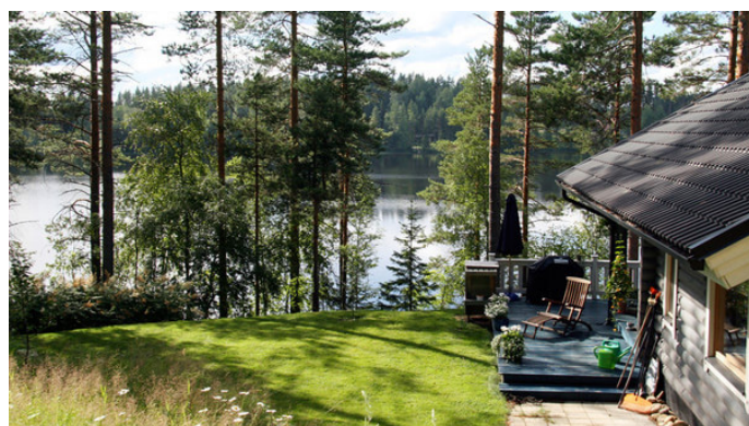
暧昧小妞 海滨小木屋, 偷得几日闲

暧昧小妞 最后几日在湖畔木屋 Rastila 小住的日子, 让我呼吸到了自由的空气, 感受到了身心的畅快。体验了纯正的芬兰蒸完桑拿之后, 在午夜太阳的照耀下去湖中畅游到深夜, 那感受简直让我舒服的不想回家了。