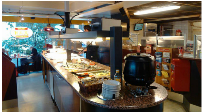
油漆匠老米 Rax 餐厅的自助餐台

油漆匠老米 还是在自助餐厅吃比较安心，付了钱后随便吃，否则拿着餐单看半天，点了一桌子的汤也是蛮悲剧的。