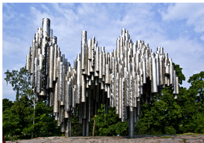
tony0804 阳光下的西贝柳斯

YAN:) 公园一面是在郁郁葱葱的树林里，一面紧邻湖滨，风景非常不错，散步很是惬意。要走到公园的最里面才能看到类似管风琴的雕塑哦！