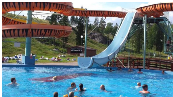
zhang67352 夏日避暑胜地——Serena 水上乐园

到达交通：从赫尔辛基万塔机场乘坐出租车 25 分钟到达，费用约 35 欧；从赫尔辛基中央火车站乘坐出租车 35 分钟到达，费用约 40 欧