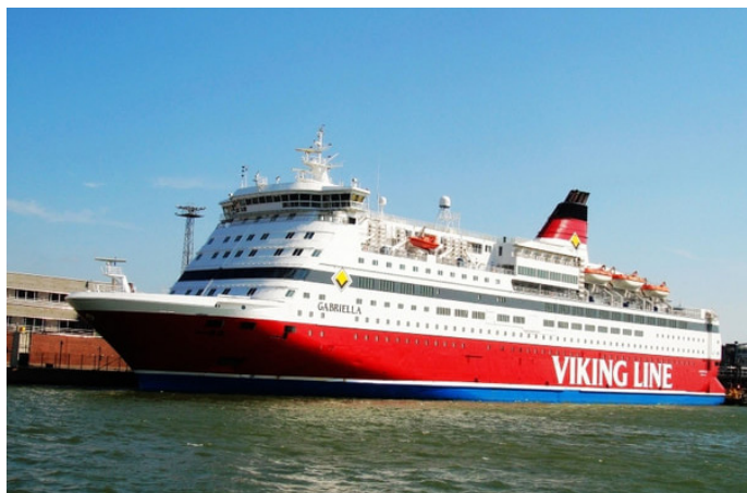
霹雳娃娃 海岸边的 VIKING LINE 渡轮

霹雳娃娃 在瑞典斯德哥尔摩前往芬兰土尔库的船上，有赌场、免税店、酒吧、歌厅……应有尽有，如果你愿意，整宿都可以尽情享受。午夜过后，我和老公才回包房休息，小小的包房可用迷你形容，不过设计很合理。