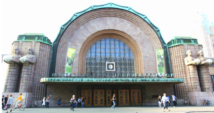
致敬 古老的交通枢纽——中央火车站

兔牙丫丫 赫尔辛基中央火车站的室内配套设施齐全。有 BURGER KING 快餐店、换汇点、休息室、小卖部、寄存室、厕所等。寄存 4 欧 / 格 / 24 小时, 厕所使用 1 欧 / 次。