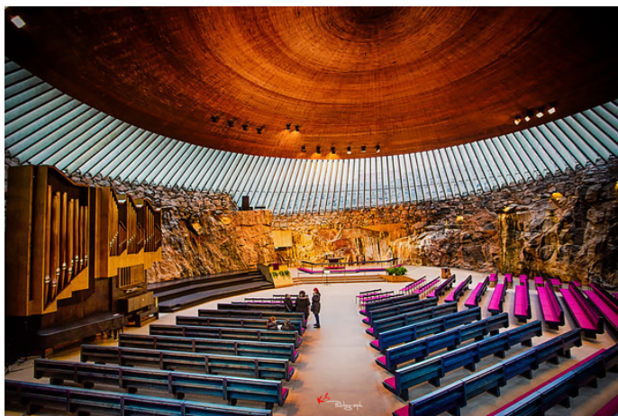
Kyle Shi 古朴自然的岩石教堂

Kyle Shi 一进门瞬间感觉和外面是两个世界，一种散发着神圣的静谧让人不自觉的放缓脚步。教堂共两层，可容纳近 1000 人。整体看起来像着陆的飞碟一样，趣味独具。