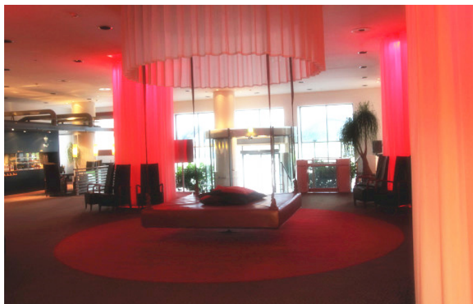
陌晓沫沫 优雅而独具魅力的 Radisson 酒店