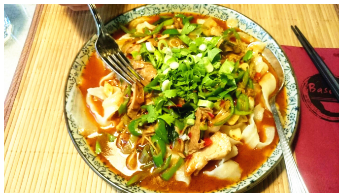
Jennifer 唐广晶 basiliika 招牌面——肥肠拌面