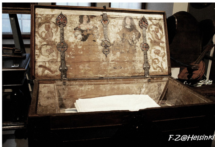
sunflowe 在大峡谷中的长春祠