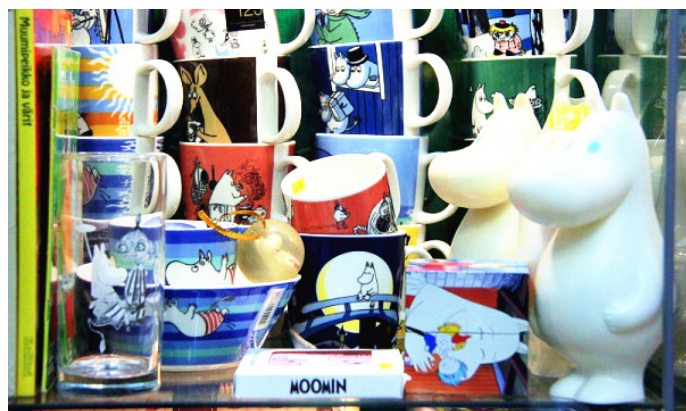
环球旅游体验师 琳琅满目的姆米马克杯

环球旅游体验师 姆米是芬兰文化象征之一。喜欢姆米家族的你，去古董店和旧物店逛逛，会有意想不到的收获。而且姆米收藏价值高，一些姆米的古董马克杯市价已过 1000 欧。