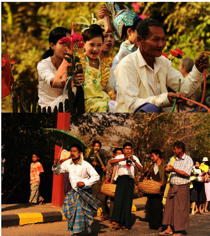
山夫 山夫 蒲甘街头由亲朋好友组成欢送孩子出家的游行队伍

12月上旬，农历9月1日。古时举行拜神活动，从公元1782年起演化成敬拜和奖励“像神一样崇高的”大作家们。1944年缅甸作协正式确定为“作家节”。