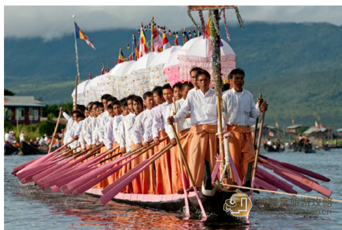
Khakha 单桨划船的桨手们

10月，德丁卒月十五日为“德丁卒”点灯节，这天房屋、公园装饰灯光闪亮以迎接佛陀从天归来；曼德勒附近这时候会有异彩纷呈的大象舞蹈。10月同样标志着斋月的结束。现在可以结婚和搬家了。11月的月圆之夜会迎来第二个灯节，缅甸人称“达桑岱”点灯节。年青女孩们会连夜为僧侣赶制袈裟。在茵莱湖附近的东枝，五颜六色的气球遮住了天空，庆祝斋月的结束。