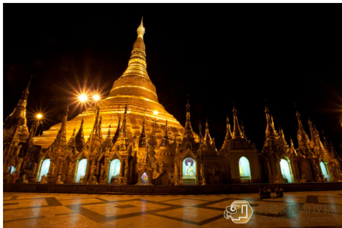
夜色下金光闪闪的大金塔

到达方式：可在苏雷塔附近乘坐 43 或 204 路公交 Shwedagon Pagoda 站下车；从苏雷塔附近乘坐出租车约 2000 基亚