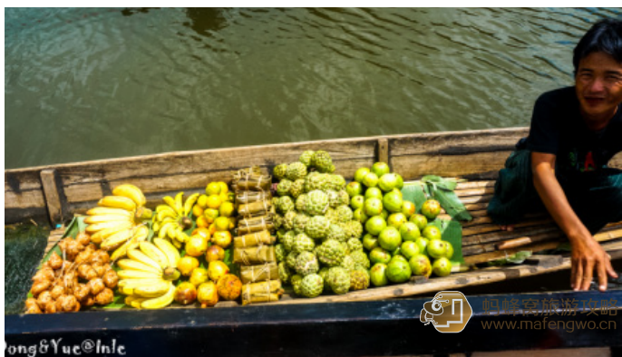
与子成說 划船卖水果的商贩

茵莱湖区每五天在湖上分几处举行一次水上集市，人们从这里买回各种食品和日用品，许多渔民菜农也把鲜鱼和蔬菜运到这里出售，进行商品交易。另外就是针对日益增多的游客摆出各种富有民族特色的手工制品和旅游纪念品。比较著名的是伊瓦玛水上市场，商贩划船在湖上穿梭，主要售卖生鲜蔬果。陆上的茵汀市场也十分活跃，这里的特色纪念品更多一些。关于市场地点和日期详询酒店前台或者包船船夫。