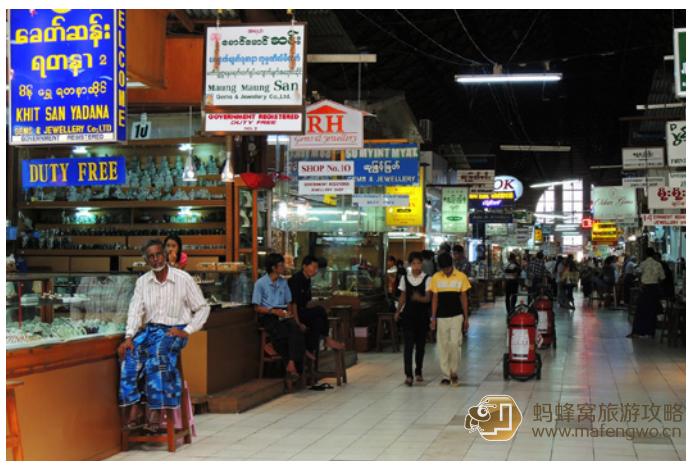
老张 昂山市场，缅甸的小商品批发市场