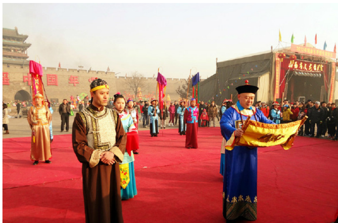
Initial Dream 每天 9:00，在古城迎薰门广场会举行简单而隆重的迎宾仪式

除了过年，目前平遥在中秋、端午等传统节日也会举办类似社火的游街活动，以吸引更多游人；本地的演员会穿着传统服装，在大街上列队而过，表演一些演出项目。