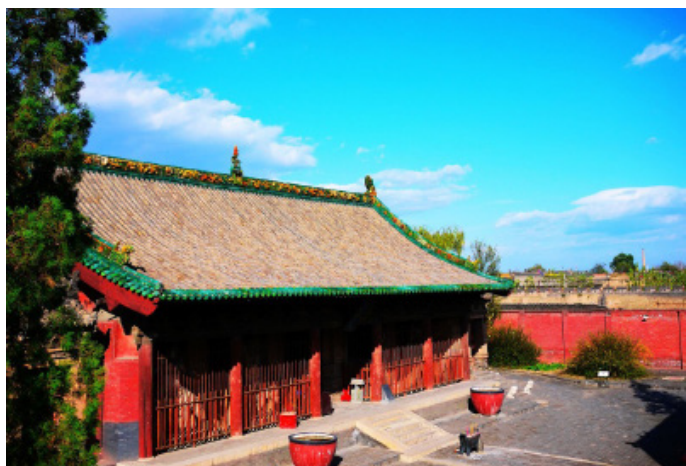
Wolfatwar 双林寺，是座历史悠久的佛寺

Wolfatwar 来之前对介绍的周边景点没抱太多期望，多是陪衬罢了。孰料双林寺真是一个绝佳去处，让人惊呼连连，游后一致认为不虚此行。双林寺中的唐槐、宋碑、明钟及古代建筑、彩塑和壁画，都是稀世珍宝。尤其是寺中两千多尊彩绘泥塑，更令人称道不已。