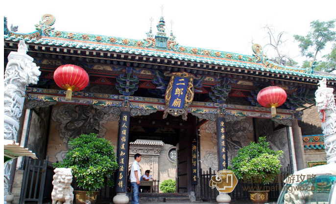
JOJO 带你游世界 二郎庙是北大街唯一一处比较有看点的地方

小鸡丁 在这里，你可以感受到道家的气息，其中太岁、28星宿、东岳大帝、送子娘娘都能让你再次了解道家神仙的魅力。2013年属蛇、鼠等生肖的朋友可以去拜拜太岁，另外千万不要让小孩进去拜哦！