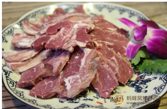
cissy_莉儿 平遥牛肉，很嫩很好吃

选用优质的小牛腿肉煮熟后腌制而成，肉质鲜嫩、肥而不腻、瘦而不柴、香酥可口。平遥牛肉的制作工序，概括起来有三个字：杀、腌、煮。在平遥任何一家餐厅都能吃到。若是喜爱，还可以买些真空包装的带回家。