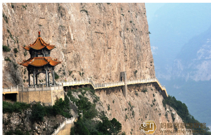
笨笨熊 介休的绵山

春秋时，晋公子重耳流亡于外，介子推跟随他漂泊了 19 年，并在他饥不能食之时“割股奉君”。后来重耳复国，成为春秋五霸之一的晋文公，介子推却没有邀功请封，而是带着老母亲隐居在绵山。晋文公得知此事后，随即赶到绵山请介子推出山，奈何他高低不肯出来，于是晋文公放火烧山，以为介子推一定会出来。大火连烧三日，整座山都烧完了，仍不见他的人影，派人进去一看，原来介子推已经和老母亲抱着一棵树烧死了。晋文公懊悔不已，于是用这块残木作了一双木屐，以此提醒自已不忘介子推，“介休”之名亦是从这件事而来。