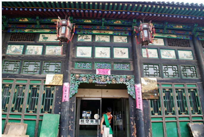
JOJO 带你游世界 平遥邮局

向左转，朝 221 省道行进，接着向左转，进入顺城路，从环岛的 3 出口出去 300m 即到，约 15 分钟