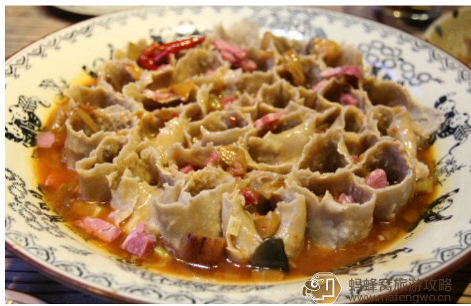
cissy 莉儿 平遥莜面栲栳

本是忻州地区的一种特色面食小吃，渐渐成为整个山西地区的特色食物之一。因外形似农家专门用来打水或装东西的一种用具——“笆斗”，民间叫“栲栳”而得名。不仅名字奇特，制作也很讲究。用手掌将和好的莜面在光滑的板面上推卷成筒状，长寸许、薄如叶、色淡黄。之后挨个并排放置在蒸笼内，形似蜂窝，蒸熟即食。吃时最好蘸以羊肉或蘑菇汤，味道更是鲜美。