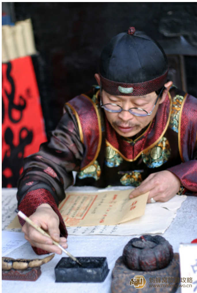
江山知己 在日升昌里写票号的老先生

最特别的是，你还可以让一位长袍马褂留长辫的掌柜老先生给你写张汇票（20 元 / 张），用的是最早的汇票方式，有图案防伪，盖章防伪，暗字防伪。留着纪念也很不错！