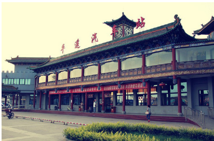
穷败败 平遥汽车站

到达交通：步行从古城北门出门直行约200m再左转约200m即到；或乘人力三轮车前往，5分钟可达