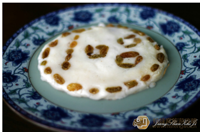
江山知己 一品长山药，这个山药里面是有豆沙的

JOJO 带你游世界 平遥四大美食里面最好吃的就是长山药，其被切成长短、大小各异的小弯刀形状，上面淋的金黄色蜜汁风味独特。脆脆的，咸咸的，甜甜的，有一种马铃薯的味道，但又不像马铃薯般软烂。