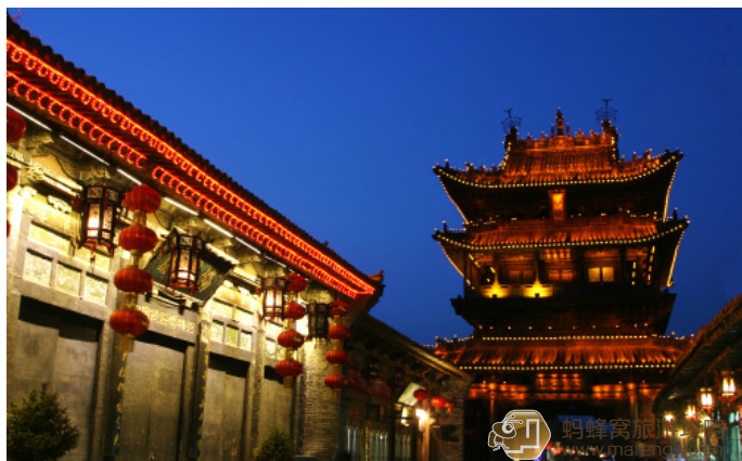
江山知己 夜色下的古市楼

JOJO 带你游世界 市楼是整个古城的中心，登市楼额外要花5元钱，从市楼可以纵观整个南大街。