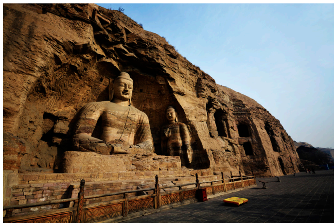
达达达达芬奇 大同云冈石窟