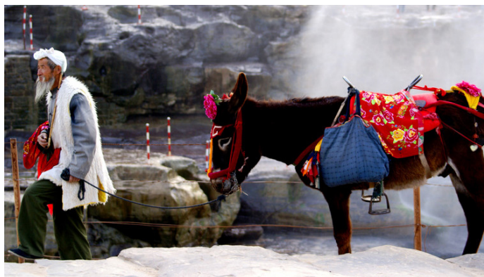
JJ 壶口瀑布景区内牵毛驴的老汉

山西壶口景区内会有装扮得及富当地特色的老汉，牵着毛驴在景区内揽客拍照，20元/次，淡季时可适当砍价。骑上毛驴的游客有一身专门的行头——花衣裳和红头巾。在黄金周期间，还可能看到唢呐表演、腰鼓表演以及胸鼓、斗鼓、秧歌表演。如在山西临汾侧，可提前打听有没有旱地行船的表演，顺便一观。