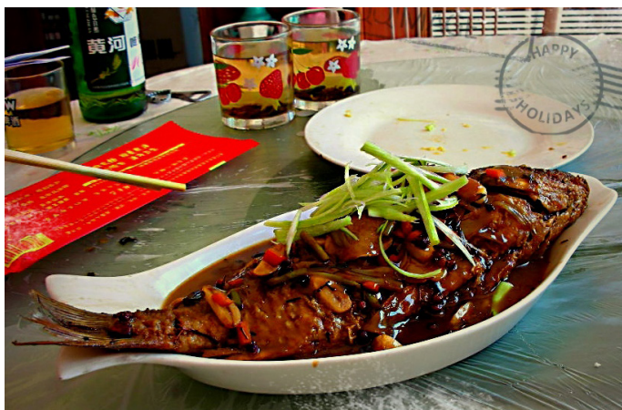
牧马人的围脖 2012 不得不尝的黄河鲤鱼 ~~~

因为壶口瀑布在黄河边，因此，黄河鲤鱼可以说是到壶口瀑布最有特色的一道美味，黄河鲤鱼多集中在几十米深的十里龙槽中，鲤鱼可红烧、可清真、可糖醋。但如今，真正的黄河鲤鱼已经非常罕见了，然而价格仍然不菲，上百元一斤起。景区附近的农家乐里也有鲢鱼等其他鱼种提供。