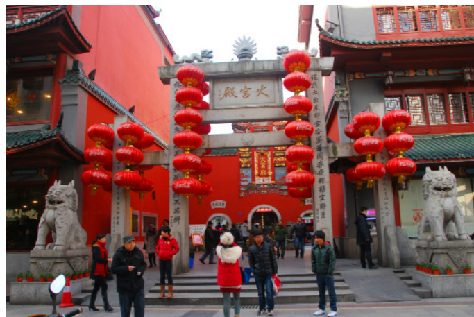
穷游大地的精灵 火宫殿正门

如果想尝尝长沙的风味小吃，可以去火宫殿。一楼流动的小推车分类有各种菜供随时挑选，二楼则是雅座与包房（提供湘菜正席宴，最低消费 500 元）。