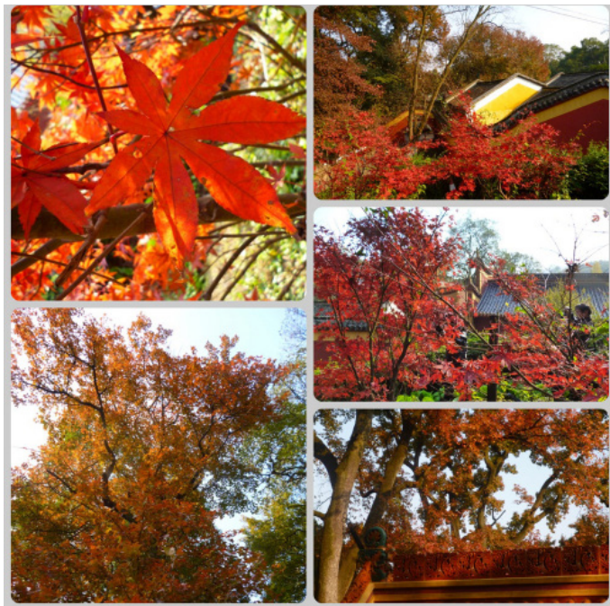
xiaociqw 慢半拍 岳麓山的枫叶属爱晚亭附近的好看。

dongmj 岳麓山是湖南名山，也是中国三大教交汇之地，雨中登山，是一件美事，很有感觉，烟雾缭绕，很有诗意。岳麓山也是一座容纳了很多革命先烈遗体的场所，也是很有革命意义的，上到山中央，下面有一个穿石坡湖，那绿的色彩仿佛进入了梦境一般，真的好美，大自然是万物的造化者，这句话看来并不仅仅是说说的。