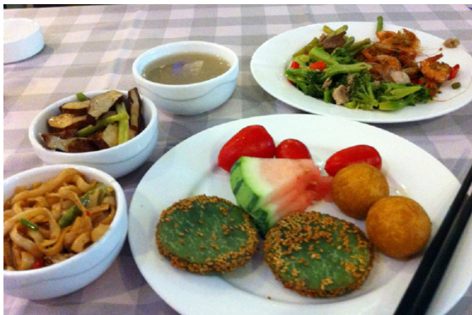
小石头 好来登的自助早餐

小石头 这两天我们都住在长沙好来登酒店，一家不错的四星酒店，自然早餐还算不错，而且是自助的，东西很多，吃也吃不完。