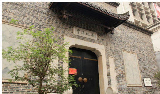
思立皮有点萌 贾谊故居

京西北野 不错，很安逸的地方。虽然不是很华丽，但是很有气质。在太平街难得有这么儒雅的地方。