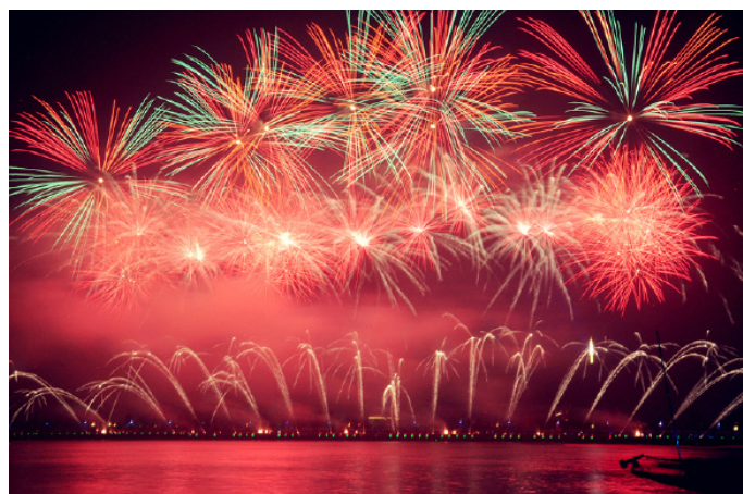
独舞者 湘江烟花只有半小时，但真的好美啊，无比震撼！

从 2010 年 8 月 28 日晚起至今，每周六晚，长沙橘子洲头都会上演音乐焰火晚会，杜甫江阁周边、四羊方尊广场、风帆广场、岳麓山观景台都是绝佳的焰火观赏地。2015 年燃放时间为 5 月 2 日至 10 月 31 日（下雨不开放，遇重大节日将有调整），每周六晚 20:30-20:50。需要注意的是，焰火燃放当晚 18:00 起至运营结束，长沙地铁 2 号线将不停橘子洲站。你可提前乘地铁到达橘子洲，或乘坐公交车在橘子洲大桥东或华图教育（太平街口）上桥往西走，步行至橘子洲。