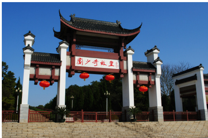
达仔达 刘少奇故里