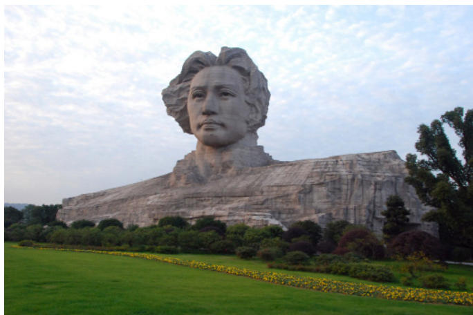
穷游大地的精灵 橘子洲头青年毛泽东同志雕塑

戴眼镜的 长沙号称山水洲城，其实有山的城市不少，有水的城市很多，但有山有水，水中还有洲的城市恐怕还真只有这一座。现在作为市民休闲场所免费开放。洲上有电瓶车可乘坐，但是强烈不建议。只要时间充裕，漫步橘子洲还是非常不错的。洲上有梅园、桃园、桔园等主题性观赏植物群落，也有美孚洋行等文物建筑。只要有半天时间，值得前往。