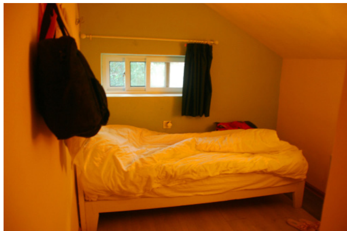
穷游大地的精灵 单人房就一个小窗，其实这应该是阁楼吧。

ヤ尘う落ヤ 晚上七点到达长沙，乘立珊公交专线到预订好的湖湘驿国际青旅（长沙岳麓山店）。可能因为天太暗的缘故，找了蛮久才找到湖湘驿。我在青旅入住的是一楼的六人间（有空调和无线，公共卫浴），房间有些小，但设施齐全，干净卫生，这样的房间对于我来说还是相当满意的。