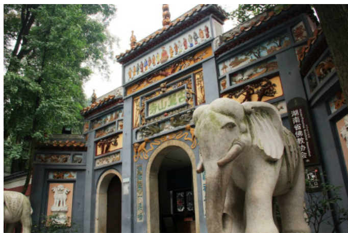
思立皮有点萌 古麓山寺

林下清风 走到了半山腰，一座古香古色的麓山寺便映入我的眼帘，寺门口有一对汉白玉石雕的大象还有两株罗汉松，其中左边一株相传是“六朝遗迹”称“六朝松”，树龄在一千七百年以上，是岳麓山植物界的元老，老干新枝，纷繁蓊郁，弥足珍贵。