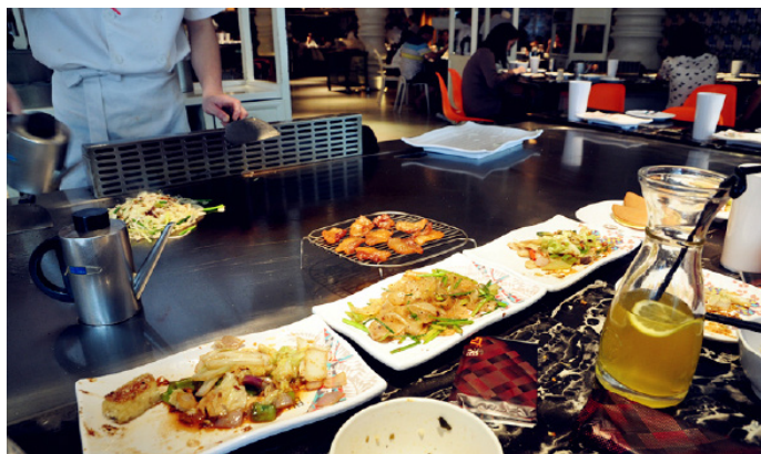
独舞者 57° 湘是一个非常有情调的餐厅，偶灰常喜欢！

地址：长沙市雨花区芙蓉中路二段 195 号（长信大酒店对面） 联系方式：0731-88775757 营业时间：10:30-21:00 到达交通：乘 115、105、159、150 路公交车在小林子冲站下车步行约 200m 即到 参考价格：人均 90 元