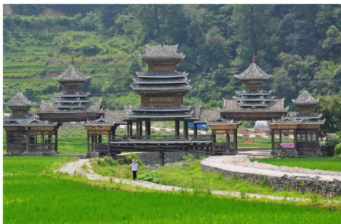
海饼干 肇兴侗寨的五座鼓楼

b、在从江汽车站乘7:50、13:00至肇兴的班车，19元/人，约3小时。也可先从从江乘至洛香的班车，7:00-17:30间平均40分-2小时1班，16元/人，车程约2小时，再从洛香乘三轮车至肇兴，4元/人，约20分钟。洛香步行前往肇兴约半小时。(2) 黎平汽车站有直达肇兴的客车，每天9班，7:20-16:45，票价21元。间隔约1-1.5小时，自驾车在黎平南站上高速，向南行驶，在从江东站(洛香)下高速，然后左转沿纵一线(洛香岔路口至肇兴主干道)直行至肇兴。行程约45分钟。用时参考：1-2天