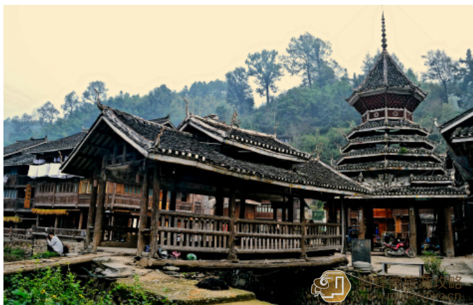
南瓜 侗寨的标志性建筑——风雨桥与鼓楼，诉说着一个民族的历史往事

鼓楼是侗乡的标志，是侗族人开会娱乐的场所，因最顶层放置一个大皮鼓而得名。鼓楼为全木结构，不用一钉一铆，飞阁垂檐层层而上呈宝塔形。