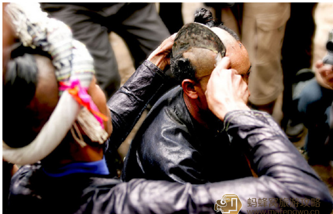
九华山 用镰刀剃发是岜沙人特有的民俗

被誉为“最后一个持枪部落”的岜沙是苗族的一个分支，却又自成一个文化体系。由于早期生存环境的恶劣，苗人枪不离身，刀不离腰，岜沙苗族至今还顽强地延续着战国遗风，男人总是随着枪与砍刀的剽悍气概出现。