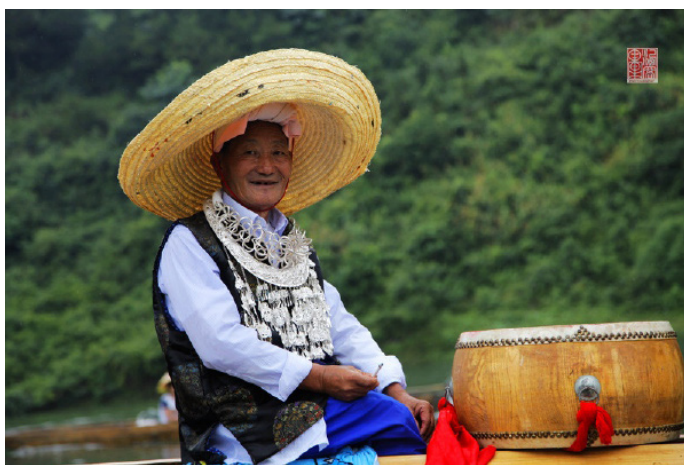
酒窝果果 独龙节德高望重的“龙主”，也称“鼓头”

施洞最有名的是农历五月二十五至二十七的独木龙舟节以及农历三月十五的台江姊妹节。姊妹节在当地历史悠久，既是出嫁妇女回娘家团聚的盛会，又是青年男女相亲对歌的良辰吉日，届时苗家女子会穿上最隆重的盛饰银衣，不遗余力地华丽一番。独木龙舟节在清水江畔举行，相邻的几个寨子轮流比赛划舟，热闹非凡。