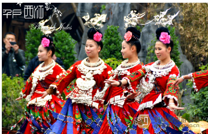
昆仑未央 盛装的西江苗女

西江千户苗寨距离黔东南州州府凯里 35km，距离省会贵阳市约 260km，由十余个依山而建的自然村寨相连成片，是中国最大的苗寨。由于较早被开发，现在的西江已成为商业化氛围较浓的旅游地，道路两旁商铺林立。西江有远近闻名的银匠村：麻料和控拜，从西江走过去大约 20 分钟，这是两个世代手工制作银饰的村子，游客可以拿着样式叫老师傅打给你，按重量算钱。西江每天 11:00 和 17:00 有苗族歌舞表演，时间约半小时。寨子里可以租苗族衣服照相，10 元 / 人。西江苗寨依山而建，层层叠叠，在观景台可看到全景，很是震撼。