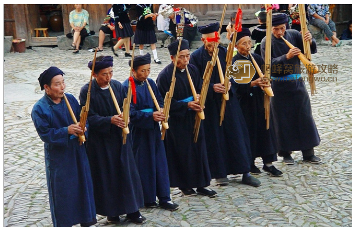
密码 郎德上寨的芦笙舞表演

郎德上寨是清咸丰同治年间苗族起义领袖杨大六的出生地，这里依山傍水，四面被群山环抱，寨前有一条小河静静流过。郎德上寨开发较早，2008 年更因奥运圣火经过于此而风光一时，但随着蓉夏高速的通车，西江千户苗寨的风头已远远超过郎德上寨，郎德上寨又恢复了往日的平静，并且寨子里并没有被过度开发。对于向往清静的朋友来说，郎德上寨是比西江更好的选择，并且适合多住几日。寨子里接待能力一般，只有几间客栈可供住宿，但村民淳朴好客，也可选择住在村民家里，20-30 元 / 人。在郎德，吃饭也要在村民家拼饭，郎德并没有餐馆。