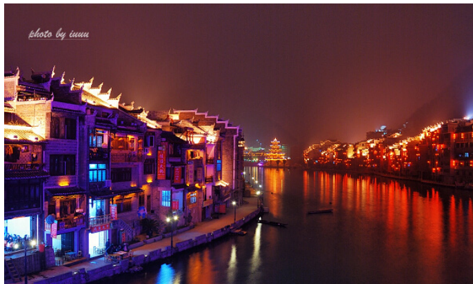
哎哟哟 镇远古城夜景