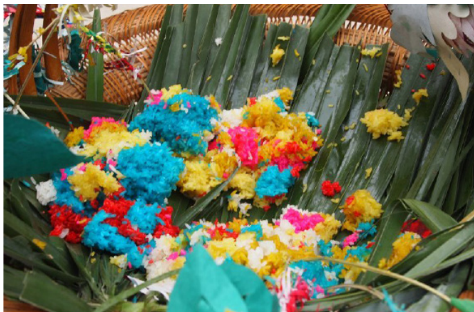
鹰隼传奇 姊妹节的糯米饭

农历三月十五至三月十八是台江县施洞苗寨的姊妹节，这一天，出嫁的妇女纷纷回到娘家团聚，青年男女相亲、对歌，大家都穿上最隆重的衣服，戴上最华丽的首饰。节日当天，妇女们要吃一种五颜六色的糯米做成的“姊妹饭”，这种饭是用姑娘们在山上采集的野花和叶把糯米染成五颜六色后蒸成的，吃姊妹饭是郭姊妹节最重要的传统。除此之外，节日里还有热闹的斗牛场面和“游方”活动。现在的姊妹节已成为台江县非常重要的节日，台江县内各支系的苗族过姊妹节的时间不尽相同，大都在正月至五月间，活动的主会场设在老屯、偏寨、施洞、县城等地方，最具代表性的是施洞地区的姊妹节。届时将展开各种活动，如：苗族盛装迎宾、姊妹节传统民俗活动、盛装游演、开幕式、千人盛装踩鼓、清水江之夜篝火晚会等。