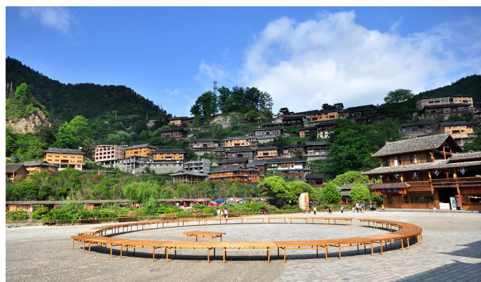
西江千户苗寨的长桌

在黔东南地区，吃得最多的味道就是酸。由于黔东南交通不便，当地缺少盐巴，于是以酸取而代之，时间久了，酸变成了黔东南以及贵州其他地区的特色。酸分为红酸和白酸，白酸仅由米汤做成，红酸还有西红柿。白酸清淡一些，红酸浓烈一些，在汤里加蔬菜和肉类，是当地人的饮食习惯。