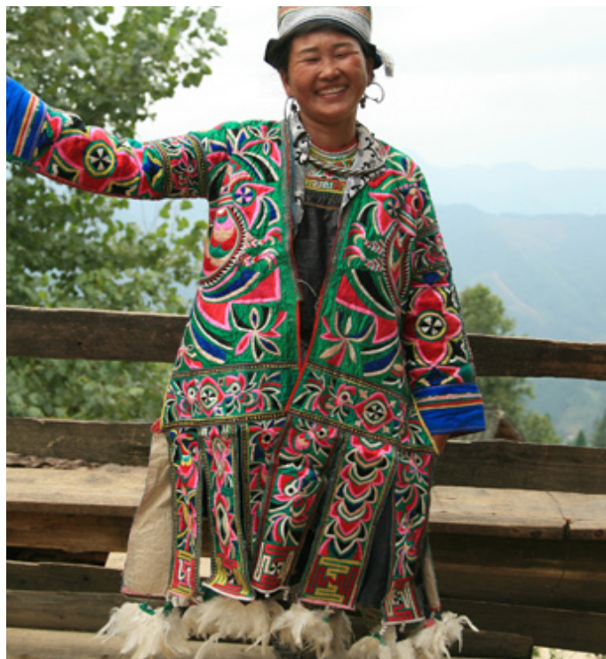
白水泥 一件百鸟衣呈现我的面前，终于解开了我此行的谜团。精美的刺绣加上吊坠着的羽毛，这是摆贝人的象征

这个苗寨是月亮山里最古老的苗寨之一，历史非常悠久，他们的服饰被称为百鸟衣，衣上绣满鸟儿的图案，还缝有鸟儿的羽毛，精致无比。羽毛裙和花衣都以家织土布为底，绣有平花，其胸兜、围腰等部件多绣各种花鸟、虫、鱼、蝴蝶等动物图案；而衣或裙脚吊满白羽毛；该服饰专为祭祖活动（即“鼓藏节”）和跳芦笙舞所用。中央电视台鉴宝栏目鉴评一件达 60 万元，因此，百鸟羽毛服被誉为“穿在身上的史诗”、“服饰活化石”。