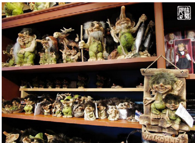
阿兹猫 山妖纪念品

山妖是挪威的吉祥物，它们的身影几乎遍布挪威的大街小巷。山妖蓬头散发，手指和脚趾都只有 8 个，貌似凶恶，却心地善良。从踏上挪威的那一刻起每天都会碰见它们，工艺品商店门口，火车站，城镇中心街道边处处都有它们的踪迹。