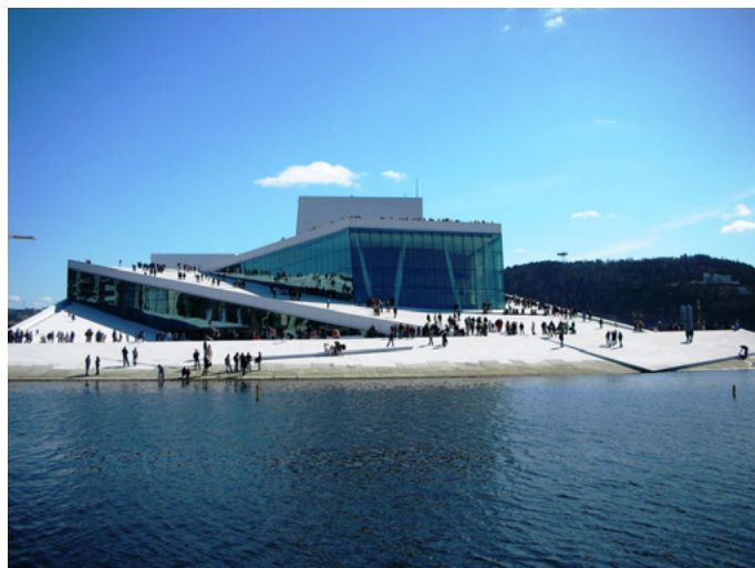
简单。续 奥斯陆歌剧院

地址: Kirsten Flagstads pl. 1, Oslo, 0150, Norway 电话: +47-21-422121 网址: http://operaen.no/en/ 门票: 参观免费, 导游讲解 100 挪威克朗, 学生 60 挪威克朗 到达方式: 火车站旁边即是, 可以乘坐几乎所有的公车、有轨电车、地铁在 Jernbanetorget 站下