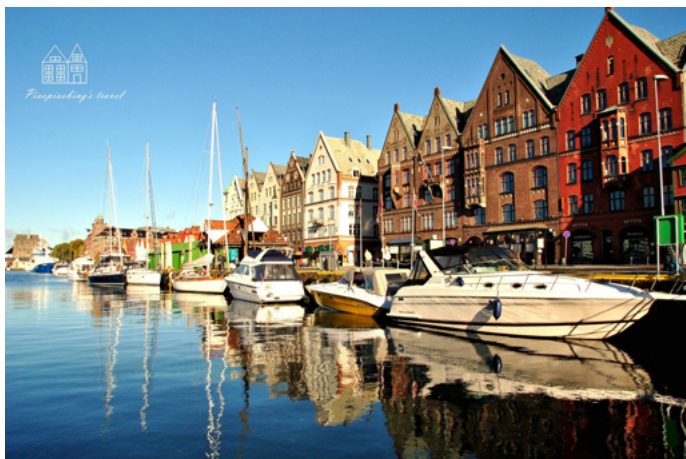
飘飘冰 布吕根港口

jqian 由于其优越的地理位置和其便利的贸易中转站地位，使布吕根成为当时众多商人抢夺的码头，商人们自建的木结构建筑此起彼伏。坐在码头海边吃着美味海鲜，欣赏港湾美景真是一种享受。