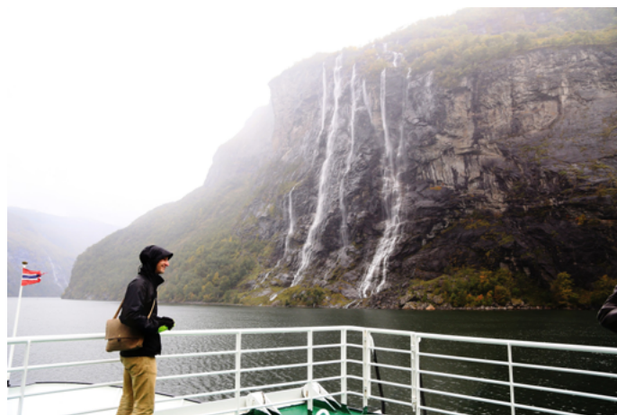
江龙 盖朗厄尔峡湾的七姐妹瀑布

Vestlandsbussen 公司每天都有好几班巴士从卑尔根发车途经奥普达尔 (Oppdal)、弗勒 (Førde)、奥尔登 (Olden) 和斯特林 (Stryn) 后抵达奥勒松 (Ålesund)，夏季巴士线路还会与行驶在海勒叙尔特 (Hellesylt) 和盖朗厄尔之间的轮渡相接驳。(信息来源于官网)