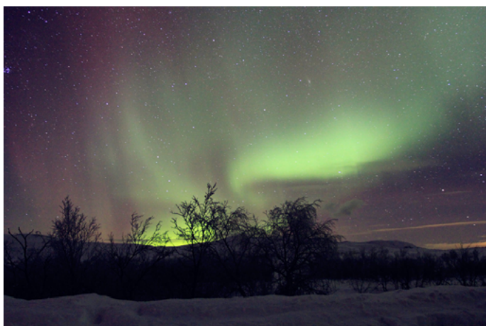
Dee Dee 美丽极光

极光的最佳观赏时刻是 11 月至次年 2 月的晚上 10 点到凌晨 2 点，位于欧洲大陆最北端的北角是挪威境内几处观赏极光的最佳地点之一。