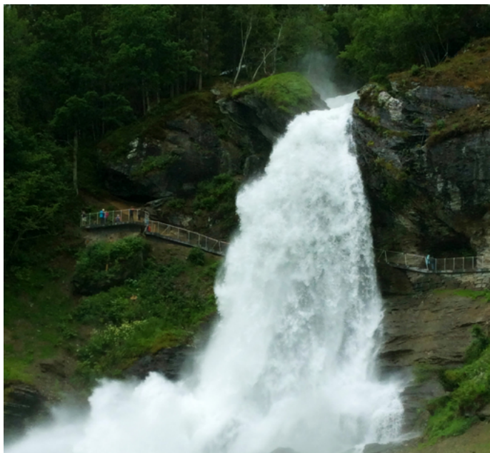
jiqian 斯塔因斯达尔思大瀑布