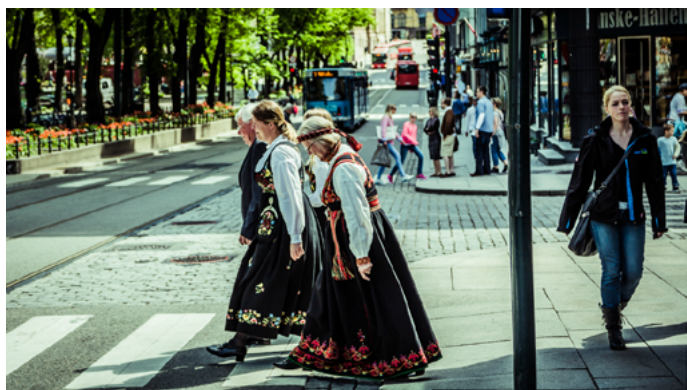
gqfree 穿民族服饰的行人

每年五月十七日是挪威的国庆节，也是这个国家最盛大的节日。国庆当天人们纷纷穿起传统服装，或是在正装上佩戴国旗色的饰带，连宠物也不例外；商家也会早早开始准备应景的商品，如小国旗、饰品、国庆蛋糕、红蓝白色的国庆花束等等。国庆当天最隆重的活动就是奥斯陆的儿童游行，卡尔·约翰大街两旁会挤满了挥舞国旗的人群，小朋友们按学校分队，以校旗为先导，在乐队的带领下走向王宫，王室家族的成员会站在阳台上向他们挥手致意。