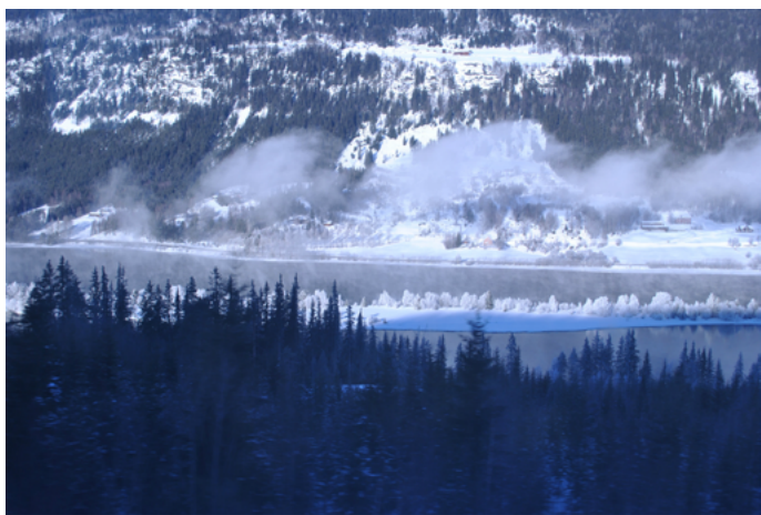
Sabrina 卑尔根与奥斯陆之间铁路经过的美景

挪威最著名的铁路是一条位于奥斯陆和卑尔根之间翻越高山的 470 公里铁路线，途中有 100 公里列车穿行在大风、严寒、荒凉、没有树木的高远之上，被认为是世界上最美、最震撼的铁路。如果想在整个北欧境内乘火车旅行，可以考虑购买欧铁北欧通票。