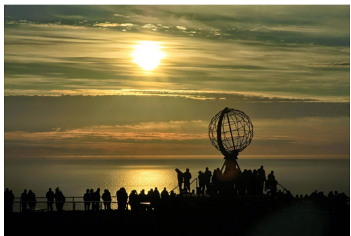
天马行空看世界 北角的午夜阳光

离北角最近的城镇是霍宁斯沃格 (Honningsvåg)，从 6 月中旬到 8 月中旬，每天都有公共汽车从霍宁斯沃格开往北角。而从挪威的第三大城市特罗姆瑟 (Tromsø) 取道阿尔塔 (Alta) 可以到达霍宁斯沃格；或者也可乘飞机直飞霍宁斯沃格。从一些大城市 (如奥斯陆、卑尔根、特罗姆瑟等) 乘游轮从海上航行至北角也是不错的游览方式。