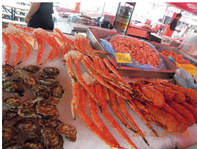
小波门下走狗 鱼市场

到达方式：公交 3、4、5、6、10、18、83 路到 Torget 站下车即可