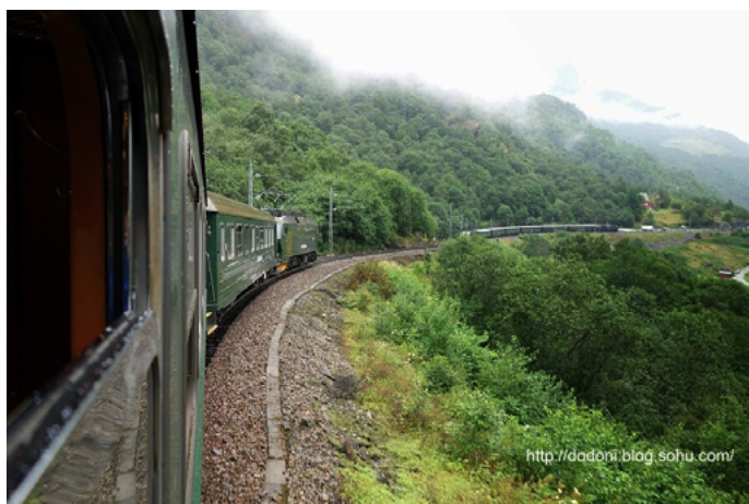
心在旅途 弗洛姆铁路

弗洛姆铁路是世界最著名的旅游登山铁路。这条始建于 1924 年的铁路支线将海拔 2 米的峡湾小镇弗洛姆和海拔 865 米高的米达尔山相连接，全长 20 公里。海拔相差 863 米高的弗洛姆铁路浓缩了松恩峡湾优美景色的精髓。如今，这里已经成为了挪威旅游的必选之处。