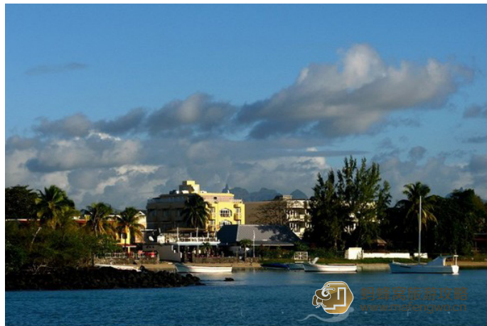
乱云飞渡 此时此刻，漫步在这里，无疑是漫步在风景线上

在大湾潜水需要将船开到海中适宜的位置，目测水深有 6 米左右，并伴有轻微洋流。因此，对游泳信心不强的游客最好穿救生衣浮潜，不要逞强。浮潜的时候不要太过于忘我，洋流会将你推离游船很远，要边游边观赏鱼群。下海前，一定要做热身运动，毛里求斯的海水并不像东南亚的那般温暖，准备不足的话容易抽筋。