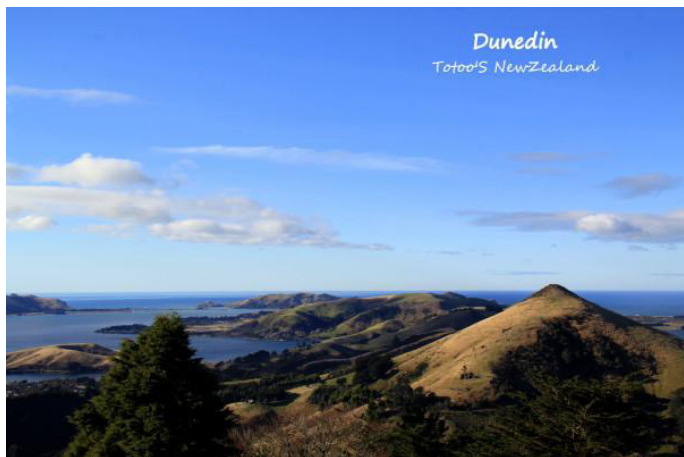
Dunedin Totop'S NewZealand