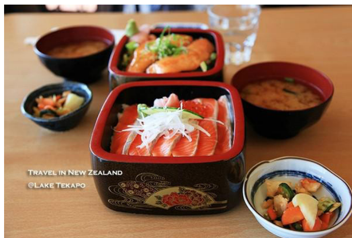
边缘儿 生鱼片好吃，分量很足

新西兰的三文鱼就地取材，非常新鲜，是当地市民桌上常见的菜式。这里的三文鱼多脂香嫩，最常见的做法就是经过简易的熏制，放入烤箱，配上几滴柠檬汁，三文鱼的鲜美即刻呈现在了大家的面前。除了烘烤和三文鱼刺身外，新鲜熏制的三文鱼可做成沙律，配上茼蒿、罗勒，以及少许辣椒和豆瓣菜。