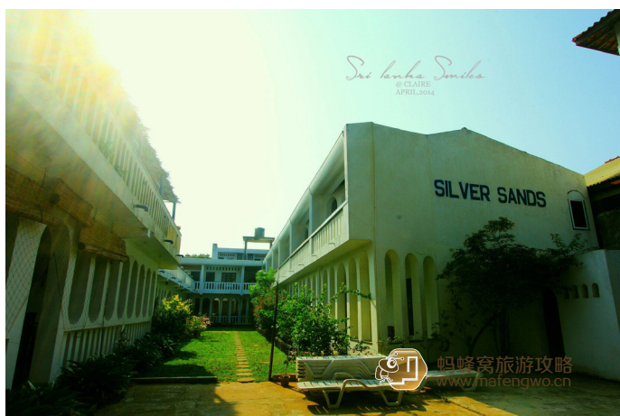
Hotel Silver Sands

这个酒店位于沙滩边，又便宜又好，房间整洁，还有蚊帐。酒店房型很多，不同房型，不同季节价格都不同。