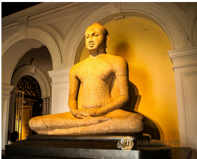
到处留情 国家博物馆

这家博物馆始建于 1877 年，这里收藏着斯里兰卡古代各种各样的艺术品、雕刻和雕像。一进门，就会看到一尊 9 世纪的是佛面带微笑的欢迎你。这里还有殖民时期留下来的宝剑、枪械等，以及一些英国人 19 世纪所绘的与斯里兰卡相关绘画的复制品和一些珍贵的远古魔鬼面具。这里还能看到曾经国王的华丽王冠。博物馆门前的广场被巨大的菩提树树荫遮盖，亦是避暑纳凉的好地方。