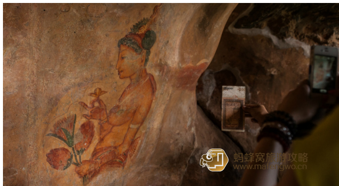
到处留情 2000 面值上的图案源于狮子岩上壁画

斯里兰卡现在市面流通的钞票有 8 种面额，分别为 2、5、10、20、50、100、500、1000、2000 卢比。但 2、5 卢比面额的小额纸币现已逐渐不用。此外，尚有 1、2、5、10、20、50 分和 1 卢比的铸币同时流通。最近，又新增加了 2、5、10 卢比的铸币。斯里兰卡的辅币进位是 1 卢比等于 100 分 (Cents)。