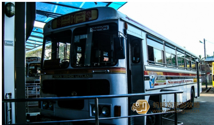
到处留情 长途汽车