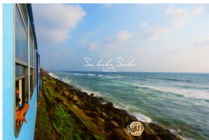
Clarie Le Lu 海上火车

从科伦坡到达加勒的火车线路就是著名的海上火车，铁轨距离大海不到 5 米。这条线路继续向南还可以到著名的海滨城市米瑞莎看鲸鱼，去坦加勒看海龟，还可以乘火车去中部的山区。加勒火车站位于古城外，但是距离古城很近，乘 tuktuk 很快就到。