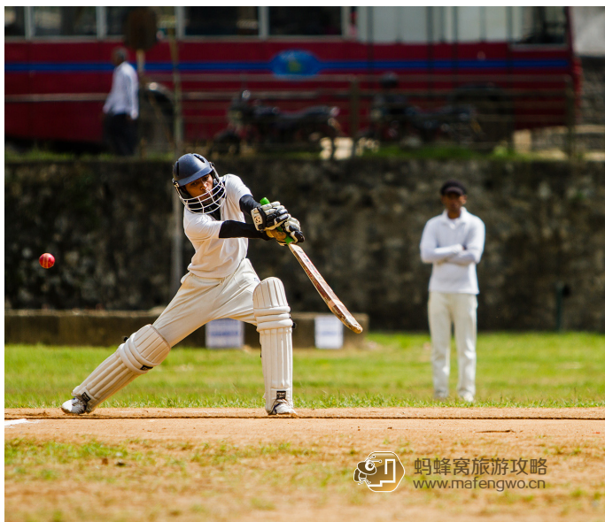
cd 淡墨 板球

板球是斯里兰卡的国球。在斯里兰卡，了解板球运动对这个国家民族精神的重要性是必要的。板球之于斯里兰卡恰如乒乓球之于中国，已经成为这个国家的一种象征，但这里的人们对板球的热爱已经近乎狂热。