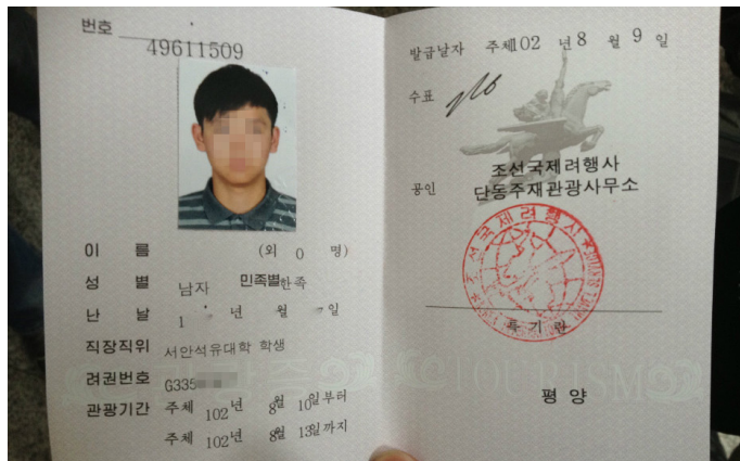
一个人转世界 乘火车入境的旅游卡

乘坐巴士到新义州或者罗先旅游的话，需要至少提前 5 天报名参团并提交相应材料。出发当天，在出境口岸导游会负责为游客办理过关手续，每位旅客自己的护照上不留有朝鲜签证。