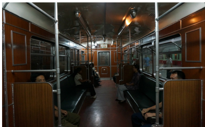
跃跃跃跃 平壤地铁内

平壤建造了世界上最深的地下轨道交通，最深处可达地下200米。除了交通运输外，地铁系统还有防空洞的功能，是特别为可能发生的战争所考虑设计的。平壤地铁主要有两条线，乘坐一次的票价5朝圆。很多旅行团都有带游客体验平壤地铁的行程，导游会负责买票。