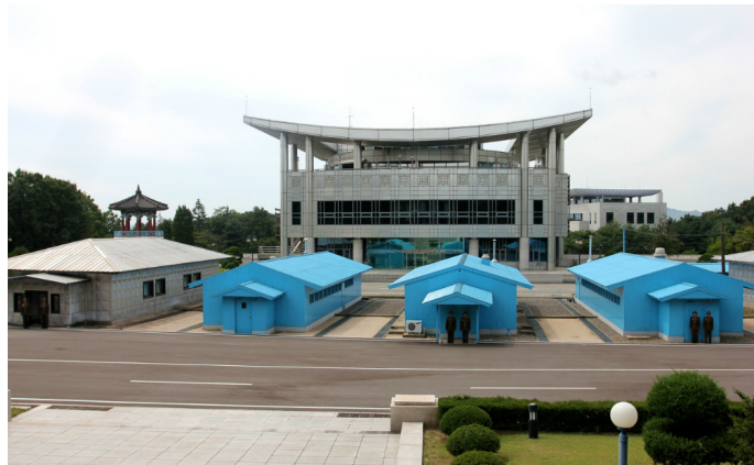
凌晨两点半 板门店停战会场

板门店位于开城市东南部。1953 年 7 月 27 日，《朝鲜停战协定》在此地签订，板门店由此为世界所知。这里既是三年惨烈的朝鲜战争的见证，也是朝鲜半岛民族分裂的象征。