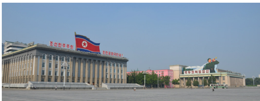
一个人转世界 金日成广场一侧

由于执行半封闭的政策，朝鲜在国际社会极具神秘色彩，外界对于朝鲜的真实面貌知之甚少，而这种神秘感一定程度上带动了朝鲜的旅游业。朝鲜半岛曾被誉为“三千里锦绣江山”，占了半壁江山的朝鲜自然是风光旖旎，拥有丰富的自然旅游资源。朝鲜主要的名山有金刚山、妙香山、七宝山、九月山等，金刚山雄伟壮丽，显阳刚之气；妙香山山势奇妙，呈阴柔之美。名江有中朝界河鸭绿江、另外还有大同江、清川江。而更加具有朝鲜鲜明特色的是这里的人文景观，烘托出了国家领导人高大伟岸的光辉形象。在朝鲜你还可以看到中国曾经的影子，平壤市中心的金日成广场和北京的天安门广场颇为相似。另外，现在仍然实行公有制计划经济的朝鲜，还需凭“票”购买，与中国改革开放前也是一样的。很多中老年中国人会来到朝鲜追忆过往，年轻人则被朝鲜的神秘感所吸引，想要来到这里亲身感受。