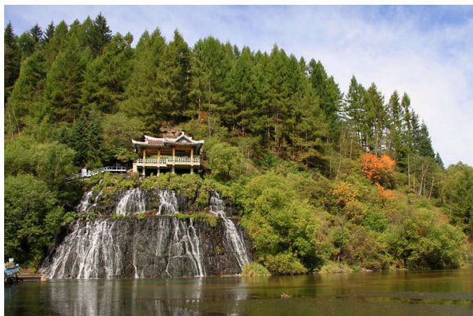
浮生若梦 妙香山美景

“三千里锦绣江山皆名胜，未见妙香山莫谈景”。妙香山位于朝鲜西北部的平安南道、平安北道、慈江道的交界处，其第一高峰为 1909 米的毗卢峰。妙香山与金刚山齐名，山势奇妙，景致绝佳，尤其以上元洞、万瀑洞、毗卢峰的景色为最佳，是登山的好去处。这里动植物种类丰富，文物荟萃，有公元 11 世纪修建的普贤寺、石塔等古迹和显示印刷技术发展水平的文物古迹。妙香山的历史博物馆以历史悠久的普贤寺为中心构成，现保存着 5400 多件遗迹和遗物，还保存着高丽时期木板雕刻的 6793 卷大藏经。