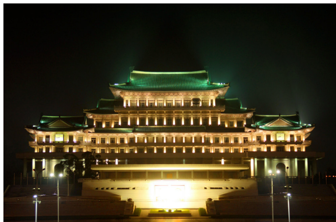
文城 灯火辉煌的人民大学习堂

人民大学习堂坐落在平壤市中心的金日成广场一侧，它的前身为平壤市立图书馆，后更名为国立中央图书馆，开始履行国家图书馆的职能。1982年4月1日最终落成的现在所见的馆舍，由金日成命名为人民大学习堂，成为朝鲜国家图书馆。造型雄伟典雅，是由10座楼组成的10层建筑。大厅里明净的墙壁，圆形的立柱，花纹大理石的装饰，玉石铺成的花纹地板，十分和谐地融合在一起，充分显示了民族建筑形式的艺术美。由34个屋顶组成的朝鲜式青瓦屋顶，显得雄伟清雅，又如展翅腾空的群雁。