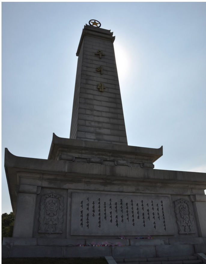
拉尔夫君就是我 为中国志愿军烈士而建的友谊塔

修建于1959年10月的“友谊塔”塔高30米，由1025块花岗岩和大理石砌成，象征着10月25日志愿军赴朝参战纪念日，是为纪念中国人民志愿军烈士而修建的。“友谊塔”内有一个圆形石室，可进入塔身，石室中央放置一块重1吨重的大理石基座，里面保存着10本志愿军烈士的名册原本。