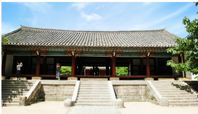
凌晨两点半 高丽博物馆

高丽博物馆最初为 11 世纪初叶高丽国的行宫——大明宫，当时曾作为外国来宾的住宿地，称作“顺天馆”。后来又改作宣传儒教的“僧务馆”。1089 年，最高教育机关国子监迁到这里，改称“成均馆”。这座古老的建筑现在成为展出朝鲜历史文物的“高丽博物馆”。