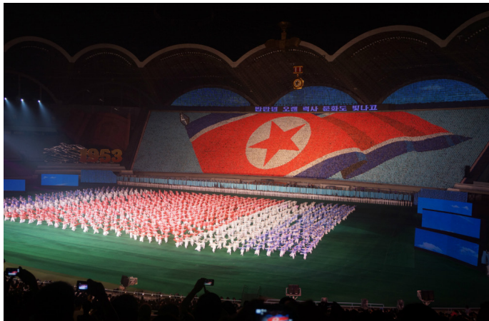
一个人转世界 阿里郎团体操表演

阿里郎是参演人数打破吉尼斯世界纪录的团体操表演，共有 10 万人参演，很多都是孩子。演出场地在朝鲜平壤的五一体育场，后方逼真的背景“屏幕”是由 2 万人手拿彩色纸板组成的。表演的内容主要是歌颂伟大领袖和宣扬国际友谊，客观来讲表演还是很精彩的，演员们都很训练有素，整齐划一，极具朝鲜特色。