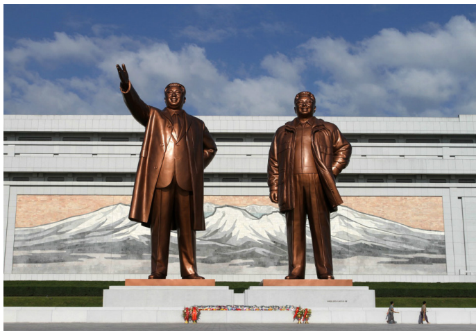
拆飞机的原子 金日成铜像

在平壤的参观，一般会从前往市中心的万寿台金日成铜像献花开始。作为朝鲜民主主义人民共和国的创始者，已故金日成主席在朝鲜人民中享有无与伦比的崇高威望。铜像建于1972年4月金日成60岁寿辰时，背后是一幅以白头山（长白山）为主题的大型壁画，两侧各建有一座长50米、高22.5米的纪念塔，反映抗日革命斗争和社会主义建设时期朝鲜人民的斗争面貌。站在万寿台上，居高临下，可以远望悠悠流淌的大同江，以及江对岸的建党纪念塔和错落有致的建筑群。