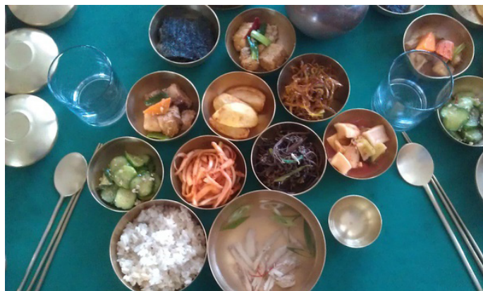
拉尔夫君就是我 铜碗饭