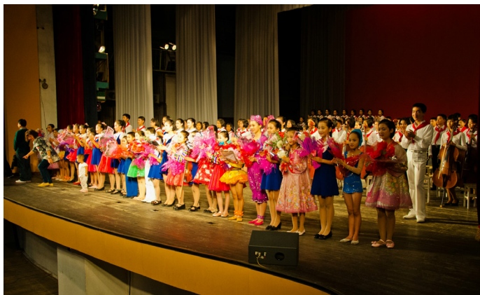
傲骨雄心 少年宫文艺表演

建于 1989 年的万景台学生少年宫是朝鲜最大最气派的少年宫，据说整个少年宫耗资 2 亿美元，是展示朝鲜青少年教育成果的大型橱窗，江泽民访朝时也曾经参观过这里。来到平壤旅游时基本都会有到少年宫观看朝鲜儿童文艺表演的行程，表演内容主要是歌舞、朗诵的形式。这个项目基本包含在行程内，不需要另外收费。