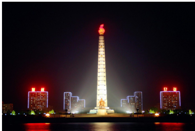
이안기 夜晚的主体思想塔

主体思想塔位于平壤市中心大同江畔，塔高170米，塔身分70节，由25550块花岗岩砌成，象征着金日成主席70寿辰和70年天数的总和。主体思想塔于1982年4月15日金日成诞辰70周年之际建成，以纪念金日成创建“主体思想”，主题思想是指导朝鲜劳动党的思想，相当于中国的邓小平理论，毛泽东思想，强调以人为本。塔身底部背面镶嵌着600多块珍贵石料，由90多个国家的国际友人和外国主体思想研究组织赠送。