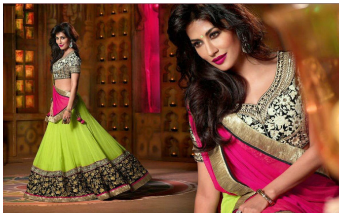
印度传统女装“楞哈”

楞哈 (Lengha)：最接近于”宝莱坞电影舞娘“的服装，由小上衣 (Choli)+ 裙子 + 围巾 (Dupatta) 组成。这是一种礼服，平日内人们不会穿着，只在婚礼、节日或正式场合穿，也极少有人穿上街。穿着时切忌模仿电影中那样裸露肚皮，不用围巾遮盖肚子会被人视为“半裸”。