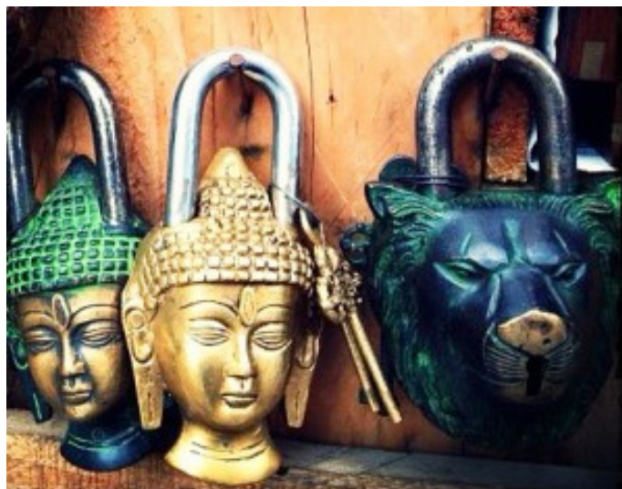
Chor Bazaar 神奇的古董货品

地址：Around Mutton Street, Kumbharwada, Mumbai 开放时间：白天 - 晚上