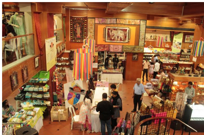
The Bombay Store