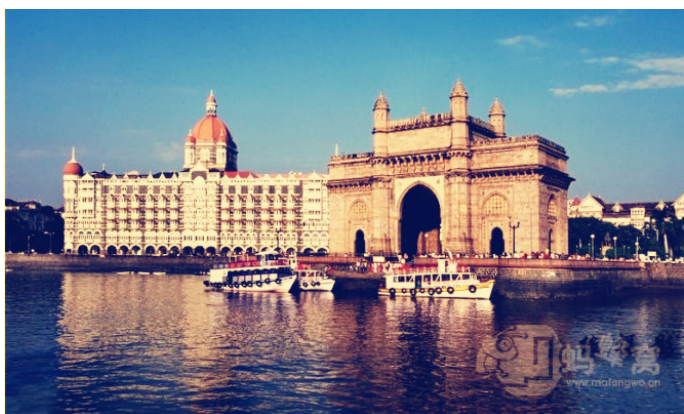
尘缘 (Y哥) 印度门和著名的泰姬陵酒店