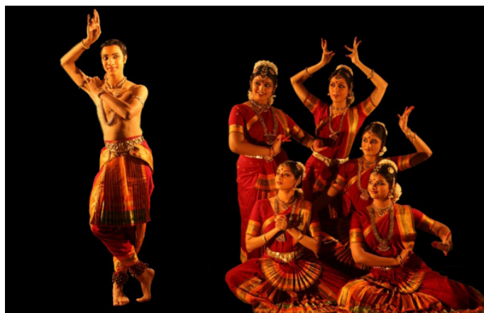
神秘的印度古典舞蹈