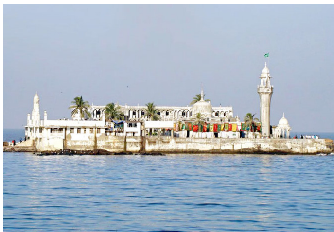
独看冷雨 海上清真寺

地址：Dargah Rd, Haji Ali, Mumbai, Maharashtra, India 开放时间：05:00-22:00，最好选择在退潮时分造访 费用：免费