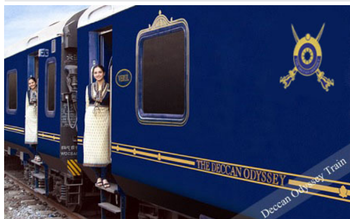
Deccan Odyssey 火车

http://www.maharashtratourism.gov.in/mtdc/HTML/DO/DefaultDO.aspx?strpage>About_deccanodyssey.html