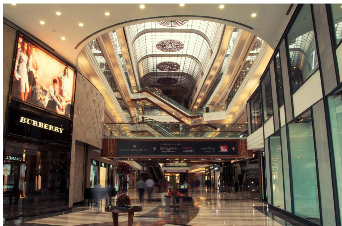
High Street Phoenix 内部