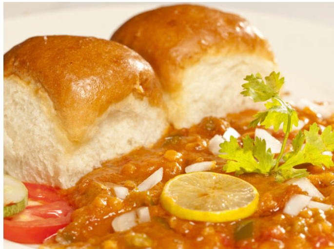
孟买当地特色菜香辣什锦配面包 (Pav Bhaji)