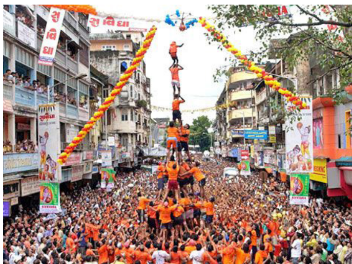
惊险刺激的 Dahi Handi 庆祝仪式