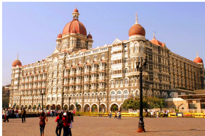
孟买泰姬陵宫酒店

孟买泰姬陵宫酒店座落在南孟买的海滨地区, 其宏伟的标志性建筑面对印度门。隶属印度知名酒店集团 Taj, 始建于 1903 年, 从开业伊始就跻身世界奢华酒店之列, 也是包括各国家元首造访孟买时下榻的酒店。整个酒店是特色殖民风格建筑, 印度和欧式风格于一体, 通过内饰更可领略印度贵族的奢华风情。酒店内更有印度顶级 SPA 及美容中心和全印度第一家酒吧 Harbour Bar, 可以在这里观赏印度门和海景。