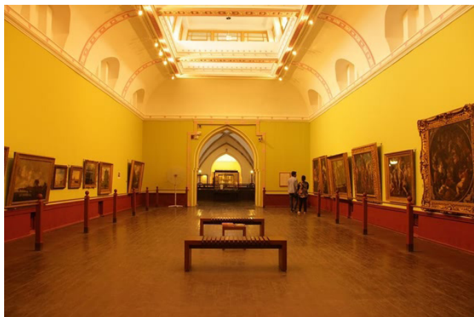
小布鱼鱼 威尔士亲王博物馆内景