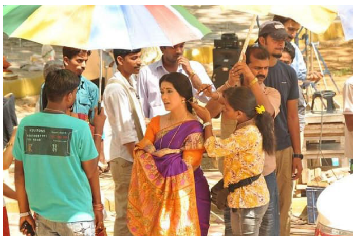
Imshzb 在宝莱坞影城巧遇正在拍戏的女演员

华丽的宝莱坞既是印度的招牌，更是孟买的代名词。来到位于孟买西郊 Goregaon 地区的孟买影城看看吧！孟买影城有 20 多个电影工作室和外景拍摄场，每年出产 1000 部以上的影片，更以群歌群舞的拍摄场景著称，说不定还可以见到宝莱坞明星！不过现在影城不对个人旅行者开放自由行，必须报名“宝莱坞观光团半日游或一日游”——花费 35 美元或 55 美元，导游负责酒店接送，参观内容包括宝莱坞明星的豪宅外景、舞蹈表演、电影工作室和电影的现场拍摄。可在网上预约。也可以到 Viator 网站上请私人导游。