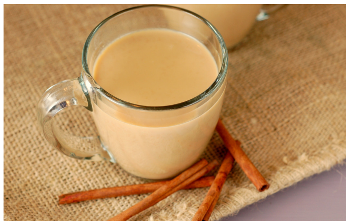
味道醇厚的印度奶茶

Chai/Masala Tea: 印式奶茶，当地人每天必饮！除了浓厚醇香的味道，还有提神醒脑的功效。印度人喜欢往里面加入姜末（Ginger），如果不喜欢姜味可以告知服务员不要加姜末。