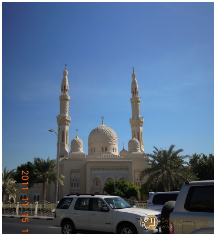
小波门下走狗 卓美亚清真寺

地址: Al Jumeira Road, Dubai, United Arab Emirates