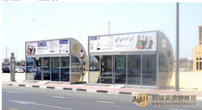
彪悍人生 迪拜的汽车站，都装有空调

这里路面宽，车速快，严禁超速，不可随意停车，如酒后驾驶，不但驾照被扣，还将被监禁1个月。驾车时系好安全带，严禁使用手机，否则将罚款400迪拉姆。