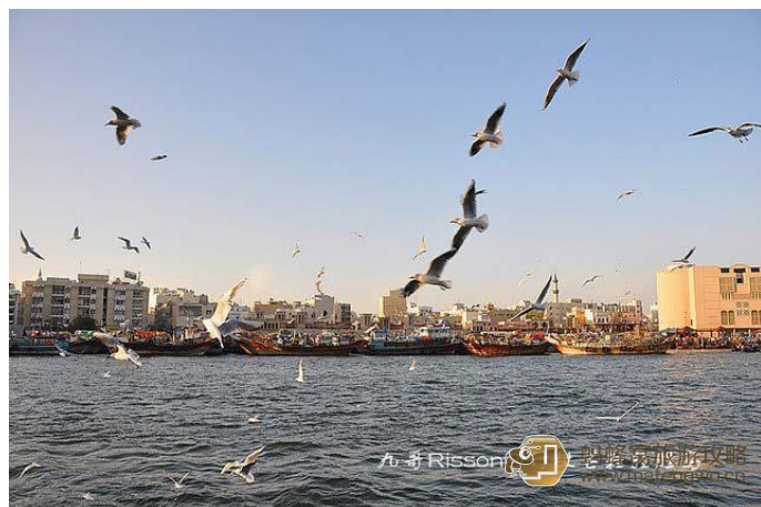
九哥 Risson 迪拜河孕育了迪拜的诞生

迪拜河把迪拜分成 Deira 和 Bur Dubai 两部分，一边是新兴的 Bur Dubai，一边是象征着迪拜历史的旧城区 Deira。