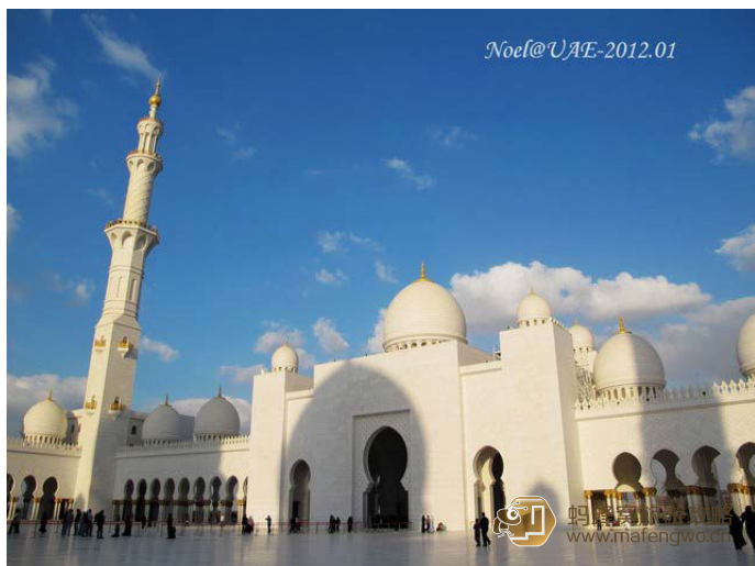
noel2000 谢赫扎耶德清真寺

需要注意的是，妇女参观这个清真寺需要穿着阿拉伯黑袍和头巾 (Abaya)，否则是不容许进入的。不过不用担心，没有黑袍的参观者可以在清真寺入口领取一件。