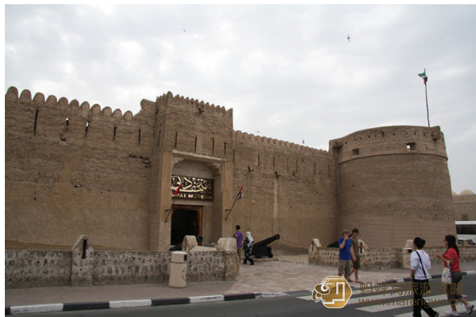
麦亨轩 迪拜博物馆

AndyZwen 该博物馆是有降温风塔的古商人大屋及阿拉伯城堡改建而成，是迪拜现存最古老的建筑物。走进博物馆，就像进入时光隧道一样，从博物馆的露天展览，可看到古阿拉伯人以前的住屋模式，包含最早期的风塔。室内展区部分位于古堡底层，是一个仿古市集，也是一个展现阿拉伯传统风貌的艺术馆，其中包括已有四 - 五千年历史的古墓铜器，值得慢慢欣赏。