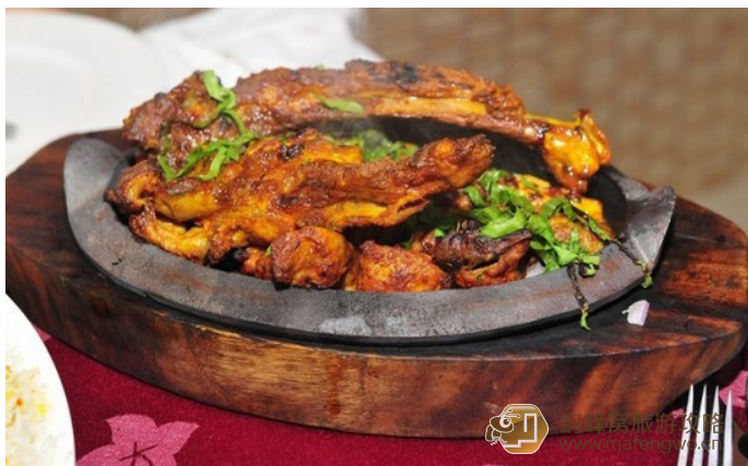
彪悍人生 综合烤肉