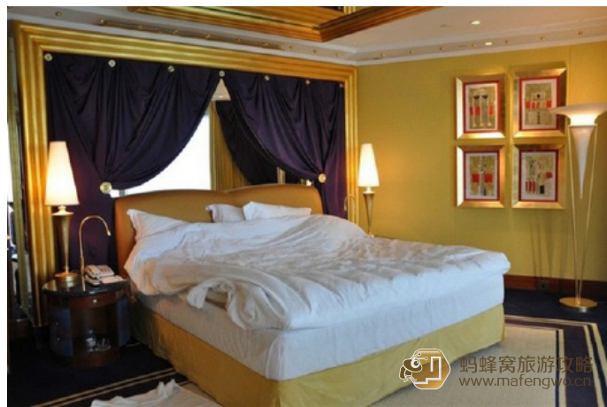
回忆牢 七星帆船酒店

这里很多宾馆都是外国人开的，三星级酒店每天在 50 ~ 80 美金。帆船酒店是世界上唯一的七星级酒店，超一流的享受同样也要付出超一流的价格，除了是一座酒店，更是来此旅游的人定要参观的景点。