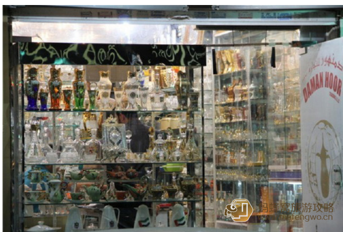
换一种心情去旅行 古龙香水店

“香水是属于阿拉伯的”。这并非只是一种故弄玄虚的香水传说，而是这一神秘之地微妙氛围的真实描绘。在阿拉伯人的居室中，世代奉行着亘续不断地焚烧熏香的习俗。檀香木香水还代表着主人对远道而来的宾客衷心的欢迎，尤其是女宾光临或出行之际，都会在香味燃放器前稍稍伫立，用罩在衣服外层的斗篷轻轻撩拨烟雾，让香气遍布全身。