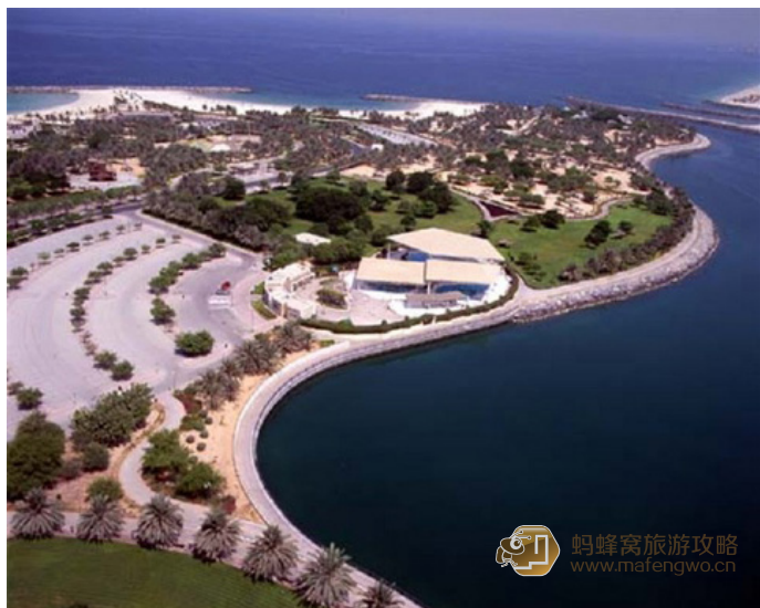
Al Mamzar 海滩公园

它在 Wafi 购物商场中，如果您喜欢与众不同的玩意，那么儿童及大人都会喜欢这里。水晶迷宫有一个恐怖屋及刺激的 3D 电影。还有一个仿真滚筒船，与实物没有两样。还有其它可供娱乐的节目，最好玩的是 Komet，可以在大楼顶部周围射击。