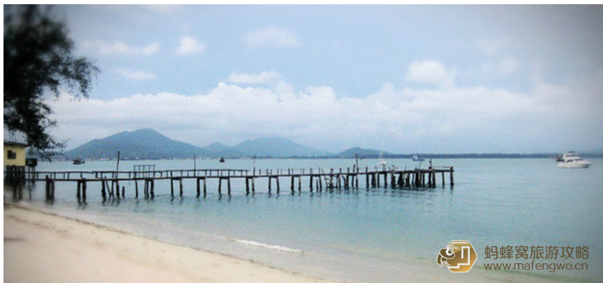
L 兴云 Yuer 登上顶前的海滩景色

wuhou_xiaoyue 很难找到宁静与喧闹同时存在, 同时极端的海岛, 沙美就是一个。沙美属于芭提雅的岛, 她带来了芭提雅的热闹, 也因为名不见经传, 带来了她独特的宁静和原始。因为我没有去过泰国的其他岛屿, 所以不能和其他成熟而漂亮的海滩比较, 跟塞班、普吉、苏梅等成熟的海岸线比较, 沙美岛就像一个进城的乡下姑娘, 穿着非常原始的花布衣裳, 误打误撞走进霓虹闪烁的大城市, 两种风格却相得益彰, 在一个岛上的多种元素并存, 也许就像这个国家一样, 充满了包容和和谐。