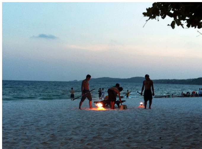
ling11 海滩上生火的人们

地址: 95/2 Moo 2 | Phe, Mueang, Rayong 21160, Thailand