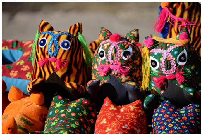
linkway 纪念品摊头上，布老虎探出头来，在等着有人收养