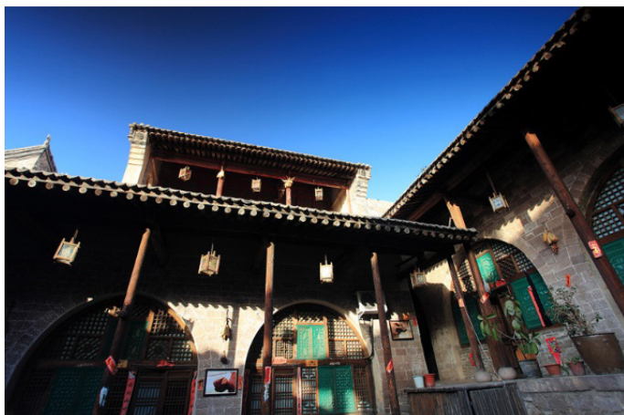
网际飞侠 碛口古镇一角

碛口的景点不多，主要以欣赏建筑为主：碛口古镇的街道、黑龙庙和李家山、西湾村的特色民居。当然，这里也有高原土柱林、黄河画廊这类神奇壮美的自然风光。