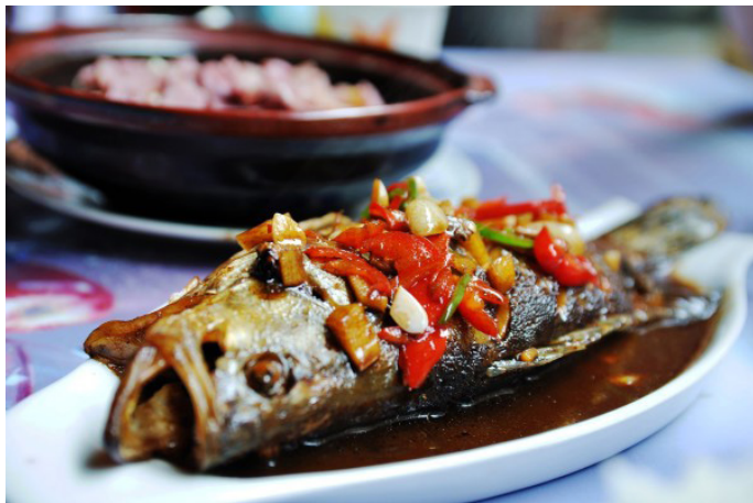
跋山涉水 臭鳊鱼，肉质鲜嫩

歙县是古徽州府衙的所在地，徽菜自然是从酒楼到居家的传统。这里可以有可以奉上庙堂的精妙滋味，也有寻常的乡土味道。附近田埂间的菜蔬，梁架上的几块腊肉，井里的几条鱼，就足以变成饕餮盛宴。无论是《舌尖上的中国》极力推荐的毛豆腐，还是千古流传的臭鳊鱼等徽派名菜，都可以满足你品尝徽菜的欲望。县城内各类消费的餐厅都可找的到，县城周边地区住宿和餐饮融为一体，均带有餐饮服务，可与店主一家共进正餐，品尝正宗的歙县家常菜，了解当地风土人情。