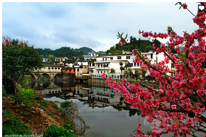
蝠翼清流 北岸廊桥

地址：安徽省黄山市歙县北岸镇杭徽公路，距歙县 19 公里 费用：免费 开放时间：吴氏宗祠平常偶尔会锁门，需到村委会与管理人商量请其开门 到达交通：乘歙县到北岸的班车，运行时间为 6:30-17:00，每 10 分钟一班，票价 4 元 用时参考：2 小时