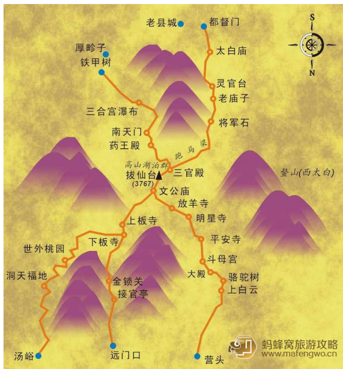
心情如海 太白山登山线路图

装备准备：背包、帐篷、防雨罩、地席、防潮垫、睡袋、登山鞋、备用袜子、雪套、冲锋衣裤、速干衣裤、洗漱包、急救包、炉头、防风板、气罐、套锅、餐具、洗洁精、塑料袋、备用电池、对讲机、头灯、备用手电、营地灯、保温壶、水桶、水袋、雨衣、手套、帽子、个人卫生纸、湿巾、温度计、登山杖、照相机。