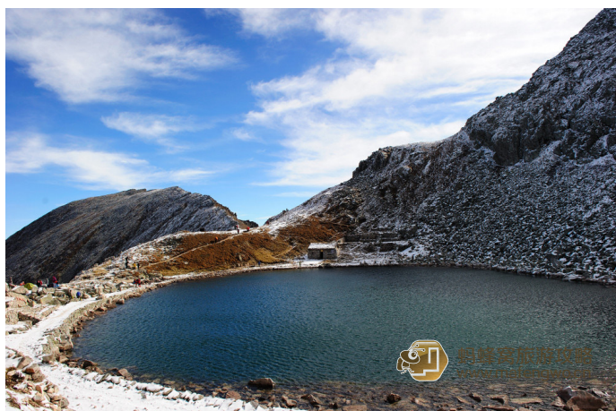
东哥 太白山标志大爷海，海拔 3600 米

一般认为，大爷海发育于六七万年前的第四纪冰川期，是一个冰川湖泊。由于从来没有人探测过大爷海湖底的地质构造，所以它的形成也是一个谜。专家们认为这很符合山岳冰川地貌的特征。来自西安科技大学的地质学教授郭力宇对潜水队员采集来的湖底石头样本进行了考察，他说：“石头外表非常光滑，稍有弯曲，表面上有一些小滑纹，这显然是冰川作用的结果”。郭教授初步确认，大爷海应该是在大约一万年形成的冰川冰斗湖。