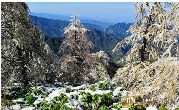
东哥 秦岭雪压杜鹃