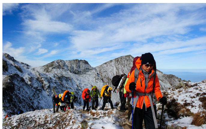
东哥 艰苦的徒步，美丽的风景