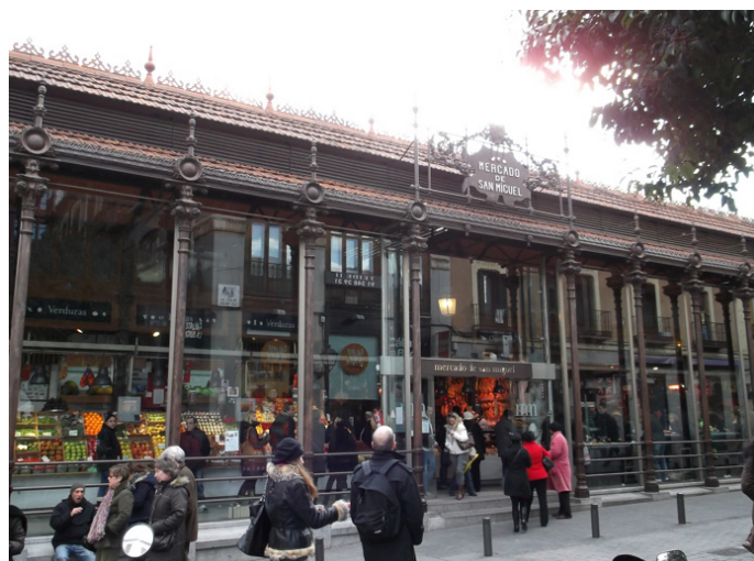
勇敢的马哈鱼 Mercado de San Miguel 圣米格尔市场