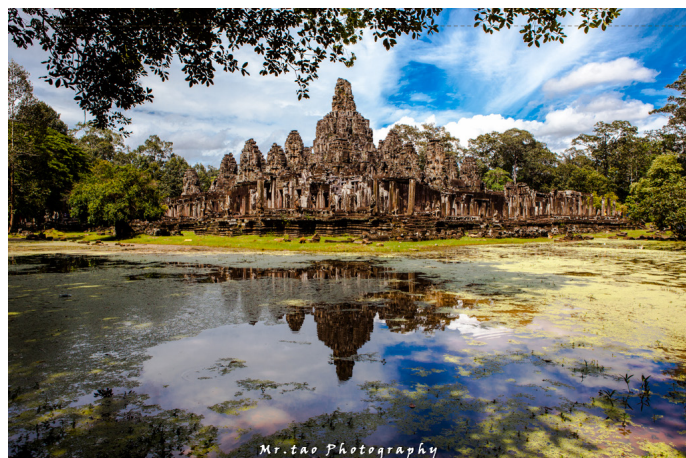
Name 暹 如果你喜欢人文古迹，想去吴哥看看，尽量早去

第一天的行程约定俗成地称为“小圈”，包括了几处最著名的遗迹，让你对吴哥窟的遗迹有了初步了解。凌晨早起，前往吴哥窟，欣赏最震撼人心的吴哥窟日出。随后来到通王城，参观最壮观的吴哥王城，其中重点推荐巴戎寺 (Bayon)、巴芳寺 (Baphuon)、空中宫殿 (Phimeanakas)、战象平台 (Terrace of the Elephants) 和癞王平台 (Terrace of the Leper King) 等。著名的高棉的微笑就位于巴戎寺的顶层，共 54 座宝塔，每座宝塔四个面，没面都有不同的表情，一共 216 个不同的高棉微笑。下午，从通王城胜利门 (东门)，按照次序参观对称排列的托玛依神庙和周萨神庙，茶胶寺。接下来，前往《古墓丽影》拍摄地塔布隆寺，在现实中感受电影画面。最后，赶在日落之前，登上巴肯山的巴肯寺，欣赏壮丽的吴哥日落。