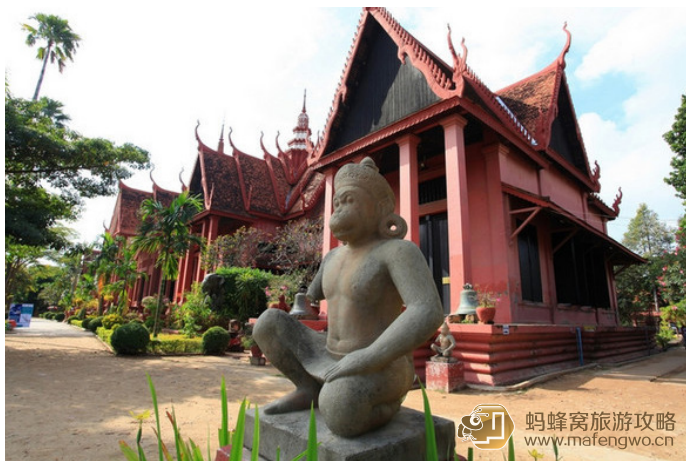
poorolddog 国家博物馆，从皇宫出来走几步就可以看到它。门票 3 刀。