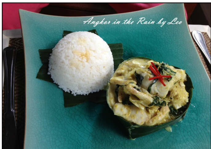
但顾无言 鱼肉阿莫克

阿莫克是最受欢迎的传统高棉美食之一，几乎在各个高棉菜餐馆都可以吃到。做法就是将肉类，或者其他材料裹在香蕉叶中烘烤，再加入椰汁、椰浆、柠檬叶及当地蔬菜和各种香料，然后加入主料烹制，最后盛在椰子壳或者瓷碗中，很有当地特色。一般有鱼肉，鸡肉，牛肉等几种不同种类的选择。