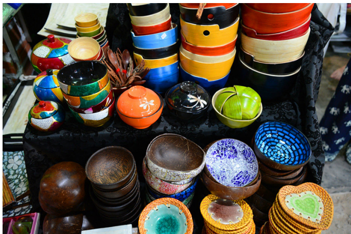
JOJO 带你游世界 手工艺品