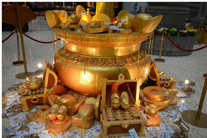
风在吹 金界娱乐城里面有金边唯一合法赌场的五星级酒店

是金边最大的豪华娱乐赌城，也是柬埔寨唯一合法的赌场。小桥流水间，赌桌分布，赌场外还是其总理命名的“洪森公园”。据说由马来西亚富豪曾立强持有，其在金边经营赌场的牌照期限长达 70 年 (至 2065 年止)，而在 1995 年至 2035 年的 40 年内，其经营权更属专利，除金界的赌场外，金边方圆 200 公里以内均不能设赌场。在柬埔寨，这个赌场的地位可以算是首屈一指。赌城内设有 21 点、百家乐、轮盘、吃角子老虎机等。