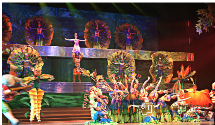
西部情结 超级歌舞秀

《勐巴拉娜西》是一台以版纳民族风情为题材的大型歌舞晚会，全剧共分为：《版纳神韵》、《孔雀吉祥》、《泼水欢歌》、《圣洁祝福》、《一江春水》五场。孔雀在后花园起舞，大象在街上穿行，异国奇景，神秘黑、孔雀绿、民族红、世界蓝在这里融成了一场声色的盛宴。歌舞俘获耳朵，舞蹈释放身体，节奏引导灵魂，万种风情，全在超级歌舞秀·《勐巴拉娜西》。