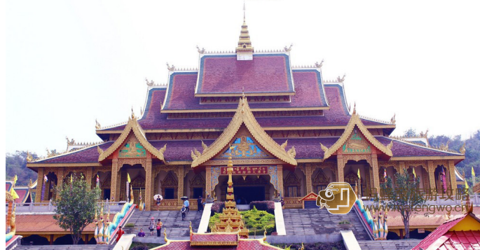
大佛寺 Da Fo Si