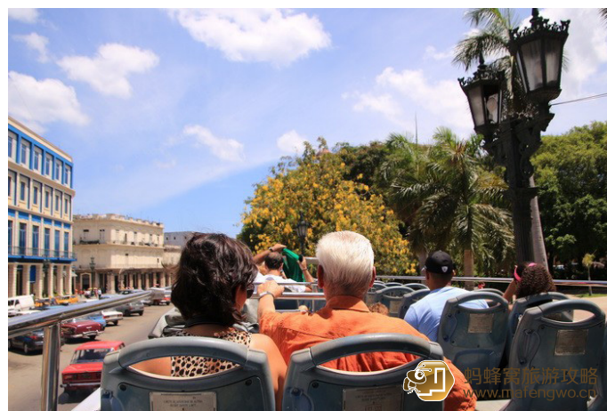
爱旅游的逸爷 双层观光车

详情请见网址: http://www.particuba.net/villes/la_habana/images/_habbustour/