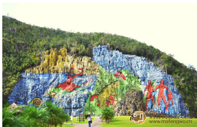
对焦浮光掠影 彩色壁画

这是比尼亚莱斯的主街，连通中心广场，附近有比较有名的景点文化中心 (Casa de la Cultura)，文化中心是山谷中最古老的殖民建筑，中心几乎每天都会举行小型活动，如演唱会、亲子活动等。每周六的中心广场 (Central Plaza) 都有当地的农夫市场，热爱人文旅行的人不要错过。