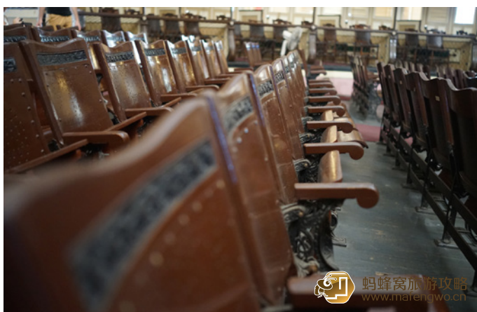
狐狸婆 西恩富戈斯天主大教堂内部