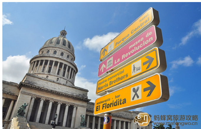
EDWIN 哈瓦那的国会大厦

古巴，一个登上若干“一辈子一定要去的X个地方”排行榜的国家。正等待着你的探索与发掘。