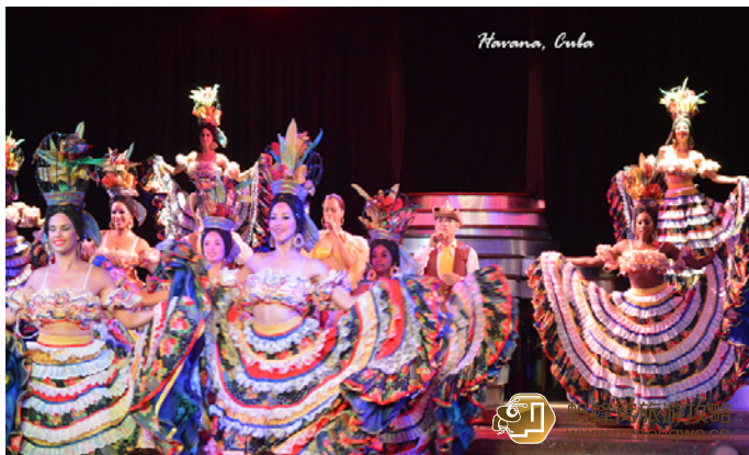
储钱罐 de 熊熊 国家酒店的歌舞表演

古巴的歌舞表演远近闻名，一般需要通过所在酒店代理，提前订票前往。像哈瓦那、古巴圣地亚哥、卡马圭等这样的历史名城，都是观看演出与戏剧的好地方。