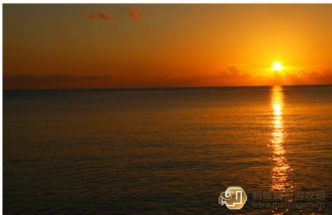
静心山水 古巴最东的美丽日落

巴拉科阿 (Baracoa) 位于古巴的最东部, 这里也是古巴最具个性的旅游目的地。它偏僻又古老, 据考, 在公元前 5 世纪这里就有了人类居住和活动的痕迹, 至今境内已有 50 多个考古点; 它有点格格不入, 曾经这里是流放之地, 直到成为后来殖民者走私的通道与重要中转站。它地形特殊, 由于巴拉科阿地形所限, 这里长期不通内陆, 海港成为与外界联系的唯一门户。1964 年修建了拉法拉 (La Farola) 公路, 让巴拉科阿揭开了它神秘的面纱。