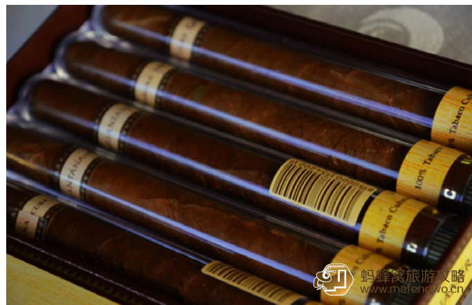
对焦浮光掠影 古巴雪茄

雪茄的收藏时间越长，风味越佳，刚制成的古巴雪茄、烟味会比较烈，随着时间流逝，风味就会变得更加香醇。一般的雪茄通常需要经历 5-7 年的发酵过程才能完成，即使烟味会随着岁月而转淡，但那得是 15 年后的事了。目前，在世界各地出售的古巴雪茄，大部份都是出厂约 2 年左右的产品。