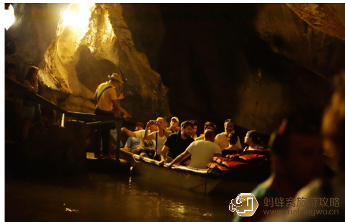
狐狸婆 像北京云水洞一样的石钟乳洞，规模不如杭州的瑶琳，但人工改动的少，还是很有自然趣味的，值得一去；这是从洞中乘船出洞！

除了自驾，从哈瓦那、特立尼达和西恩富戈斯到比尼亚莱斯也非常方便，有一天 2 次的长途巴士到比那尔德里奥省。山谷地区也有迷你中巴车 (绿色)，与司机商量还可以包车，价格合理 (一般是 5CUC)。