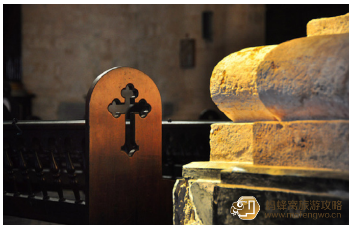
EDWIN 哈瓦那大教堂内部