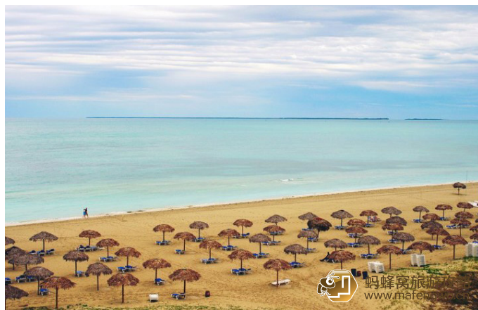
兰岚 Iris 巴拉德罗海滩

巴拉德罗有长达 20 公里的洁白沙滩，也是古巴开发得最完善的度假胜地，这里有古巴唯一一个高级高尔夫球场。