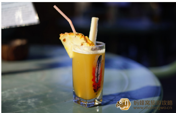
狐狸婆 甘蔗汁，超甜