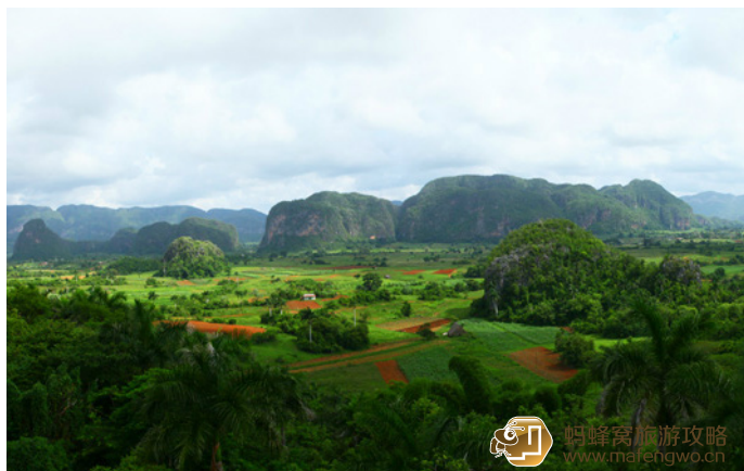
静心山水 比尼亚莱斯山谷风光