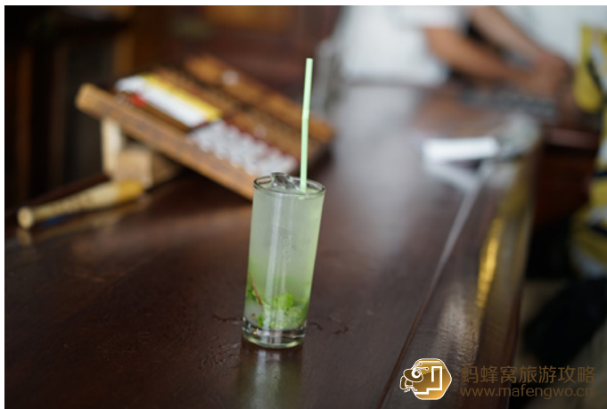
狐狸婆 五分钱酒馆里的莫吉托