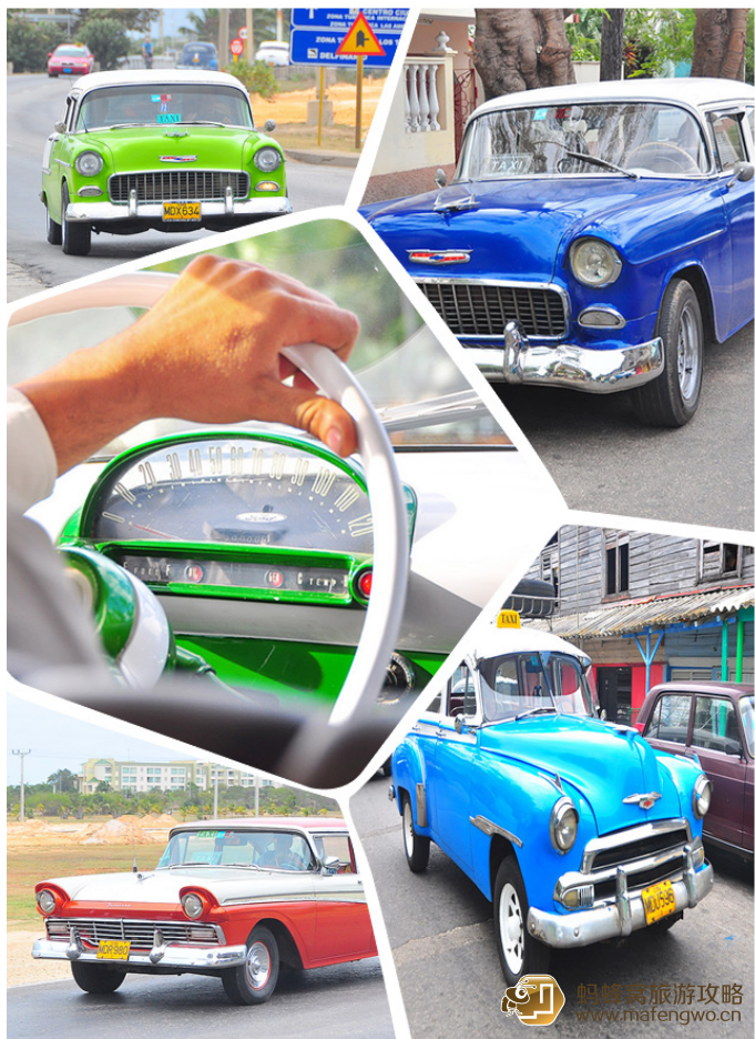
古巴的又一经典符号——老爷车