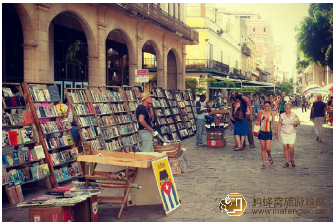
Eskimo 哈瓦那老城区的二手书，位于武器广场