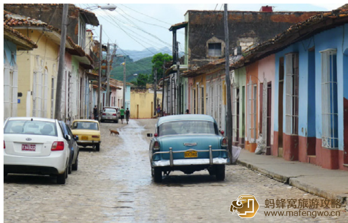
rivercaty 特立尼达安静的街景

特立尼达旅游资源网站: http://www.mycubavisit.com/cities/Trinidad.html