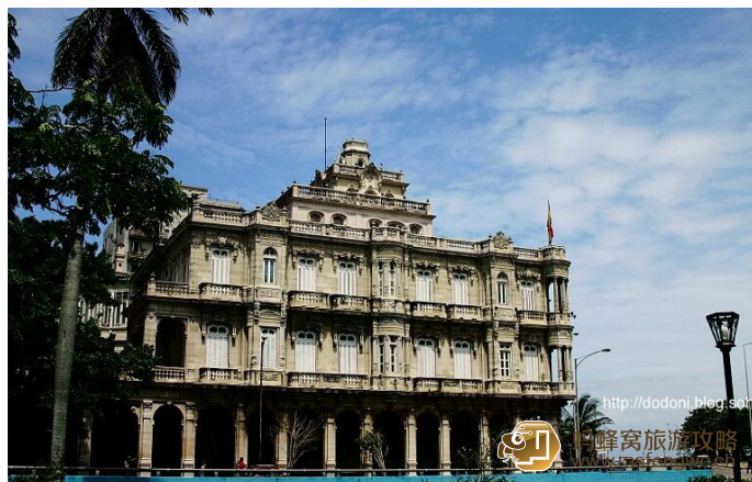
心在旅途 武器广场