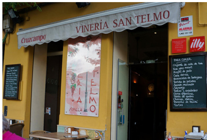
薇安 Vineria San Telmo

薇安 小小的门面，但若去得稍晚就是座无虚席，石版画风格的菜谱，甚是雅致。这家餐馆的菜式口味丰厚，肥厚细腻的鸭肝配香脆花生粒、浇着番茄奶油汁的菜肉卷、三文鱼粒配浓香的汤汁，小牛排配什锦米饭……吃到两个人撑得动不了。