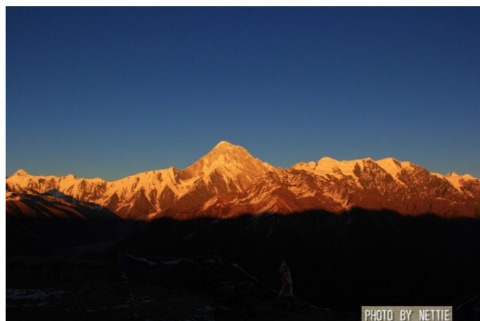
人在江湖 日照雪山

到达交通：从新都桥往九龙方向沿着 S211 走，到达甲根坝乡，往左转入土路直走，过了雅哈山口就可以眺望贡嘎七姊妹，然后继续往前经过玉龙西，到达上木居村，左转即可到子梅垭口