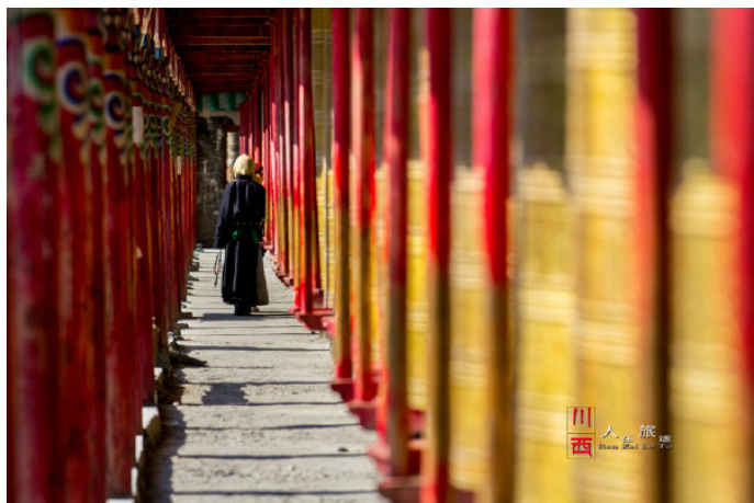
莲花映像 早上的塔公寺，转经的人特多，我们远远地拍摄，尽量不打扰他们

李小白 第一次参观如此神圣的寺庙，去朝圣的人们都要脱掉鞋子以表对佛祖的尊敬。在寺庙的四周是转经筒。另外藏族人很忌讳顺时针，所以转寺庙的时候一定要逆时针。