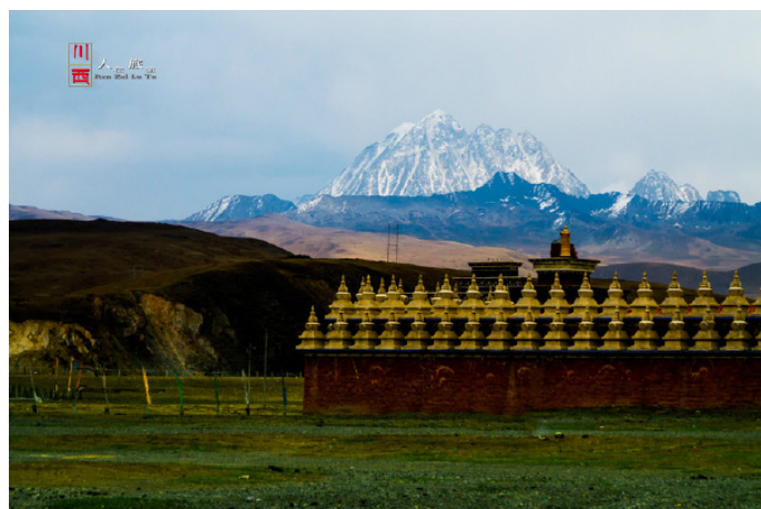
莲花映像 终于找到了真正的雅拉雪山，宏伟，壮观！

雅拉雪山目前依然是处女峰，未有攀登者成功登顶。因此眺望它是最寻常的方式之一，但观赏的方位与角度不同，山形也就各不相同：从八美方向看是皇冠状；从新都桥方向看则呈莲花形；在塔公看雪山与金塔争辉；在台站沟口看则松海与冰川相印。