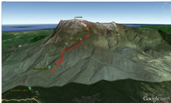
星岛小哈 登山线路图

在神山公园总部的气候清凉和干燥，平均温度介于摄氏 15 度 -24 度间，山上的均温则介于摄氏 6 度 -10 度之间。登山客以穿着透风的棉质装束，以及舒适的登山鞋登山为宜。此外，登山者最好带备手电筒、雨衣和夹克或披风，以备下雨时气温下降之需。