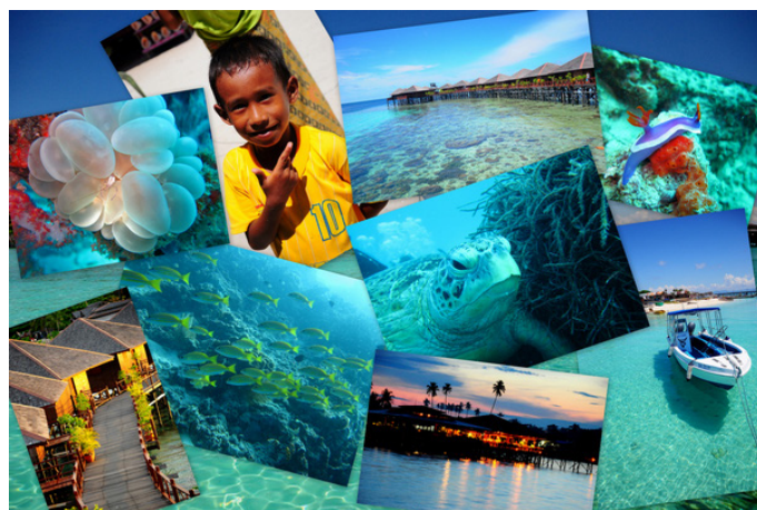
Joy Tripper 聚居村落