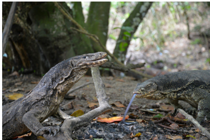
FrancesQ 沙比岛上的科莫多龙

山与游客共进午餐。你不必害怕，这些家伙很温顺，不会袭击人，它们也只是想下来讨一口吃的而已。