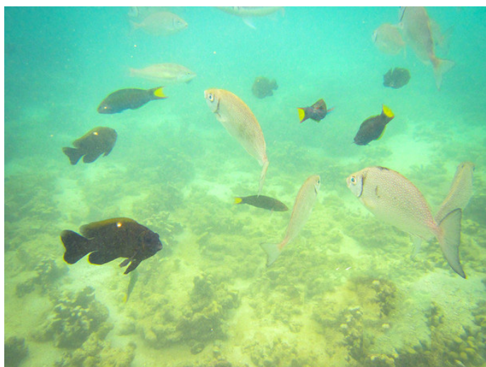
两个人去旅行 马奴干岛

此景点信息由 星岛小哈 提供，更多详情请参见游记： www.mafengwo.cn/j/1325833.html