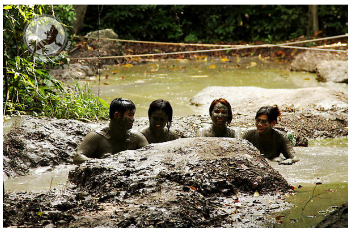
大雨的夜里 火山泥浆浴

交通：迪加岛位于亚庇西南方，约 35 海里处的一个岛屿，从瓜拉班尤 (Kuala Penyu) 乘坐快艇约 15 分钟船程即可抵达。