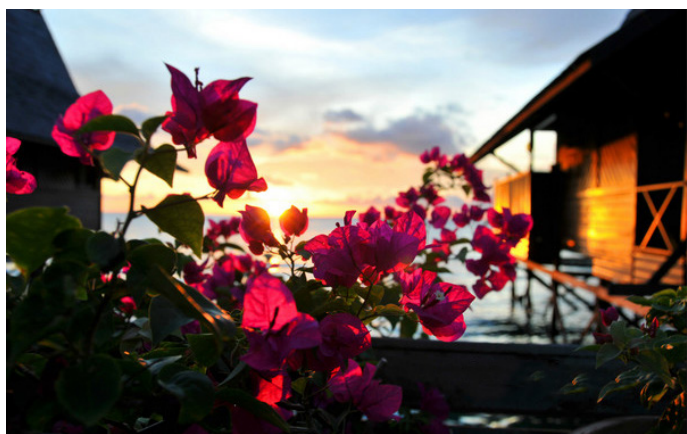
提拉馋猫鬼 偶然间在网上得知了这个潜水圣地