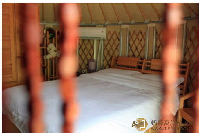
上上头 高家庄园里蒙古包里卧室的样子