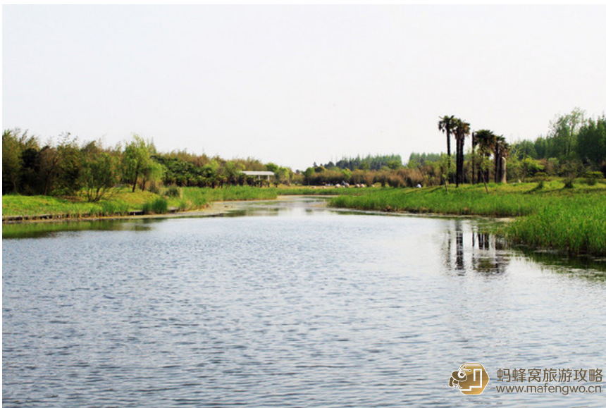
卜卜头 东平国家森林公园湿地