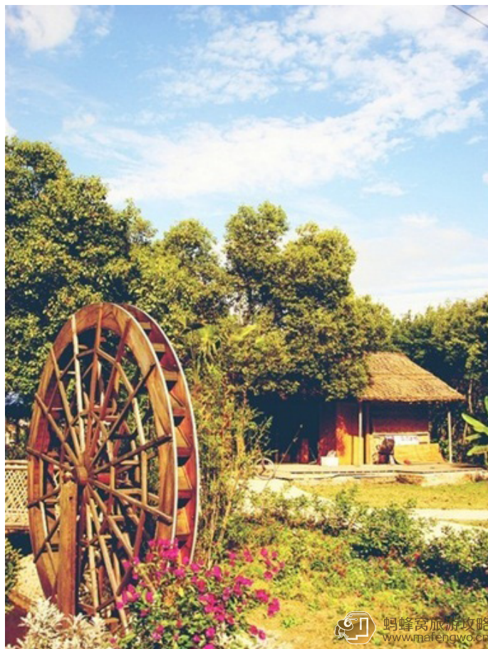
阿帅阿大 紫海鹭缘薰衣草浪漫庄园