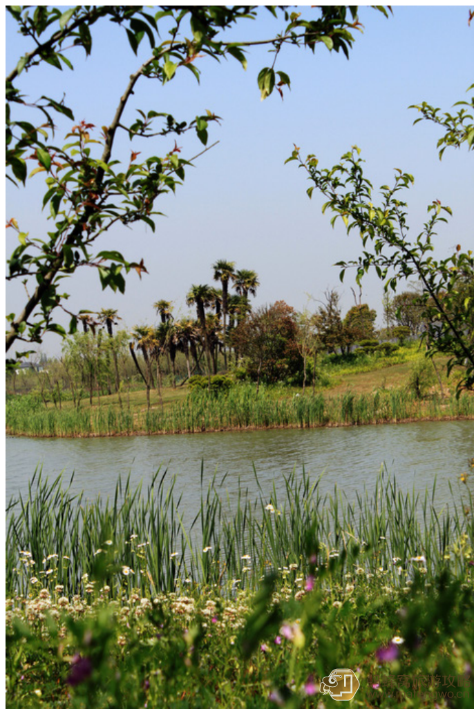
卜卜头 高家庄园里

高家庄园既可以住宿, 还有多项农家乐的体验活动和游玩项目, 垂钓、采摘园、渔人码头、孔雀观赏园、网球场、鸟文化展示馆、民俗风情园、精雕木刻式仿古烧烤城一个不少。重要的是, 风景确实不错。