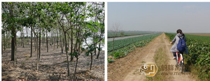
gwen 北湖, 真的好美啊