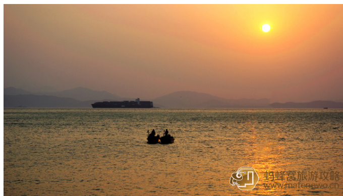
大漠孤烟 醉在夕阳里，情归山海间

大鹿港沙白胜雪，海水湛蓝，是西冲西面一个人迹罕至的海湾。大鹿港正面是香港海域，背靠红花岭，两侧是鹅公湾和黑岩角，大自然的鬼斧神工把大鹿港打造成三面环山，一面临海的月牙状，海湾有一大一小两个美丽的海滩，一条常年不断的溪流从红花岭淙淙而下直抵大海，可以饮用冲凉，可以说大鹿港是深圳露营最理想的海滩。