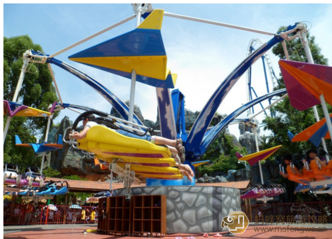
雪飘人间 Andy 深圳欢乐谷

依汾 首先要在开门的时候就进去，进去后向右拐，直奔太空梭，如果走的快，可以搭上第一班，不用排队。下来后直接杀向香格里拉森林的雪山飞龙，这时候应该还没开门（它比太空梭晚半个小时开），在外面稍等，开门直接进去，又是第一班，不用排队。然后继续往飓风湾走，可以坐激流勇进和完美风暴，因为这里人少，多数人都还在冒险山、金矿镇那边。玩完后可以随便逛逛，在欢乐时光区的 4D 影院门口休息，12 点半开始第一场刚好进去看。