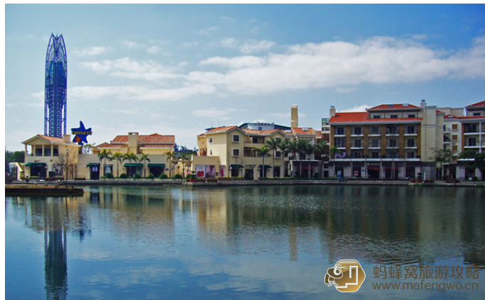
TripEnjoy 走近奥特莱斯购物村湖畔边可以欣赏到夕阳中的愿望塔。

到达交通：市内乘坐14、62、63、214、302、377、m383、n10路公交至中心广场站下车