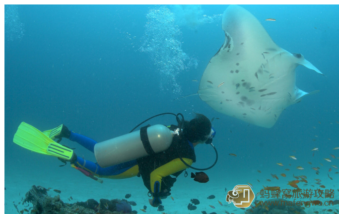
擦声而过 小梅沙海洋世界

地址：深圳市盐田区 费用：门票30元，海洋世界120元 开放时间：全天 用时参考：1-2天