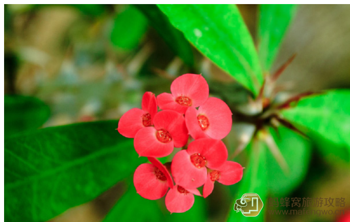
云山 仙湖植物园里的花草

jiaq 进门后如果不想走路，有大巴到弘法寺，票价3元。园内还有电瓶车，每人10元，可在多点上下车参观。