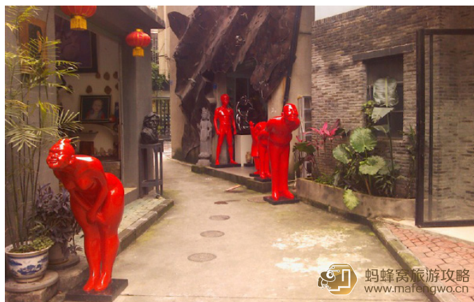
青蛙同学 大芬油画村