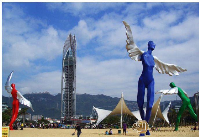
TripEnjoy 大梅沙海滨公园里的愿望天使

大梅沙海滨公园共分游泳区、运动区、休闲区、娱乐区、烧烤场等区。有摩托艇、沙滩车、蹦极、TAGADISCO、水上降落伞、沙滩排球、沙滩足球等众多的游乐项目，并提供购物中心、冲凉寄存、餐饮供应、休闲品茗、泳具出租、保安、救生等配套服务。太阳广场属于公园的中心位置，公园西侧是月亮广场，太阳广场和月亮广场之间有432米长的阳光走廊，公园现种有57种亚热带植物，充分展现出亚热带海滨的自然风光。宽阔的沙滩上还分布有6个大小不等的张拉膜，张拉膜下面设置有供游人休闲品茗、冲凉更衣、洗手间等服务设施。