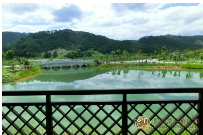
若桑 84 大红袍山庄景致优美

武夷山大红袍山庄紧邻武夷山风景区，是武夷山豪华度假型酒店，方便前往天游峰、玉女峰，拥有武夷山秀美的自然风光环境清幽。