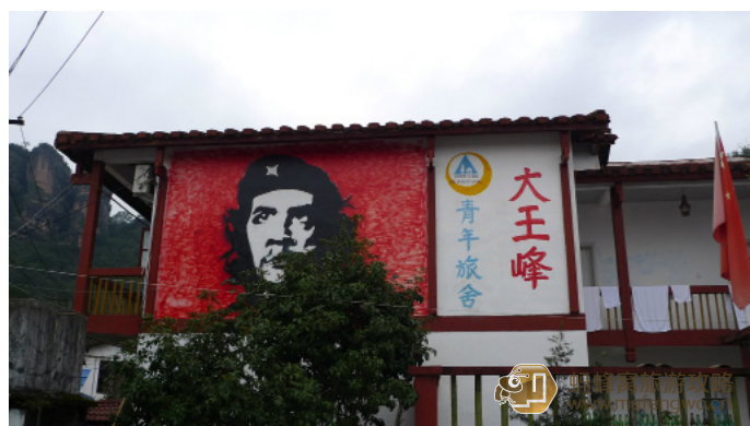
为影癫狂 好评如潮的大王峰青年旅舍

处女座脚印 一早在武夷山大王峰青年旅舍用餐，每人 6 元，有馒头、油条、咸菜和小米粥，没什么特别，但吃得特别舒服。这家旅舍是新成立的，服务人员都非常热情。