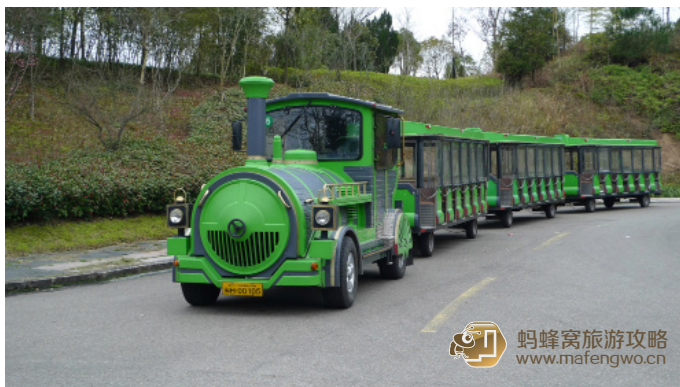
为影疯狂 武夷山的观光小火车