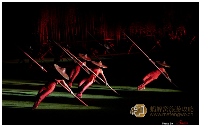
无忌-Sajia 武夷文化的倾情演绎

票价：普通票分为一等票和二等票，票价分别为298元和218元；还设有贵宾席588元、尊贵席688元。