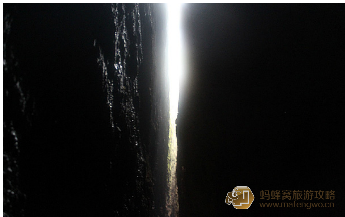
行走天下 狭长幽深的一线天