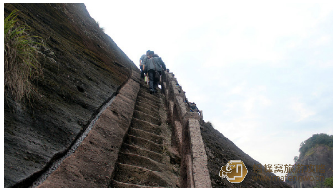
行走天下 虎啸岩的阶梯一面依山一面悬崖

yoyo 虎啸岩的楼梯，险就一个字，像栈道一样，一面依山一面就是悬崖的楼梯。站在山顶回望来时的路，将近一年没运动的我，腿已经有些发抖。其实虎啸岩的海拔并不高，只是陡峭的石阶让人感觉比天游峰还难爬。