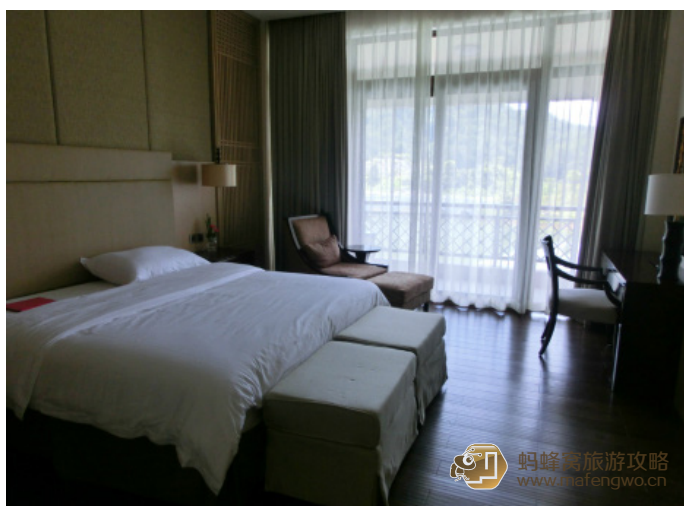
若桑 84 大红袍山庄套房内部一览