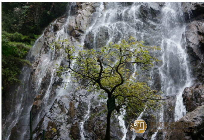
梧桐雨 玉龙谷瀑布

Hyluck 玉龙谷景点离三姑较远，但路边的景致在雨中显得额外清新翠绿，清澈奔流的小溪，隔一段距离就可以看到一个瀑布，哗哗的水声一路都陪伴着我们。