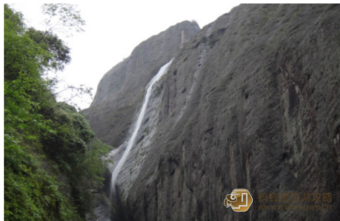
乖乖小小蚂蜂 飘洒山间的珠帘

乖乖小小蚂蜂 进入景点处，有一线小飞瀑自霞滨岩顶飞泻而下，称为小水帘洞，拾级而上，即抵水帘洞。洞顶危岩斜覆，洞穴深藏于收敛的岩腰之内。洞口斜向大敞，洞顶凉爽遮阳。两股飞泉倾泻自百余米的斜覆岩顶，宛若两条游龙喷射龙涎，飘洒山间，又像两道珠帘，从长空垂向人间。