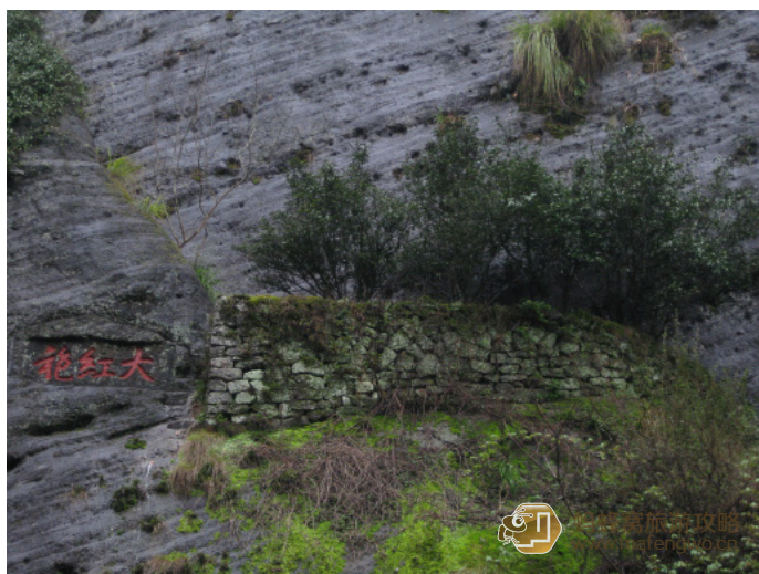
鱼和飞鸟的距离 长在岩壁上的大红袍

寒雪 疲惫渐逝，远远地看着6棵大红袍，它们在自己的世界里，静静地看着红尘滚滚滚滚红尘，素朴而生，任由人们品评着，神化着。大红袍景区显然是经过了加工，包括茶室和附近的亭和一根大红袍标志的石柱等。大红袍茶树生在峭壁上，为防止水土流失，用石头围着，真是国宝哦，为了看这几棵宝贝，从水帘洞开始一直走，实在是累死了。