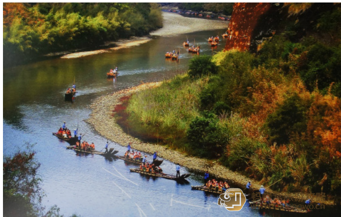
梧桐雨 九曲溪竹筏乐趣悠长

去九曲溪坐竹筏，如果给小费的话，划竹筏的师傅就会讲解，也有的师傅会给你唱歌。漫游水中远观玉女峰和大王峰，在水中两峰拍照留念是最好的位置。竹筏的终点就是武夷宫了，这里面临溪流，背倚秀峰，沃野碧川，风景很美。武夷山博物馆、三姑石、宋街、朱熹纪念馆、柳永纪念馆等都在这里，集自然景观、园林建筑和历史文化为一体，让你一饱眼福。