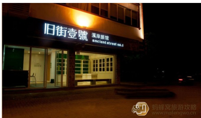
旧街壹號 旧街 武夷山旧街一号溪岸旅馆

橙空释 这个位置在九曲，在三楼，挺温馨的旅馆，看得出老板花了不少心思。房间面对大王峰，早晨起来空气很好，还有专门泡茶的地方。建议老板给窗户加下护栏，浴缸边上就是窗户，小孩会爬上去比较危险。