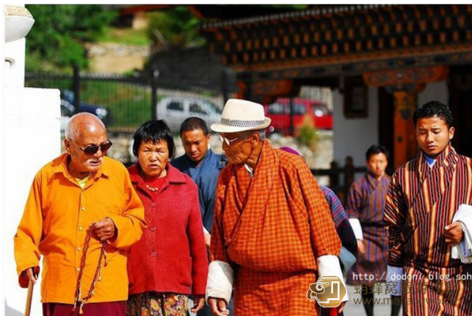
心在旅途 不丹民众