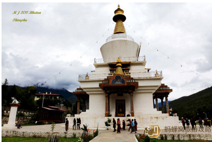
Mikell 这是一个既为纪念已故国王，同时为世界和平而建的纪念碑，也是廷布人每日转塔最集中的地方。