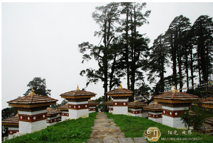
hjh 108 座佛塔

登上佛塔，迎着山谷来的微风，远眺着远处那古老的村庄那清新的河流，旅游的疲惫全被这迷人的景色所代替，神秘的不丹又让你揭开了它一层神秘的面纱。