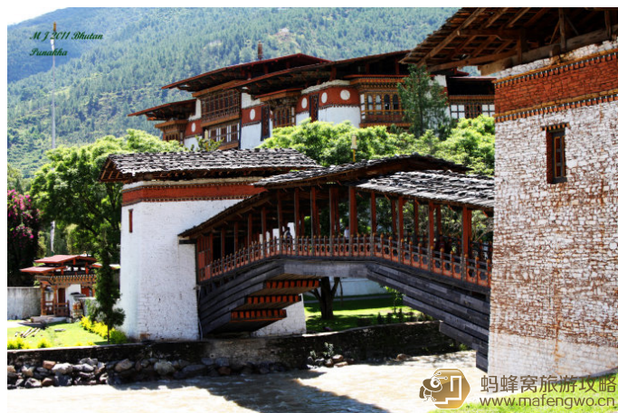
Mikell 如果普那卡宗的美有十分，那么五分来自这座廊桥。

在每年的 10 月 1 日至翌年的 4 月 1 日 (不丹历)，基堪布喇嘛都要从廷布扎西却城堡夏宫搬迁到普纳卡堡过冬。所以，这个城堡在不丹的民族事务和宗教事务方面都占有显著的位置。