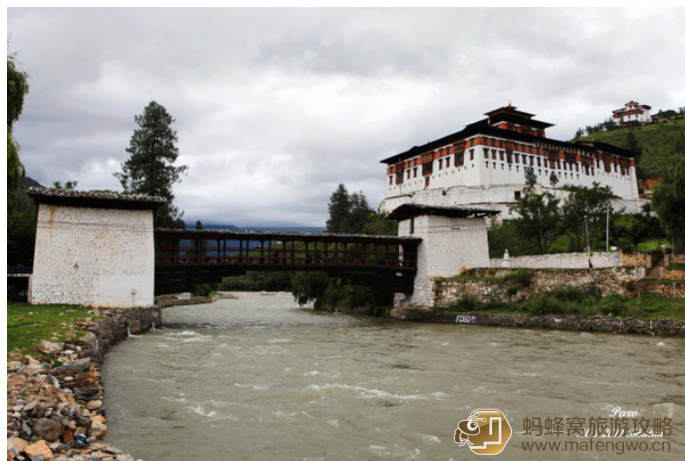
Mikell 从帕罗博物馆往下走，就到了帕罗宗。

这里仍居住着约 200 名僧侣。寺院东南角的礼堂是他们每日用斋饭的地方。盛大的帕罗戒楚节每年春天在这里举行，吸引成千上万的当地居民和游客前往，场面相当热烈。