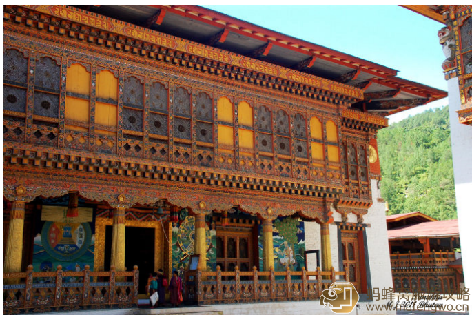
Mikell 寂静的寺院，艳阳普照

Mikell 普那卡宗象个孩子般依偎在父亲河（PH O CH U）和母亲河（M O CH U）的怀抱里。褐色的是母亲河，黄色的是父亲河，他们在此交汇，再一路携手向下游奔去。这里水流很急，是漂流的好地方。