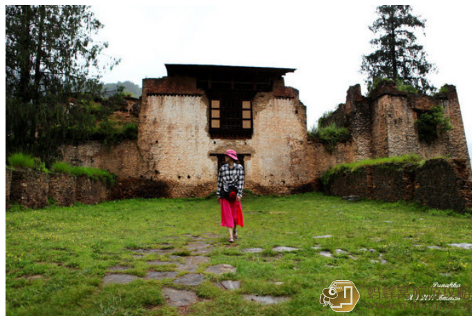
Mikell 落日余晖下落寞的古堡

没给你诠释完整它的含义，你还可以去 Drukgyel 村探访，这个古老的村庄会让你更加了解不丹。