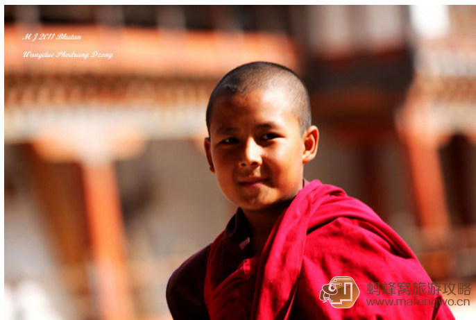
Mikell 不丹人都很幸福吗? 在每一个路人的眼神和笑容里, 也许你能读懂幸福的含义吧。