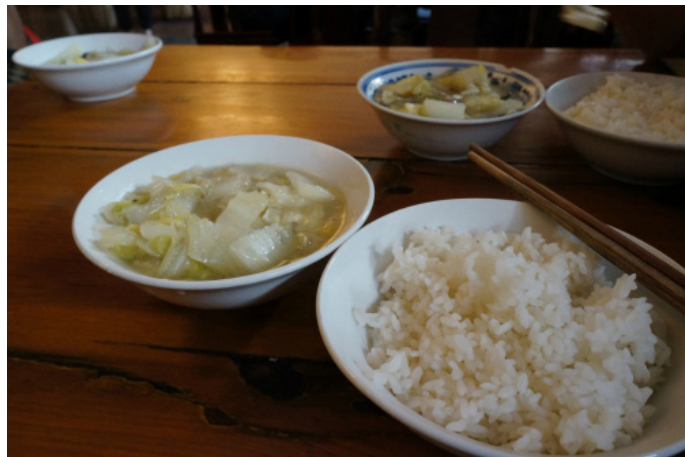
阿呸 10元一位的斋饭舞

iLuvT 旅图 推荐墨鱼，皮皮虾，海鲜面，马面鱼，梭子蟹，红烧刀鱼，卤鹅。建议去舟山海鲜大排档，非常新鲜的海鲜，八爪鱼是活的哦，没有去沈家门，觉得沈家门有点宰外地客人。晚上吃了非常丰盛的海鲜宴，边吃还能边吹着海风，望着夜景。还有海风拂面，舒服极了。