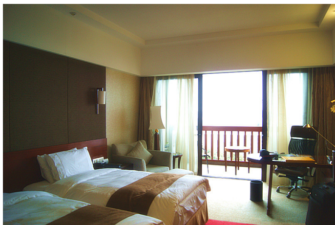
美丽人生 nj 祥生大酒店豪华海景房

小金子 MCC 酒店的房间很大，布置得雅静，厕所也很宽敞整洁。最关键的是有一个很大的阳台，直面大海，因为酒店建在山的崖壁上，所以景观无敌，两把舒适的躺椅，专供吹吹风，看看海，听听浪，很舒服。据说蔬菜是酒店专门开辟的菜地提供，很新鲜。