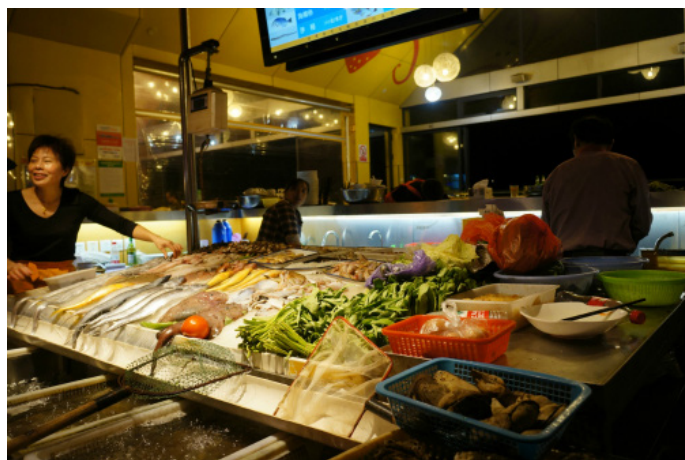
阿呸 著名的舟山海鲜夜排档舞

wuxiansin 标准是60元/人，7菜1汤。我们四大一小也只算4人标准，很值得。