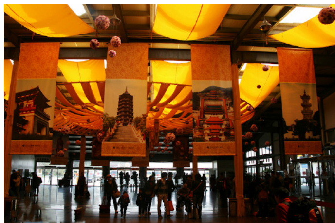
快乐小石头 cs 普陀山码头

普陀山只有一个码头，每天有班船开往舟山本岛（沈家门镇）、宁波、上海等地，从上海也可以乘船直接前往普陀山码头。乘长途客车到舟山后，再到沈家门半升洞码头或者朱家尖前往普陀山十分方便，10分钟即到。