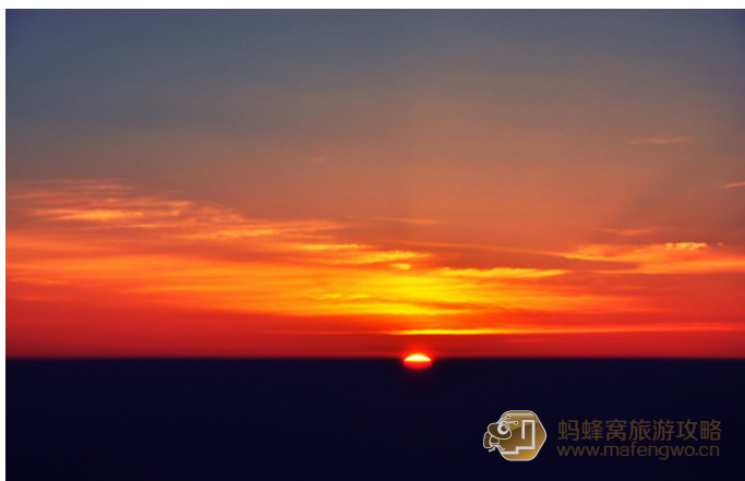
蛋腩的土豆 泰山日出

泰山的日出、雾凇和云海是泰山的三个奇观，很多人为了看泰山日出，不惜夜爬泰山。观泰山日出最棒的地方是在岱顶的拱北石，它是泰山标志之一，如果天气好，还可观云海玉盘奇景。