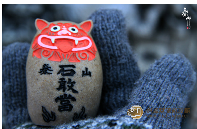
紫皮儿蒜 泰山石敢当

泰山石产于泰山山脉周边的溪流山谷, 其质地坚硬, 基调沉稳、凝重、浑厚, 多以渗透、半渗透的纹理画面而出现, 以其美丽多变的纹理又以年代久远的风化外形而著名。