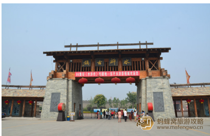
i 走在路上 水浒影视城

东平县位于泰安西南，是水浒故事的发祥地。境内的东平湖是宋代“百里梁山水泊”的唯一遗存水域，有着大量水浒英雄活动的遗迹和故事传说，而水浒影视城更是《水浒》等多部影视剧的拍摄地。自然风光与历史在这里碰撞，来东平，感受水浒文化的精髓吧。