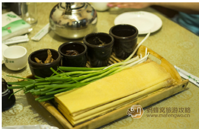
九条一万 赵记煎饼卷大葱