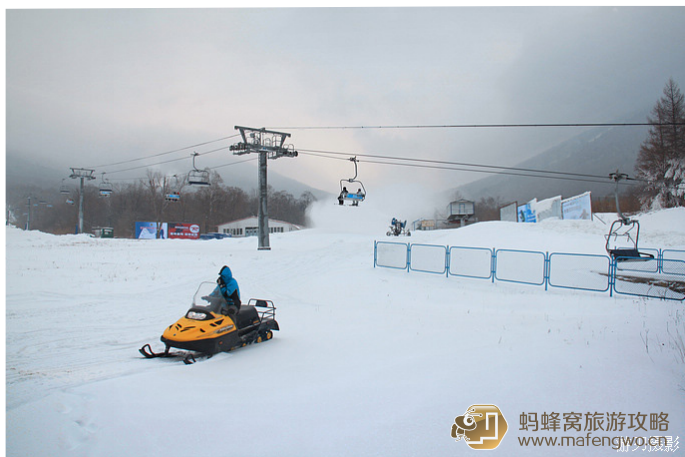
游刃 北大湖滑雪场