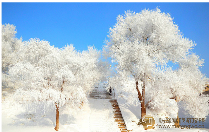
网际飞侠 雾凇岛风光

网际飞侠 雾凇岛除雾凇，还有浓浓的东北味儿可以体验——岛上有草房数间，纸糊的窗户、火烧的炕、报纸糊的墙，虽然条件比不上城市，但吃的是农家风味的饭菜，喝的是东北的玉米酒，有着黑土地特有的豪爽。房间里有个火炕，盘腿坐在炕上，取暖吃饭，一壶烧酒下肚，连嗓门都比平日大许多，让人忍不住感慨：在严冬里，幸福是什么？就是面前这碗热热的烧酒外加小鸡炖蘑菇。