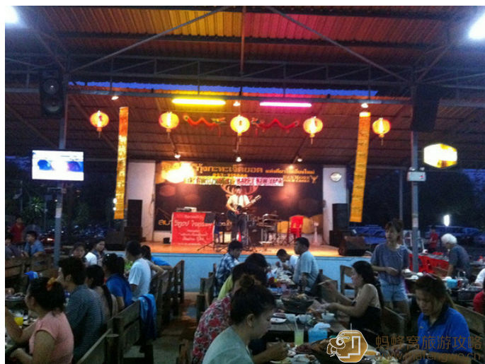
清迈不得不尝的千人火锅

越南部分：越南是四个国家里面小费最低的，如果你看紧自己的口袋，住 guest house，乘坐 open bus，那么 1500 元足够你在越南尽情玩上 10 天！到达河内后，去新咖啡买上你中意的一条线路的联程票，开启你的越南之旅吧！记住，如果首都河内让你有些小失望，那么永远不要忘记，越南越美哦~ 推荐线路：河内——顺化——会安——芽庄——美奈——胡志明 柬埔寨部分：从胡志明乘坐国际大巴到金边，参观包含着血与痛的钟屋杀人场和监狱博物馆，这会令你对这个国家的历史有着更深入的了解。之后前往暹粒，花三天时间在伟大的世界奇迹吴哥窟中迷失自己，完全沉醉于这震惊世界的历史遗迹。如果你有更多的时间，可以去洞里萨湖周边的省份看看，再那里感受最纯粹的柬埔寨乡村生活。推荐线路：金边——暹粒 泰国部分：从暹粒乘国际大巴到曼谷，在这里血拼、参观大皇宫，或是在著名的考山路放纵一次。你可以选择在曼谷周边逛逛，大城、素可泰都是不错的选择，如果去南部的普吉，将会花费更多的时间和金钱。乘大巴直接到达清迈，在这座被称为泰北玫瑰的小城中闲散的呆上几天，保证你永远都不会忘记这座小城带给人的自由、懒散和舒适的气息。推荐线路：曼谷——清迈，曼谷周边和普吉岛可根据时间自由选择去否 老挝：从清迈乘 slow boat 到达琅勃拉邦，之后再前往万荣和万象，最后从万象直接乘坐飞机到达昆明。或者从清迈乘坐大巴到达万象，然后走万象——万荣——琅勃拉邦这条路线。可以乘坐国际大巴从琅勃拉邦回昆明。省下机票钱去品尝更多的美食吧！