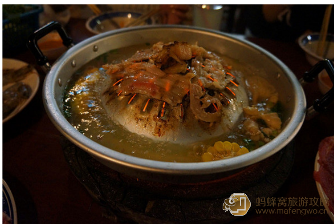
戒了酒的 CJ 是冠军 底下可以加汤涮肉，突起处可以烧烤，一锅两吃

在河两岸的大街上全是市场、摊点，可以吃上鱼、各种汤，有时还有烤肉。万荣主要的一条街 Thanon Luang Prabang 上旅馆、餐馆、酒吧众多，在一家叫 Nazim 的印度餐馆可以吃到美味的印度菜。一定要在南松河边看看日落及晚上泡泡露天酒吧。