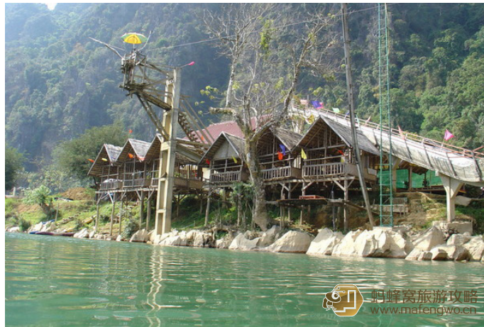
flying 里里 万荣高空跳水

皮划艇一日游通常包括沿着几处急流顺流而下，然后参观溶洞和村庄。找一家价格便宜的旅行社之前，请先查看导游和行囊的质量。推荐 Riverside Tours 和 Green Discovery 两家旅社。