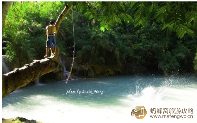
苹 and 猫 老外特别会跳，能玩出很多花样。

位于琅勃拉邦以南 30 公里处。景区内植被茂盛，曲径通幽。三层瀑布倾泻而下，形成多个泛着蓝绿色光泽的水潭，众多当地人和老外在水中嬉戏，痛快淋漓。可以沿山间小路上到瀑布顶层，但路实在不太好走，小心为妙。