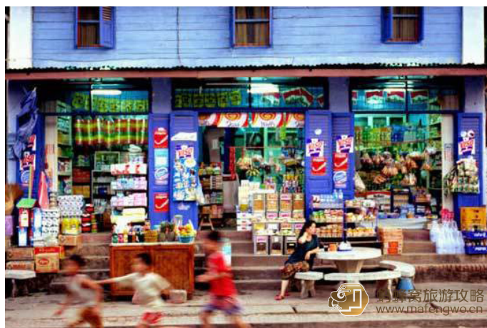
枫姿 万象街头小铺

宇の乐 ：省钱技巧：中国人把淳朴的老挝人带“坏”了。出门坐车，找旅店还是要砍价。坐车砍价一般砍一半，大旅店单个标间就在 50000 左右，在万象买纪念品还比较便宜，好歹也是老挝的商品集散中心都嘛。