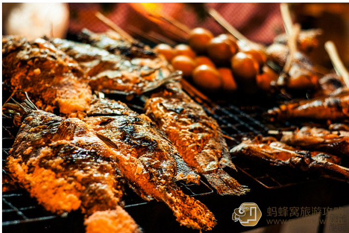
原老未 街边的烤鱼