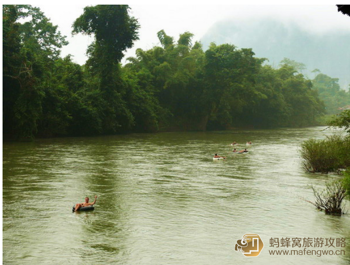
老兵 在万荣漂流的老外们

玩够了，把轮胎扔进河里，躺在轮胎上。浸泡在清凉干净的南松河中，就当自己是一叶小舟顺流而下。看到河边哪家酒吧顺眼，招呼一声就有小弟扔绳子过来拉你上去，继续喝酒发呆晒太阳。