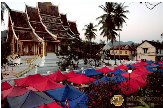
shaun 皇宫博物馆外就是琅勃拉邦夜市