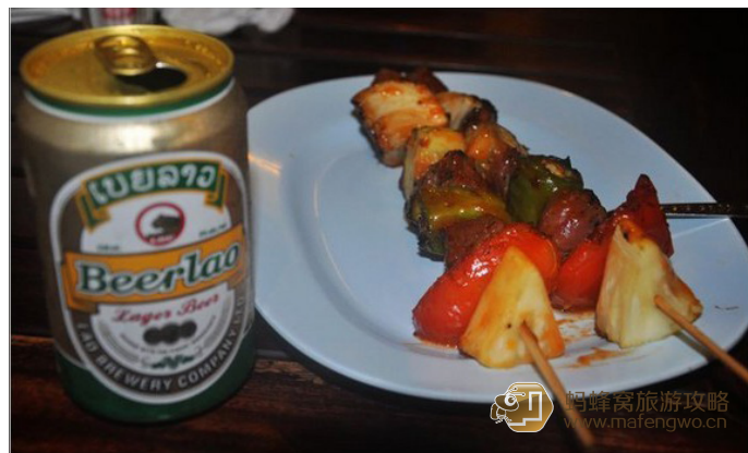
三口品天下 de beer lao+ 烧烤

要想节省费用的话，可以到 Th Kitsalat 街与河畔之间的 Th Chao Phanya Kang 街，这里晚上对车辆关闭，并成为一个小吃夜市，有成排的小吃摊。你可以坐在户外的木质长桌凳上，品尝琅勃拉邦的特色小吃。