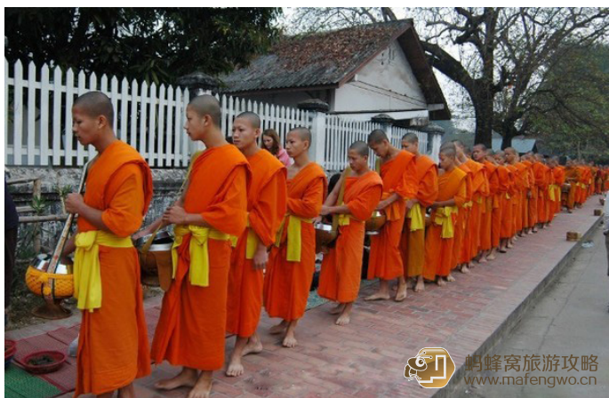
tuxiaoqi 琅勃拉邦清晨布施