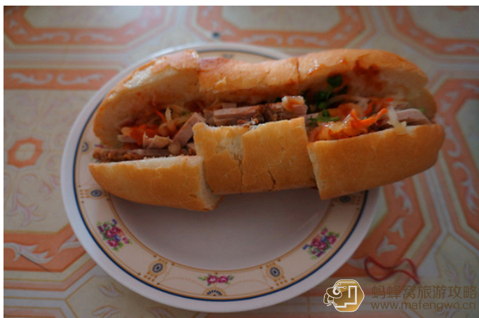
戒了酒的 CJ 是冠军 东南亚最常见的早餐——法棍

法式长棍面包是一种很受欢迎的早餐食品。有时人们还会搭配炼乳或者鸡蛋做成三明治，里面放上老挝式的肉酱和蔬菜，是最经济实惠的早餐。