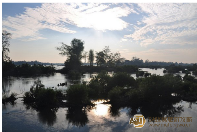
老马 美丽的东德岛

租一辆摩托车到处闲逛，沿途经过稻花飘香的水田、碧波绿水中洗衣服的岛上居民，骑车去东阔岛南端观察珍惜动物伊洛瓦底江豚，或者租一个轮胎内胎漂流而下，一路可以看到渔夫和打盹的水牛。