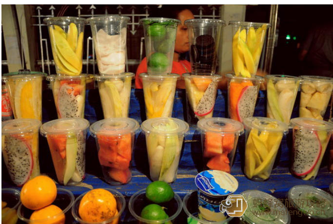
shaun 琅勃拉邦夜市的 fruit shake

夜市上小摊出售的 shake 最便宜，卫生条件也不错，5000KIP/ 杯，Mix fruit shake、Papaya+Pineapple、Strewberry 等口味都不错。