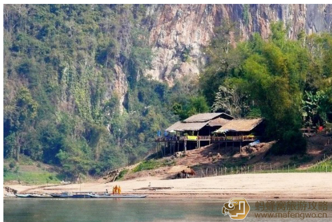
tuxiaoqi 乘慢船看到的湄公河两岸景色