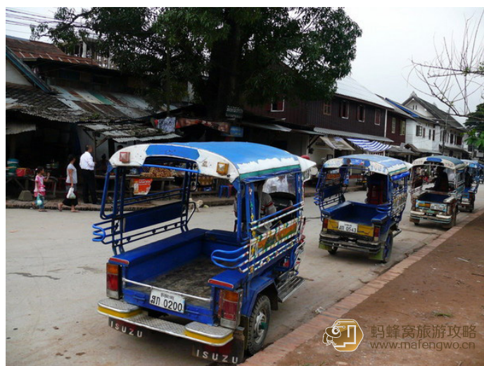
老兵 著名的“TU—TU”, 一路下来主要和它打交道了

是国内和国际长途汽车主要的发车地点, 从市中心花费 5000kip 搭乘 tuk-tuk 就可以到这里了。前往琅勃拉邦可以从这里坐车。