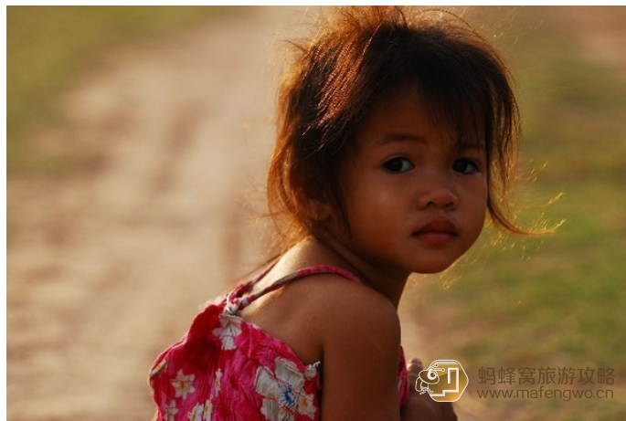
喜欢吃糖的人 可爱的老挝小女孩

可以从这里前往巴色，旅馆每天都有面包车开往巴色。另外，只要付现金，开往东德岛和东阔岛的船随时发车，老板们就待在大桥附近的树下。另外也可以请旅馆代为安排。