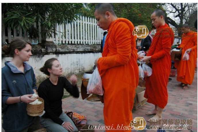
tuxiaoqi 每天都有不少外国游客加入这种仪式的行列

每天清晨天刚亮时在较大的寺庙周围都会上演，一定要看，可以体会当地人虔诚礼佛的一个侧面。要早起，6:00 到场。