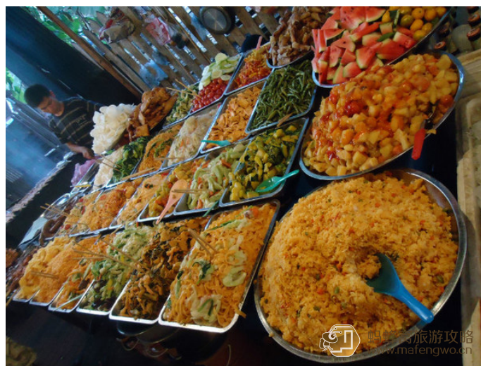
宇之乐 万象 buffet

河畔户外小吃摊 (Th Fa Ngum;5~11pm) 这里有很多的摊贩售卖鲜美的老挝和中国佳肴。在 Th Fa Ngum 路以外直到 Sunset Sala Khounta 还有更多这样的户外餐厅。