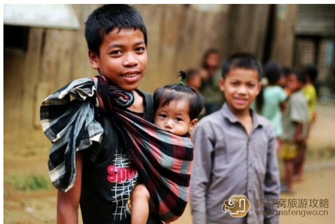
小鹏 勐威村的孩子们