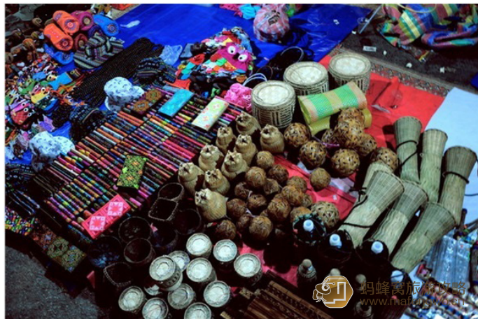
shaun 夜市上各种手工制品

一定不能错过这大好的扫货机会，在琅勃拉邦的夜市上，你将看到各种稀奇古怪的小玩意，大部分由当地人手工制作，还有那色彩缤纷的 buffet，只要 10000kip~ 再喝上一瓶 beer lao，简直爽哉！