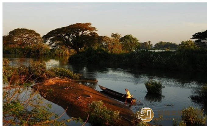
喜欢吃糖的人 岛上渔民