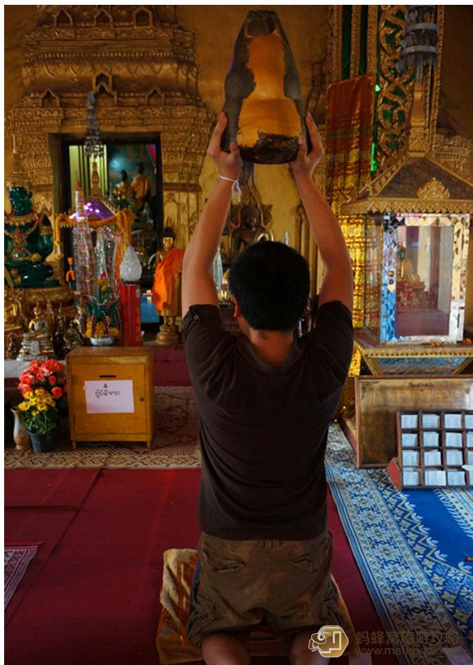
戒了酒的 CJ 是冠军 西蒙寺许愿