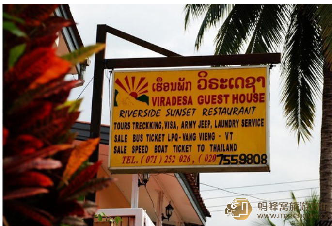
明明是自由的鱼 推荐住宿

Villa Santi Hotel 位于琅勃拉邦以南 6 公里处，有班车往返于市中心和机场。宾馆结合琅勃拉邦富有文化气息的传统风味，花园周围环绕装饰了睡莲。在客房可以俯瞰成片的稻田。房内有独立卫浴、空调、吹风机和室内保险箱。为使旅客感受轻松如意，饭店提供按摩、桑拿和 spa。房价 70-100 美元左右。