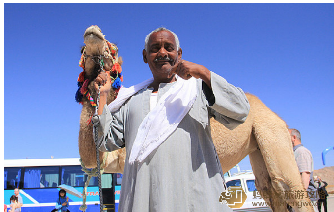
年波也则 牵着骆驼的当地人

早起前往西岸的帝王谷，感受古老帝国的历史，然后渡过尼罗河到达东岸，感受尼罗河的无尽魅力，下午在卢克索神庙和卡尔纳克神庙参观，欣赏雄伟的建筑和精美的壁画，晚上还可以欣赏精彩的声光表演。