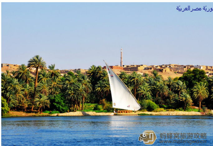
向你们学习 尼罗河上的帆船

此外，由于风向问题，除非你有足够长的时间，否则不建议乘坐三桅帆船进行长途旅行（例如到阿斯旺）。反过来，从阿斯旺到卢克索，行程会更为轻松顺畅。