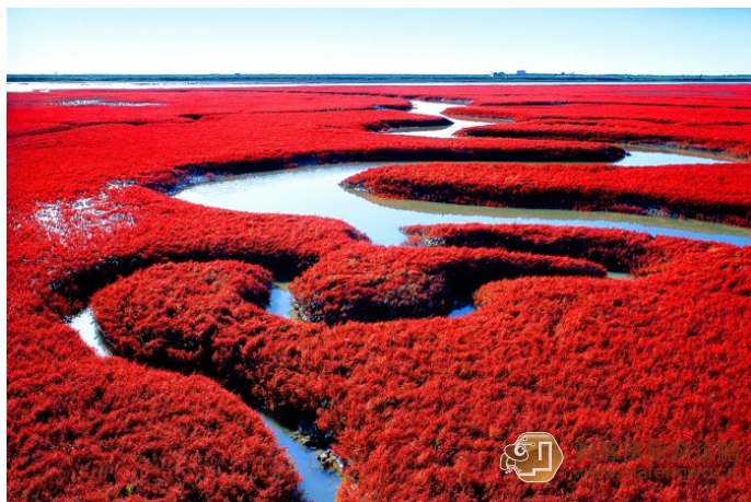
冷风草堂 盘锦红海滩

2、游苇海观鹤: 因该景区为独立景点, 会在去红海滩景点途中经过, 没有景区观光车可直达, 需自乘出租车或三轮车, 费用一般5元/人。