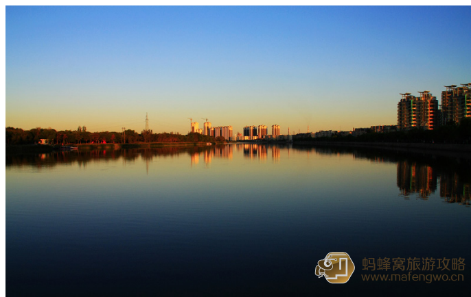
浅蓝 清晨的湖滨公园沉静美丽，芦花在金色的阳光下摇曳。