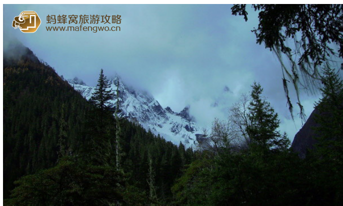
丁丁 四姑娘山长坪沟

建于公元779年，相传初为唐时百偈杂纳在嘉绒藏区译经传法时修建的石塔，后朝拜者众，至清乾隆一年，沃日土司创建了四姑娘喇嘛寺，为藏传佛教格鲁派寺院。“文革”中因火灾损毁。此地也是历代土司祭拜四姑娘山的地方，是四姑娘山的最佳观景点之一。