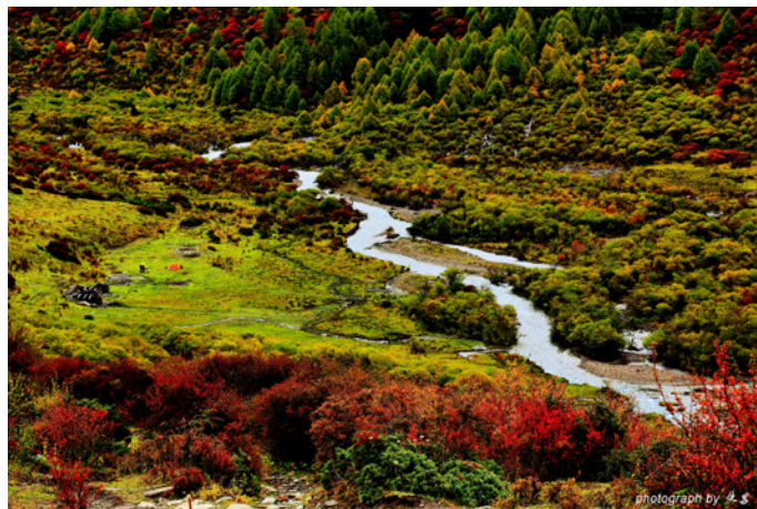
侠客 美丽的大海子