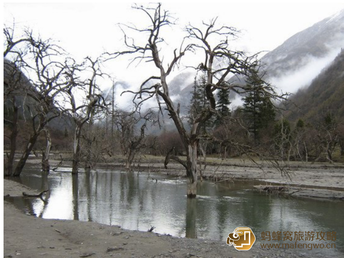
hxfan 双桥沟 - 盆景滩

双桥沟是目前四姑娘山中唯一不需要骑马就可游览的沟，景区主要以雪峰、牧场、草地、森林等为主，是四姑娘山最美丽的沟。