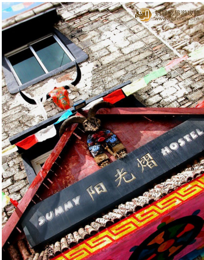
回忆曾经'寂如流年' 阳光熠国际青年旅舍