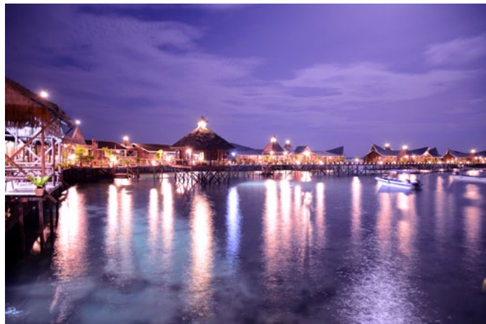
FrancesQ 夜幕中的 singamata 度假

OW 费用参考：900 马币 / 人 网址：www.singamata.com/cn