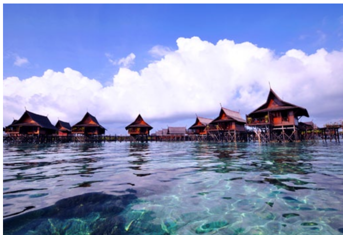
FrancesQ 卡帕莱度假村的水屋

入住这里需要通过代理或是在官网直接预订，大体分为两种套餐，一是深潜套餐，二是浮潜套餐。当然也可以在这里报名潜水课程。