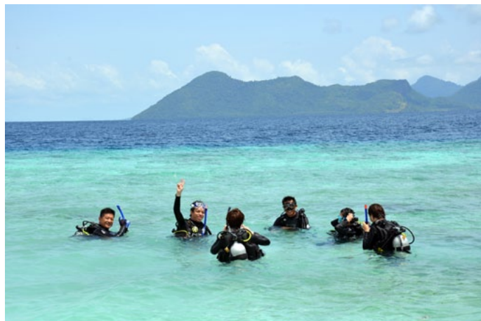
FrancesQ 教练带领学生入水