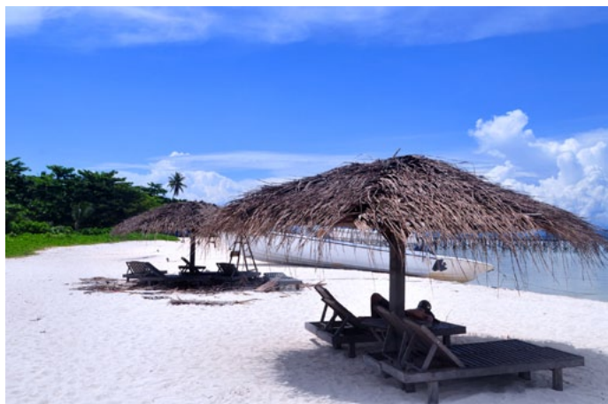
FrancesQ 静谧的马布岛度假村