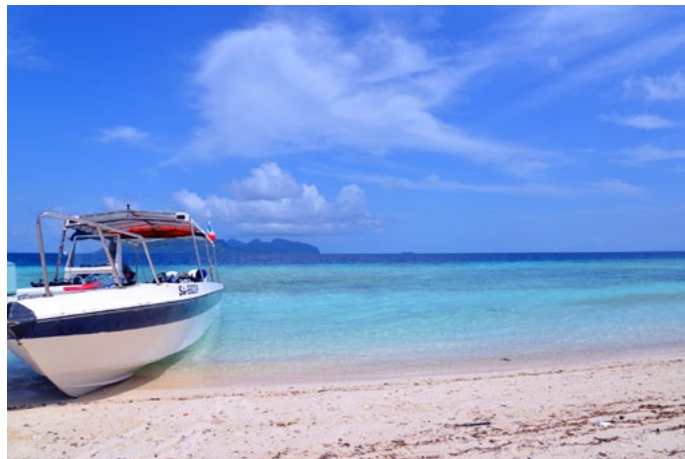
FrancesQ PomPom 岛沙滩

静的世外桃源小岛。PomPom 岛以海龟保护项目而著名，住客每晚都可跟着工作人员参与寻找海龟蛋和小海龟活动。找到后将海龟蛋放到保育中心孵化，小海龟则直接放归大海。PomPom 岛拥有沙滩屋和水屋的选择。沙滩屋空间很大，躺在露台的躺椅上就能直接看到海景，缺点就是蚊子比较多。水屋比较少，不太好预订，有小梯子直接入海，方便浮潜。