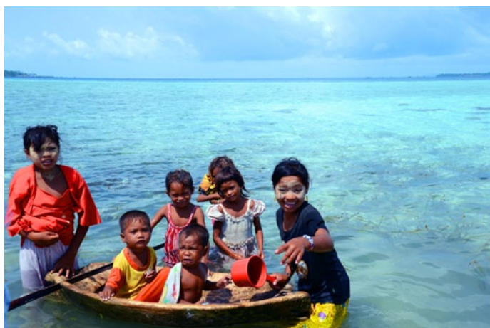
FrancesQ 岛上的巴天族原住民孩子