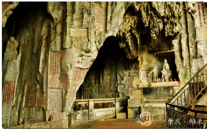
稻禾 七星岩的石刻群

星岩烟雨最佳观赏点：红莲水榭白玉桥头处。水月岩云最佳观赏点：五龙亭对开水月堤处。