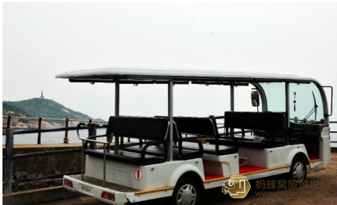
梦一去三年 庙子湖岛上的观光车。