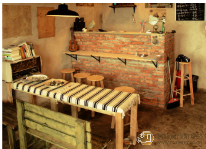
东巴木偶 旅舍的设计很费了些心思，每一个细节都设计的充满文艺气息。

林炎 小宝 哪吒青年旅馆，这是一个充满文艺气息的旅馆，老板夫妇是一对 80 后，辞职来到这个海岛开旅馆，每天对着这片蔚蓝的大海。里面的装饰比较文艺，老板一看就是充满的艺术范的人，长长的头发，浓浓的胡须，更加彰显他的艺术气息，晚上还拿着一把吉他，在那里弹琴，或许，这才叫生活，又或许不是每个人都可以忍受这种孤单的，物资稍微匮乏的海岛生活。