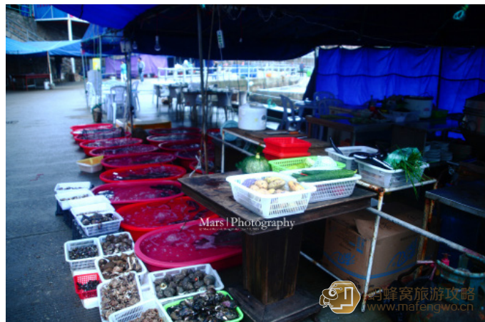
Mars 昊 石码头海鲜大排档的摊位前堆满了各种海鲜。

如果你想享受夜排挡吃海鲜的感觉，就只能在“庙子湖”石码头附近的夜排挡吃了。不过 6 月 1 日 -9 月 1 日是禁渔期，野生海鲜是很少的，大部分都是人工养殖的，而且都是从沈家门采购过来的，价格其实比沈家门还贵。特别说明一下，那些养在塑料盆里的活的海鲜，基本都是人工养殖的，但是夜排挡老板一般都会说：这都是正宗野生的。千万别上当哦，野生的海鲜哪里会是活的。这个秘密当地居民都知道，如果想吃正宗野生海鲜的，请直接联系旅馆的阿姨们，她们会帮你采购来的，价格比大排挡的便宜多了。