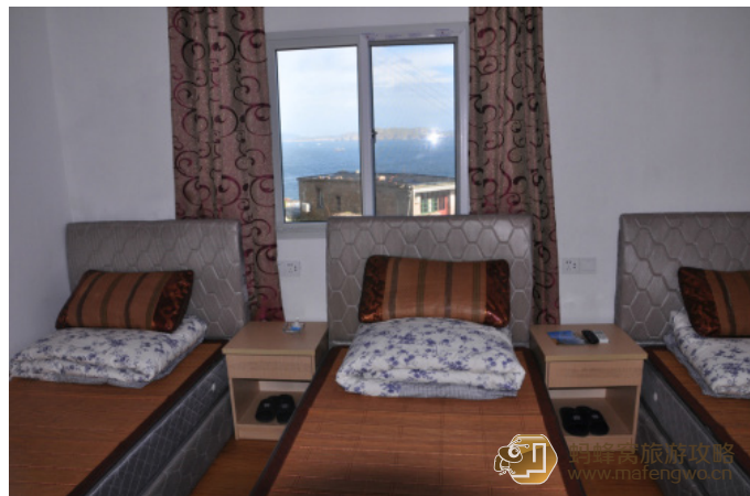
心有张结 海客之家的房间还是很干净的。

心有张结 离码头很近，步行只要5分钟，上坡拐弯即是。名副其实的海景房，下楼即是海。干净的厨房。因为东福山上没有商业，只能在渔家吃饭，卫生条件是很重要滴！店主和他父亲都是老渔民，喜欢钓鱼的朋友可以租一副鱼竿，跟着房东一起去海钓。