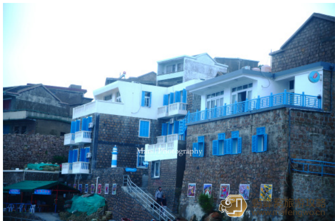
Mars 昊 石码头客栈的外观