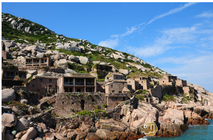
查拉苻 大树湾石屋群像

石屋依山坡地势而建，连成一片，形成一个错落有致的渔村，从远处看整片石屋，犹如一座巨大的古堡，神秘而肃穆。如今大片石屋都已经废弃，无人居住，静静守候在海边。