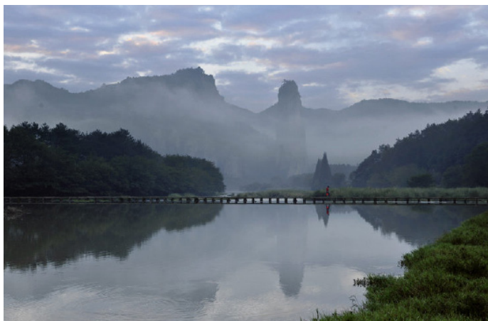
走马观景 晨雾中的仙都鼎湖峰