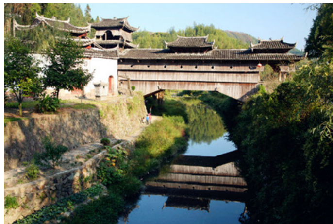
白水泥 庆元的如龙桥

白水泥 前几年造访过泰顺，得遇北涧、三条、毓文诸廊桥，便觉得泰顺应该是廊桥之旅的首选了。回来翻阅一些廊桥相关典籍之后，却发现泰顺的邻居庆元，才是真正的廊桥集大成者，其中举水乡月山村，二里路的范围内便有十座风格各异的廊桥，其中名气最大的如龙桥即是其中之一。