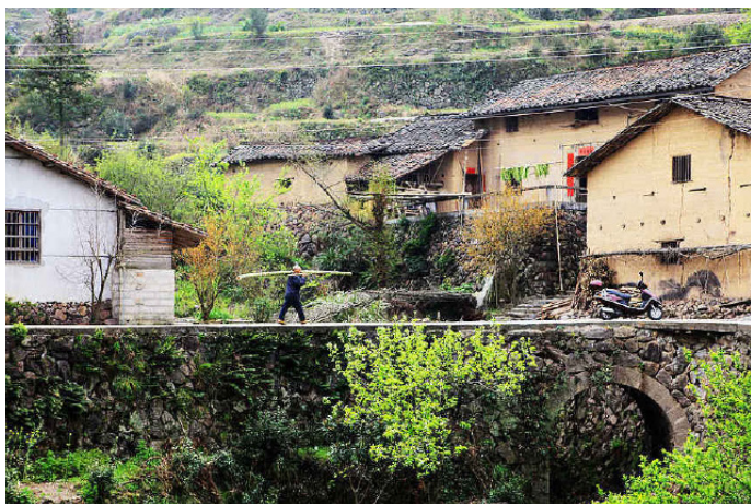
九华山 独山村系由当地土著建立，与闽汀移民无关