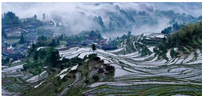
尼洋 日落时分的梯田展现在眼前，云雾辽绕，如入仙境一般