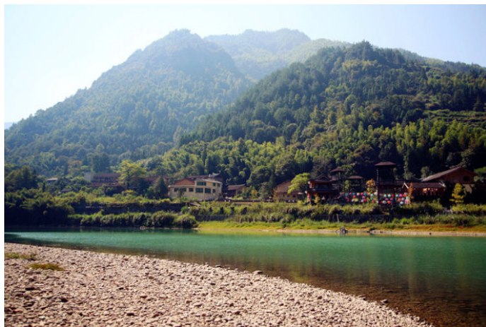
白水泥 古镇的精彩处还在小溪边，青山环绕，玉带缠腰。

白水泥 小溪边的大均古镇号称是畲乡文化展示之窗。我感觉国内的民俗园，往往改不了婚庆表演的俗套，找个男游客做新郎，整一个穿民族服装的戏班子闹一番，然后收很贵的门票。这个东西确实是相当矛盾的，如果纯粹原生态的生活，游客能欣赏的不多，对经济也没啥拉动作用，但是这种表演看多了实在让人反胃，那些演员估计也是同样的感受。两全之策是，弄一个这种游乐园，其他的地方好好保护起来，但是商业的腐蚀性太强，看着别人村子赚大钱，有几个能够守得住，就像江南水乡周庄一红，到处都弄，现在已没有什么清净的地方了。古镇的精彩处还在小溪边，青山环绕，玉带缠腰，还有三叠廊桥点缀其中，如果忽略那堆扎眼的婚俗舞台，还是颇有些生活的意境。