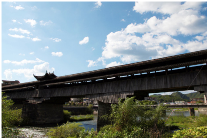
小强 永和桥 (永安桥) — 浙江最长木质廊桥

离开安仁，从丽龙高速石塘出口下，沿 53 省道经过紧水滩水库回云和。逛完正好回到云和湖宾馆吃晚饭。开始明天有一天新的旅程。