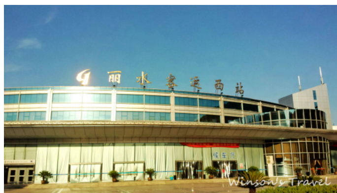
小强 永和桥(永安桥)——浙江最长木质廊桥