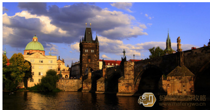
空心花瓣 查理大桥