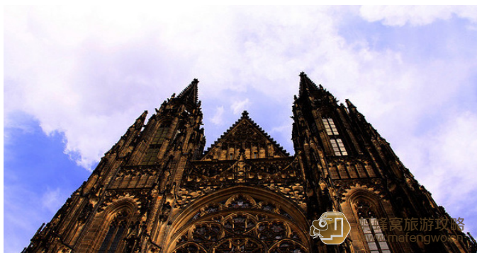
空心花瓣 圣维特大教堂