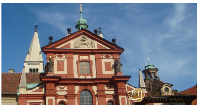
空心花瓣 圣乔治教堂

到达交通：乘22路有轨电车到Prazsky hrad站下，也可乘A线（绿线）地铁在Malostranska或Hradcanska站下，通过查理大桥，沿着石阶向上，经过圣维特大教堂，即可看到圣乔治教堂。