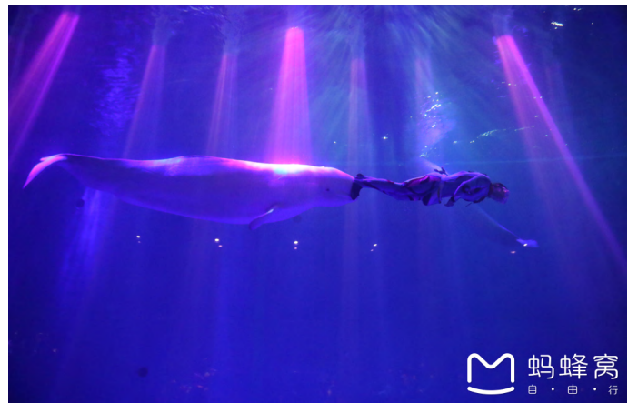
小圈圈 大白鲸顶着表演者在深约 4 米的水中 360 度旋转。