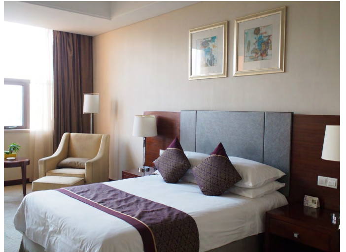
美洋洋 jackie 国信大酒店房间接近 40 平米，很宽敞

交通便利，近万达和钵池山，周围环境很安静。房间设施较新，比较有特色的是赠送《西游记》小人书和当地报纸阅读。另外也有水果赠送，早餐比较丰富。