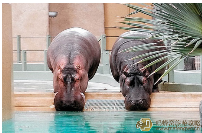
阿皮 卡尔加里动物园