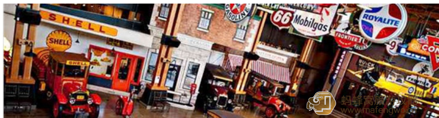
阿皮 Gasline Alley 博物馆

牛仔节期间，不论男女，牛仔或是游客，全都一身牛仔装扮，穿上格子衬衫，换上牛仔靴，这身简单的装扮立刻让你能更加融入节日，成为牛仔节的一个参与者。而卡尔加里人更是将牛仔节视为神圣的节日：职业白领会请假去做牛仔节的义工，老板也会欣然批准；餐厅会在牛仔节期间在广场上免费向市民和游客发放早餐；学生们日日排练，渴望能够在牛仔节的开场表演上一鸣惊人。如果你发现一个白发苍苍的老人佩戴着“牛仔节志愿者”的牌子也绝对不要惊奇，这便是卡尔加里的精神。