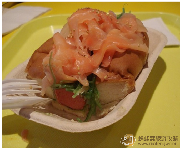
连开心 Tubby Dog 里的日本风味热狗

北美的完整大餐一般是“主食某种 meat+ 一两样蔬菜 + 土豆泥 or 米饭面条 + 饭后甜点 ( 各类 cakes 和冰激凌 )”。不过不是人家不丰盛，主要是口味儿不合咱中国胃。