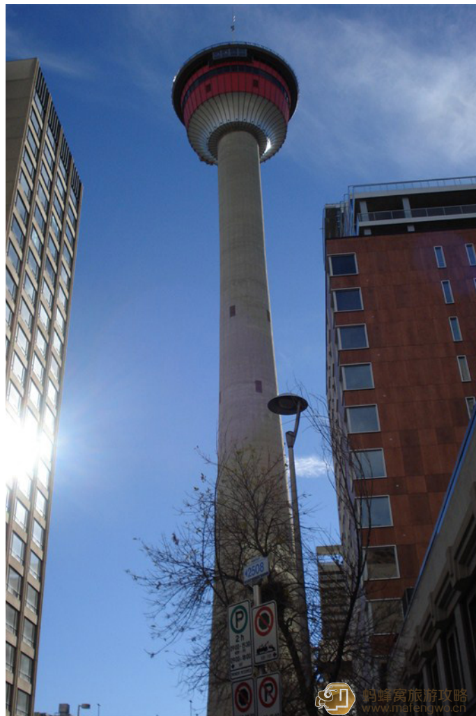
连开心 卡尔加里塔